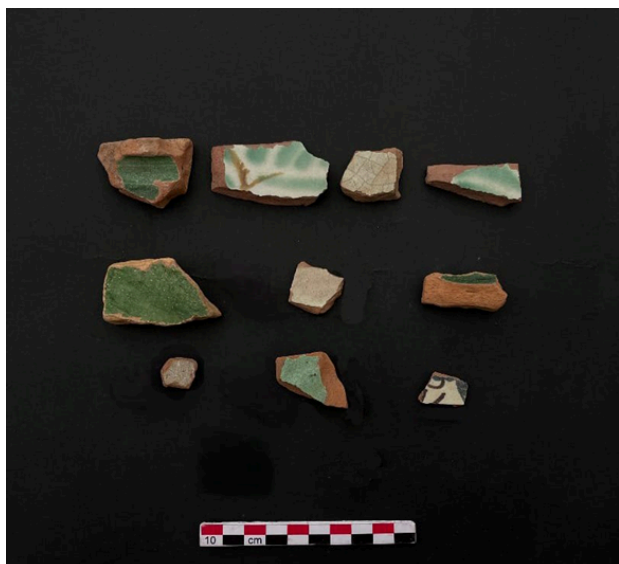
Fig. 4. Vista de los fragmentos coloniales recuperados en el activo 470.