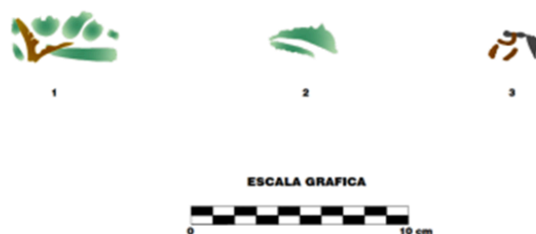
Fig. 3. Vista de los diseños fitomorfos más resaltantes pertenecientes a la fragmentaria recuperada en el activo 470.

Para los estudios realizados sobre la composición de la pasta cerámica, se tomaron como referencia los criterios propuestos por Chávez (2011), quien clasifica este tipo de material dentro del estilo conocido como Panamá Policromo. Según el autor, dicho estilo se caracteriza por una pasta de tonalidad rojo-ladrillo, característica que también se observó en los fragmentos analizados de nuestra muestra cerámica.