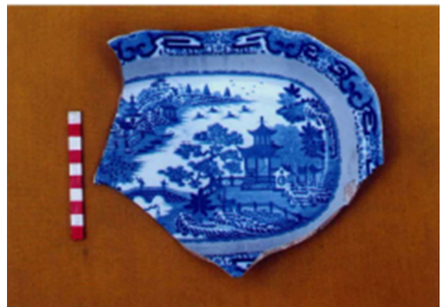
Fig. 2. Loza Pearlware decorada por impresión con un motivo chinesco, primera mitad del siglo XIX, excavada en H. Yrigoyen 979, Buenos Aires.

La investigación desarrollada por Schávelson, D. (2001) tiene como propósito principal realizar un análisis y exposición de un catálogo de cerámica colonial mediante la revisión detallada de diversas colecciones. En este contexto, se tomó como muestra cerámica procedente de los cabildos de la región del Río de la Plata, especialmente Buenos Aires, y se llevó a cabo un análisis meticuloso utilizando fichas técnicas correspondientes a dichas cerámicas. El estudio evidenció que en los resultados obtenidos se destaca el intenso trabajo realizado con las cerámicas provenientes de Santa Fe la Vieja y del Cabildo de Córdoba, las cuales abarcan un muestrario asociado a la segunda mitad del siglo XIX. Asimismo, las colecciones provenientes del Cabildo de Mendoza reflejaron una secuencia continua desde el período tardío del siglo XVIII hasta el presente. Por otro lado, las excavaciones efectuadas en San Francisco, dentro de la misma ciudad, revelaron piezas cerámicas que datan desde el siglo XVII en adelante.