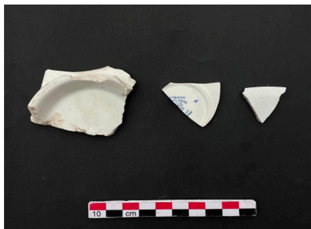
Fig. 5. Vista de la losa impresa por transferencia recuperada en el activo 470.