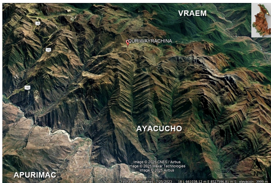
Fig. 1: Imagen satelital con indicación de punto donde se localiza la plataforma de Qoriwayrachina.

En el departamento de Ayacucho, la investigación arqueológica sobre los ushnus ha sido escasa. Muchos de estos sitios permanecen ignorados por la arqueología local, lo cual plantea una necesidad urgente de estudios sistemáticos que permitan comprender su distribución, función y simbolismo.