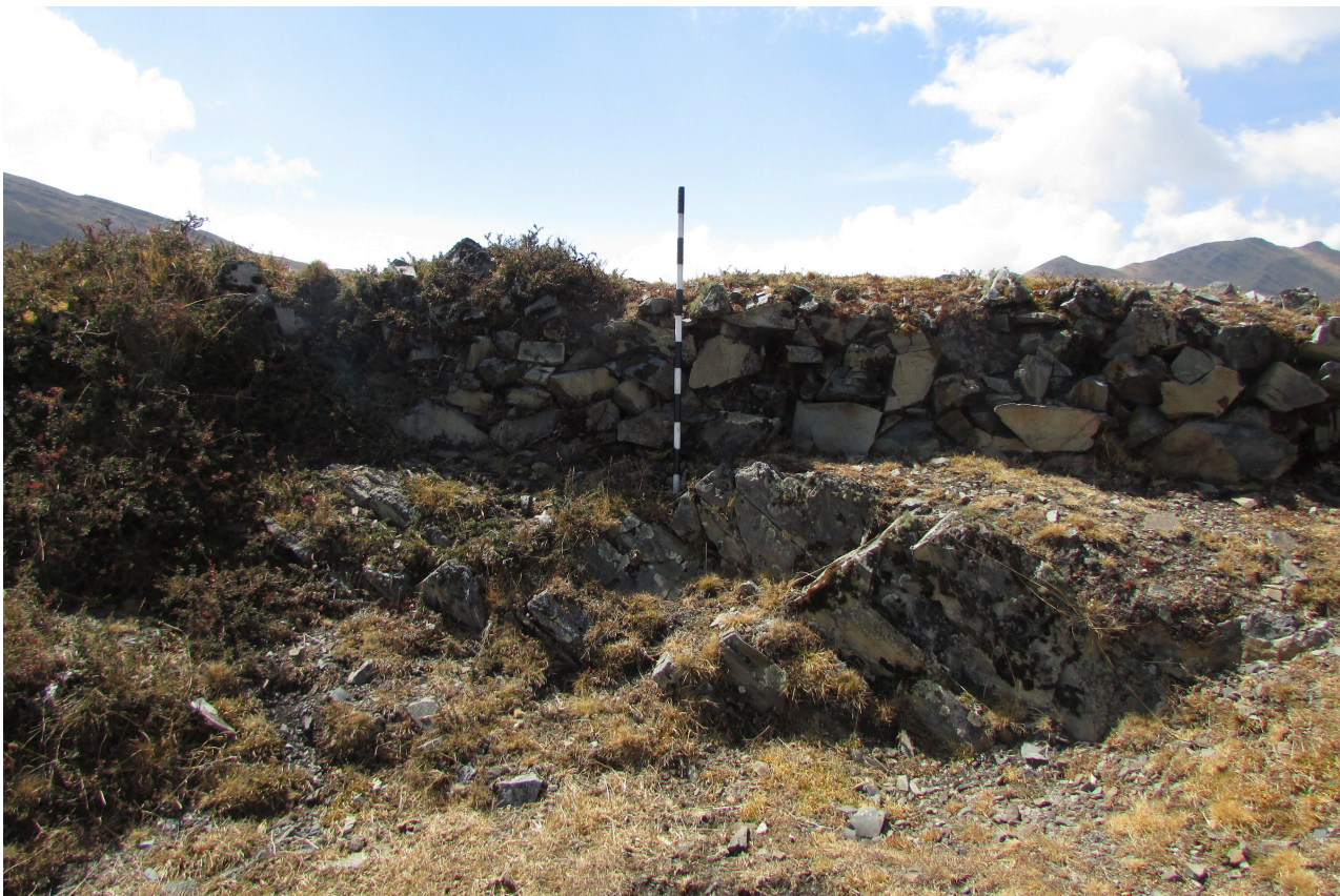
Fig. 3. Fotografía de la vista longitudinal del segundo nivel de la plataforma, donde se aprecia la conformación del muro, compuesto por piedras naturales dispuestas de manera superpuesta.

Su singularidad no solo reside en la estructura misma, sino en su posición periférica entre dos ecosistemas distintos: la sierra y la selva. Esta condición liminal le otorga un valor especial, ya que posiblemente actuó como un punto de transición y contacto entre dos mundos culturales y ecológicos, a la vez complementarios y distintos.