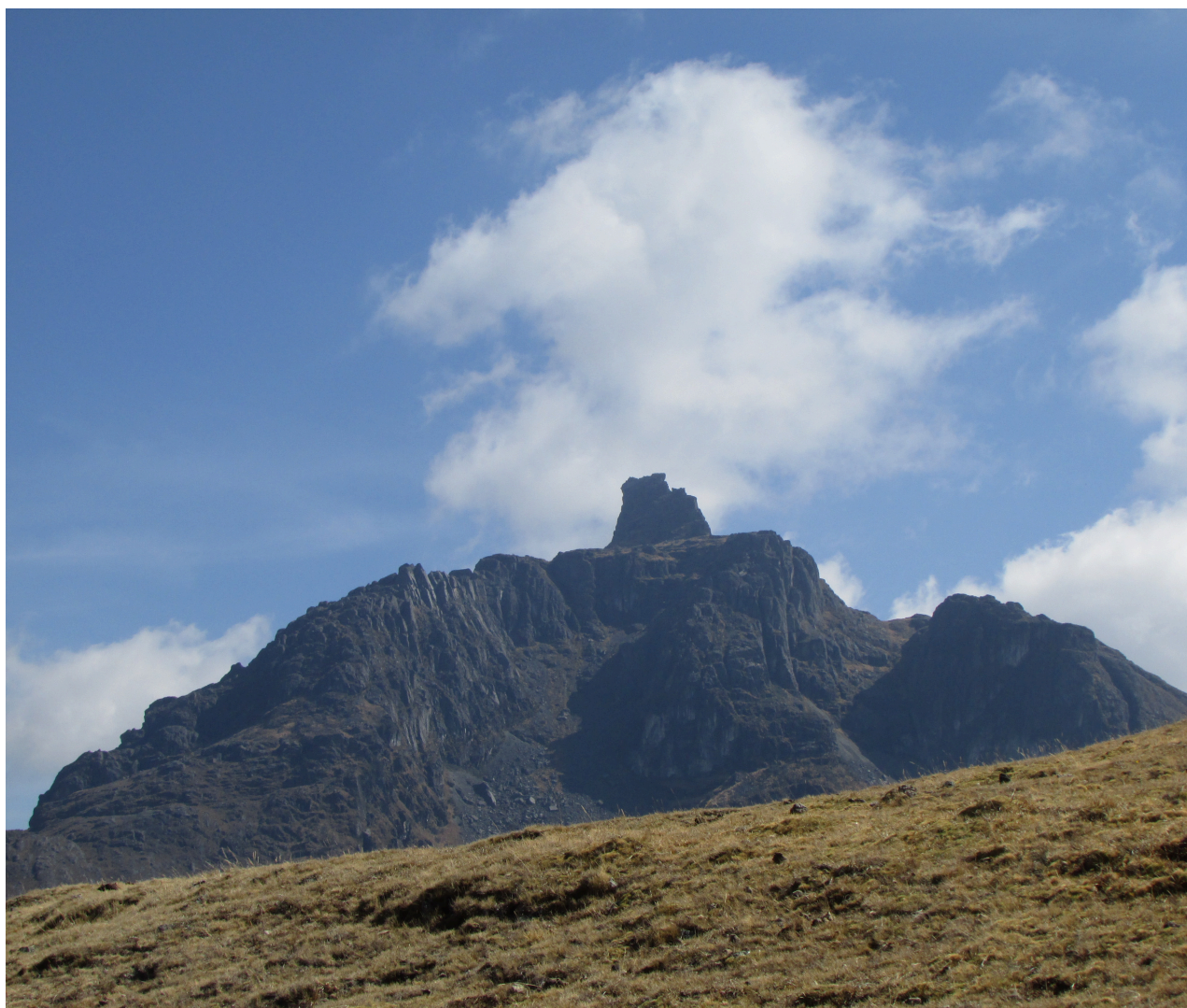
Fig. 4. Vista fotográfica de la montaña sagrada de Intihuatana, cuya morfología, caracterizada por picos rocosos, evoca la forma de un altar natural. Se trata de la montaña tutelar de esta zona aislada del noreste de Ayacucho