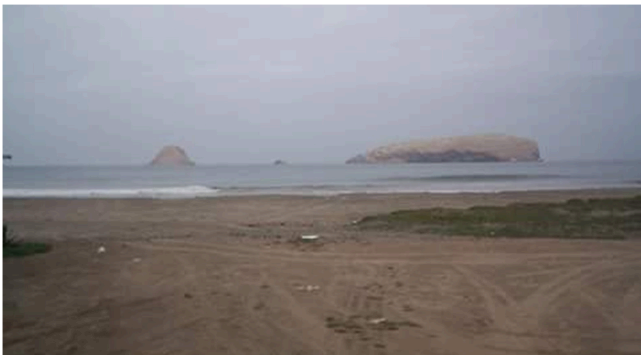
Fig. 4. Islas de Pachacamac fotografiadas desde el litoral.

Sin embargo, no debe generalizarse pues el rol que cada isla tiene parece ser muy específico, de acuerdo a la identidad de algún ser sagrado que habite la isla o sea la isla, además de la época o el pueblo al que pertenezca dicha tradición. Asumir todas las islas como adoratorios de Wamankantax (deidad del guano), como residencia de los muertos, ancestros petrificados, etc. sería un error tan grande como pensar que lo que pensó un determinado pueblo sea válido para todos.