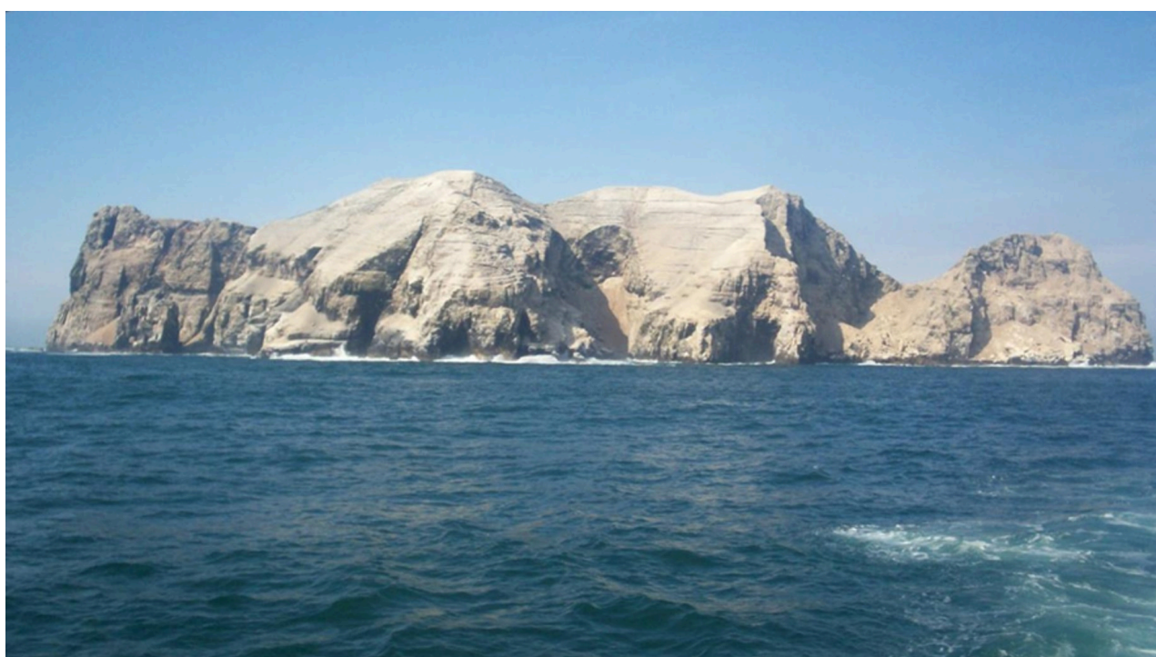
Fig. 3. Isla El frontón fotografiada desde un yate.

El vínculo de las islas con los aspectos femeninos del cosmos tiene más fuerza al analizar la evidencia etnohistórica y etnográfica. San Lorenzo está vinculado a la luna en la cosmovisión yanasha como su "lugar alto" que podemos interpretar como templo; si el término Sina fuera metátesis de Sian (lengua muchik) también tendríamos vinculación con la luna. En el caso de El Frontón, esta es el resultado de la conversión en piedra de Arosh, un perro mitológico; cánidos y zorros están vinculados a la luna también (Vargas 2022) y existe evidencia arqueológica de representaciones de cánidos en prendas de vestir femeninas del Horizonte Medio de Lima (Ibid.).