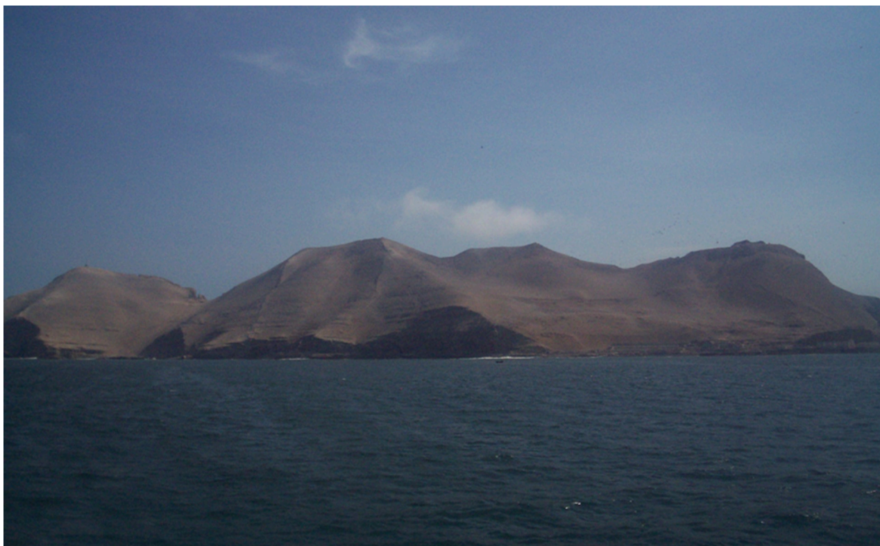
Fig. 2. Isla San Lorenzo fotografiada desde un yate.

En el Manuscrito de Huarochirí (Taylor 1987) esta isla es Kawillaka, una waka mujer que se convierte en la isla junto a su hijo, escapando del oprobio de haberse vinculado a un mendigo que, en realidad era un waka poderoso llamado Kuniraya Wiraqocha.