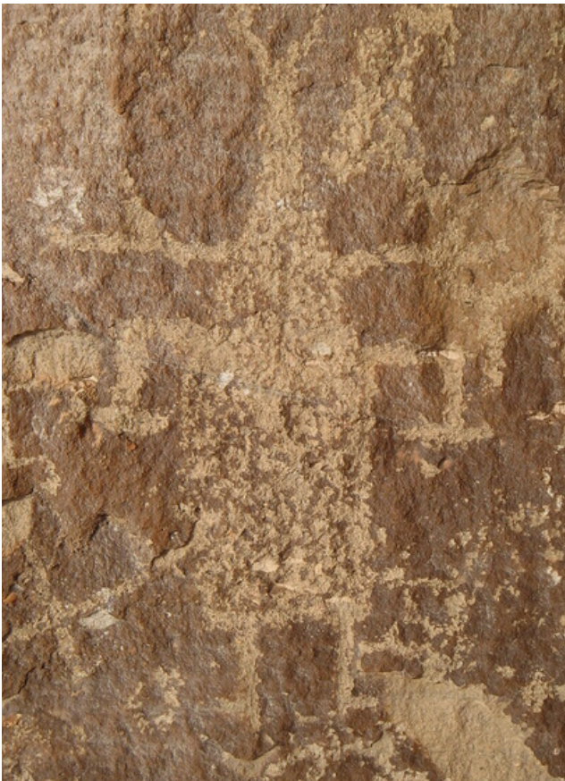
Fig. 14. Representación de personaje antropomorfo.

Es importante precisar, que en el panel se puedan identificar pocos personajes antropomorfos, registramos solo uno claramente visible, el personaje parece representar un danzante o chaman que aparentemente esté vestido con una camisa ancha tiene los brazos extendidos y flexionados hacia abajo, en la parte de la cabeza la representación ha sufrido algunos daños, sin embargo, pueden verse algunas líneas horizontales que salen de la altura del cuello y la cabeza termina en un círculo delineado (Fig. 14).