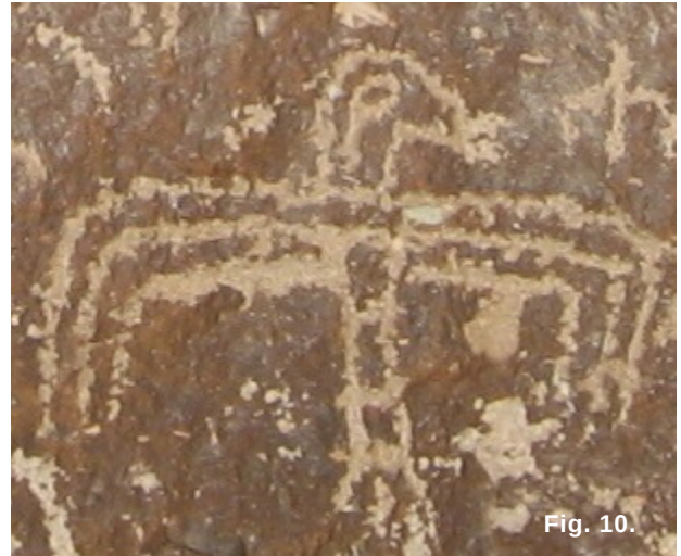
Fig. 9. Representación de un ave con el cuerpo de frente y la cabeza de perfil aparentemente caminando (Imagen izquierda), Fig. 10. Representación de un ave con el cuerpo de frente y la cabeza de perfil con las alas extendidas y dobladas hacia abajo (Imagen derecha).