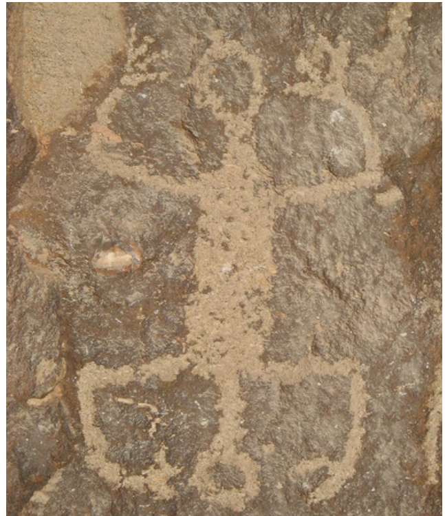
Fig. 15. Representación de personaje mítico o sobrenatural

En el lado norte del panel, rodeado de una serie de figuras geométricas y representaciones de fauna, resalta la figura de un personaje mítico o sobrenatural, el cual posee el cuerpo de frente con relleno, brazos extendidos y flexionados con los dedos abiertos, la cabeza está representada por un círculo delineado la parte baja del cuerpo es una representación idéntica de la parte superior, con un torso y cabeza delineada hacia la parte baja y lo que parecen ser dos brazos en la misma posición abierta y flexionada, aunque ligeramente distinto en la terminación de las manos que al parecer forman dos tenazas (Fig. 15).