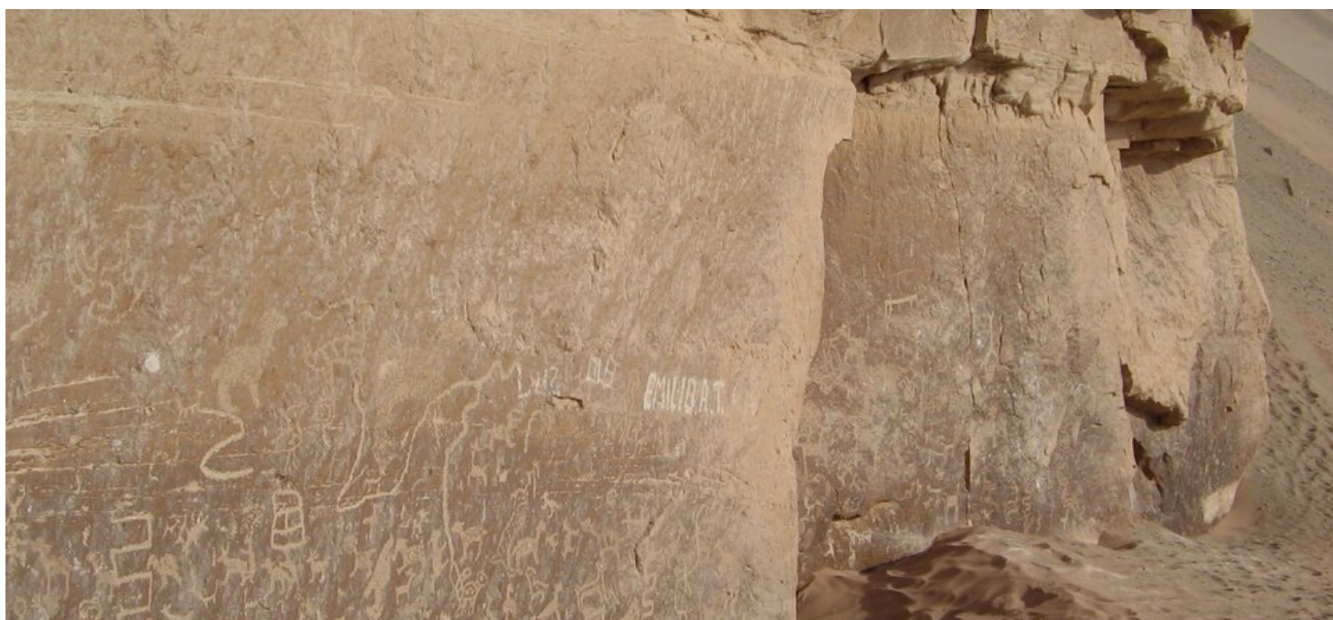
Fig. 21 Panorámica de panel con petroglifos.

Estas formaciones naturales que forman farallones en la cumbre del cerro y que se distingue de la configuración del entorno debió llamar la atención de viajeros y pobladores locales como un lugar con un significado muy especial, a pesar de las dificultades para acceder al sitio se aprovechó este espacio para representar gran parte de la fauna representativa, no solo de la región, sino también de otros lugares que están conectándose a través del valle.