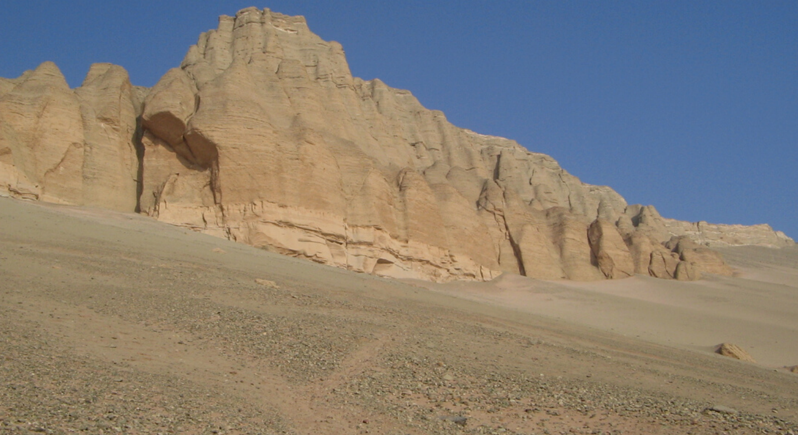
Fig. 4. Vista general del terreno caracterizado por un plano inclinado de superficie agreste y arenosa