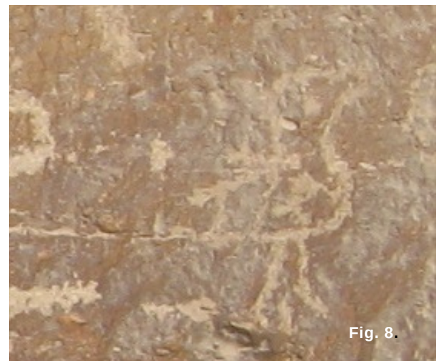
Fig. 7. Representación de un ave con decoración interna de cuadros en las alas Fig. 8. Representación de un ave con decoración de puntos y cuadros en alas.