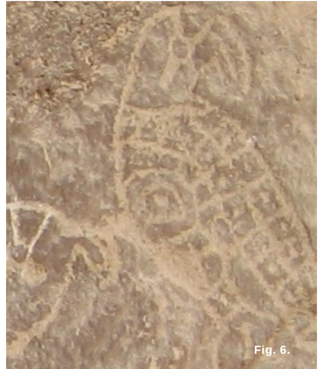
Fig. 5. Representación de un ave con decoración interna de cuadros en las alas Fig. 6. Representación de un ave con decoración de puntos y cuadros en alas.