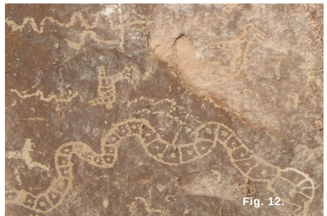
Fig. 12. (derecha), Representación de serpientes con decoración interior de líneas y puntos.