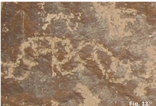
Fig. 13 Representación de serpiente al parecer imitando el diseño de la figura 12