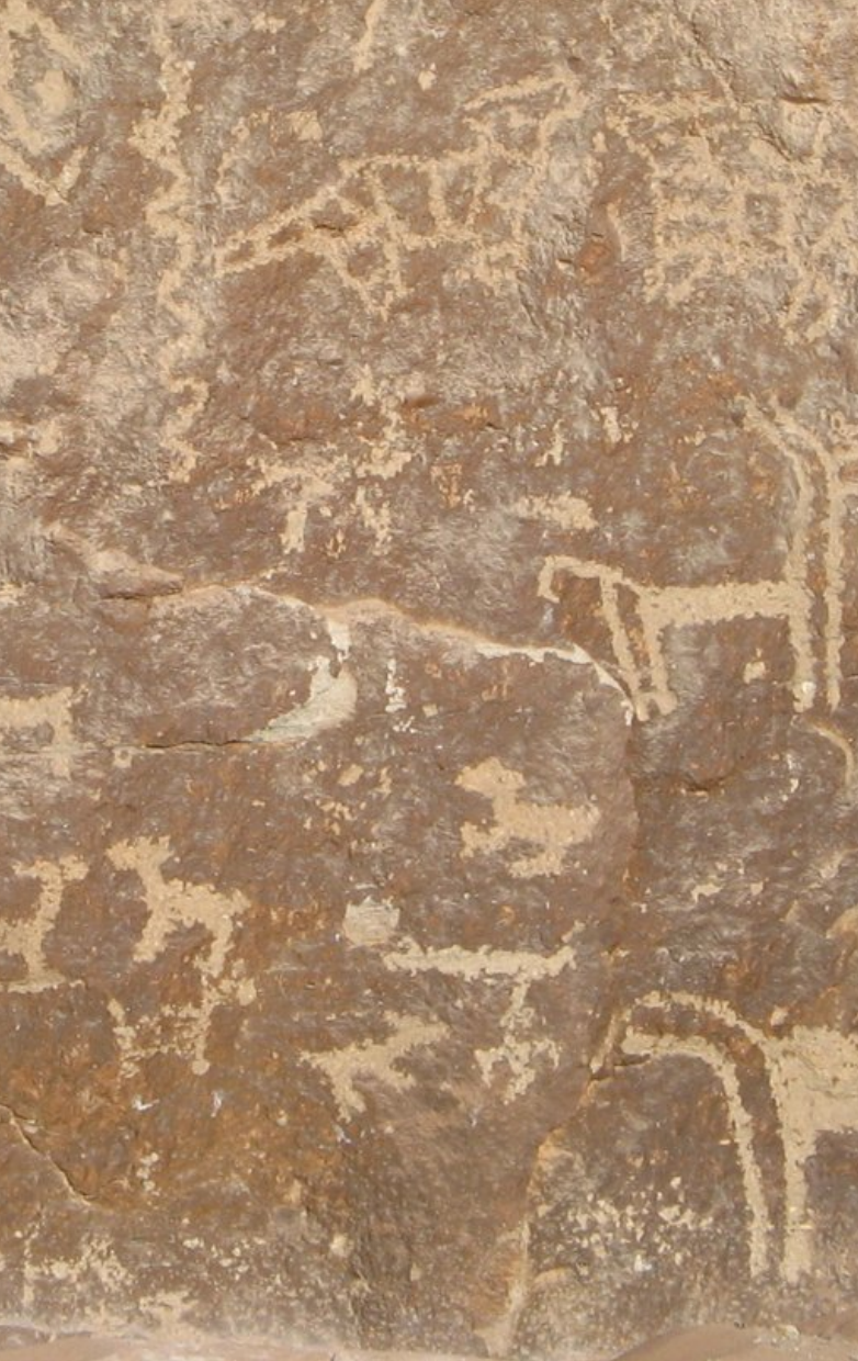
Fig. 22 Detalle de la Patina y soporte de los petroglifos.

Debemos tomar en cuenta, que la poca presencia de personajes antropomorfos que se relacionen a las actividades representadas en el panel, podrían interpretarse como una intencionalidad de mostrar a los viajeros y pobladores, que transitaron por estos lugares, una rica fauna y algunas posibles rutas o mapas, debido a la diversidad de recursos que no solo posee el valle, sino que se están importando de otros lugares, destacan también el significado y el simbolismo de animales muy venerados en el mundo andino como las aves, los felinos y las serpientes representados en La Laja.