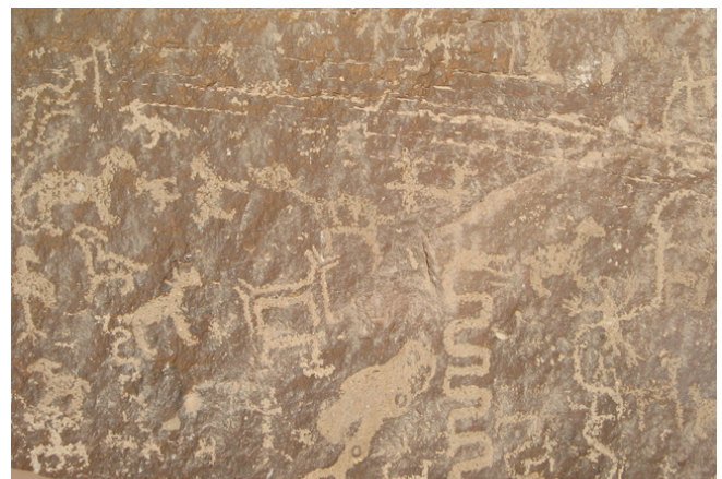
Fig. 16. Variedad de Cuadrúpedos

Existe un grupo de cuadrúpedos "posiblemente canidos" de trazo tosco, el cuerpo generalmente esta relleno, siempre están representados de perfil, con el hocico alargado, algunos con las orejas levantadas y otros con las orejas echadas hacia atrás que dan la sensación de que están en constante movimiento (Fig. 16).