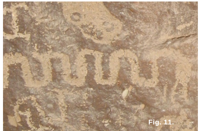
Fig. 11. Representación de serpiente con relleno.

La serpiente también está representada en varias secciones de La Laja. La más común de las serpientes ha sido trazada de forma esquematizada, como simples líneas ondulada, la cabeza con dos aspas en forma de flecha. Otro grupo de serpientes está representado por figuras más desarrolladas, con cuerpos rellenos en franjas onduladas de dos a tres centímetros de ancho (Fig. 11). Las más representativas las conforman aquellas serpientes de extraordinaria belleza, con el cuerpo delineado por dos líneas paralelas y adornado en el interior por líneas perpendiculares que forma cuadrángulos en cuya parte interna se han representado círculos, presenta rasgos faciales muy bien representados incluyendo los ojos (Fig. 12).