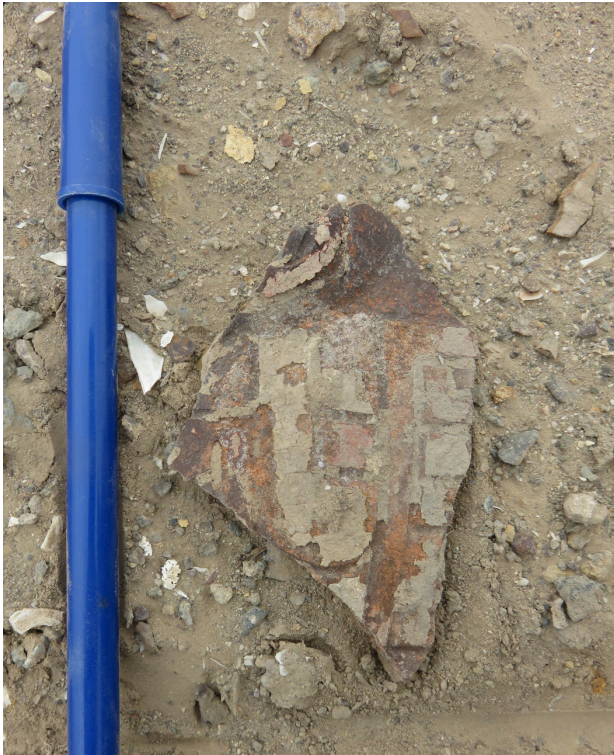
Fig. 5. Fragmento de cerámica, probablemente, del periodo Formativo, dentro del primer anillo. Nótase el terreno cubierto por fragmentos malacológicos. .