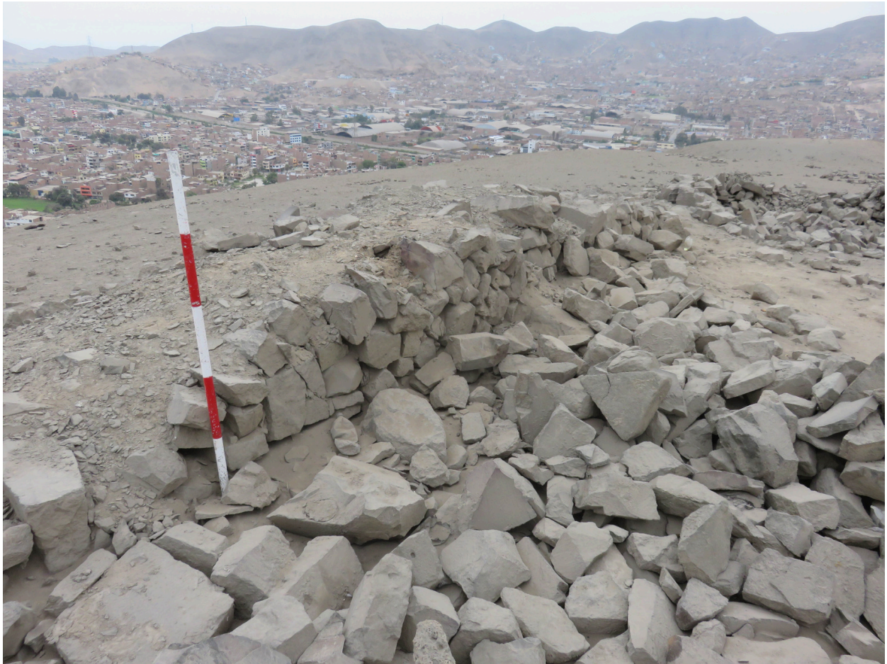
Fig. 3. Paramento interno del primer anillo. Vista de sureste a noroeste.