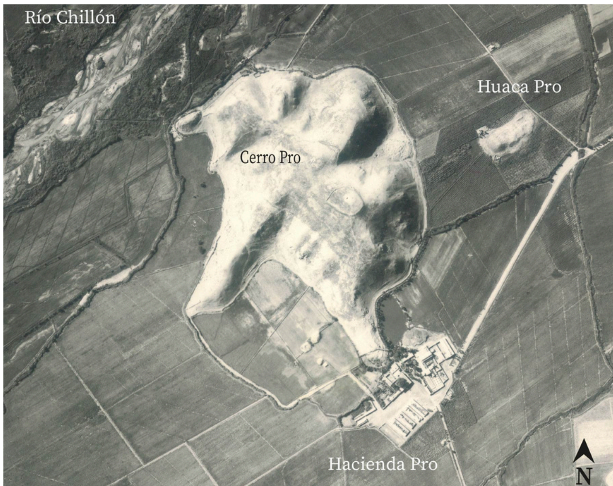
Fig. 2. Aerofotografía de Cerro Pro del 09 de abril de 1945 (Divra) y su entorno inmediato.