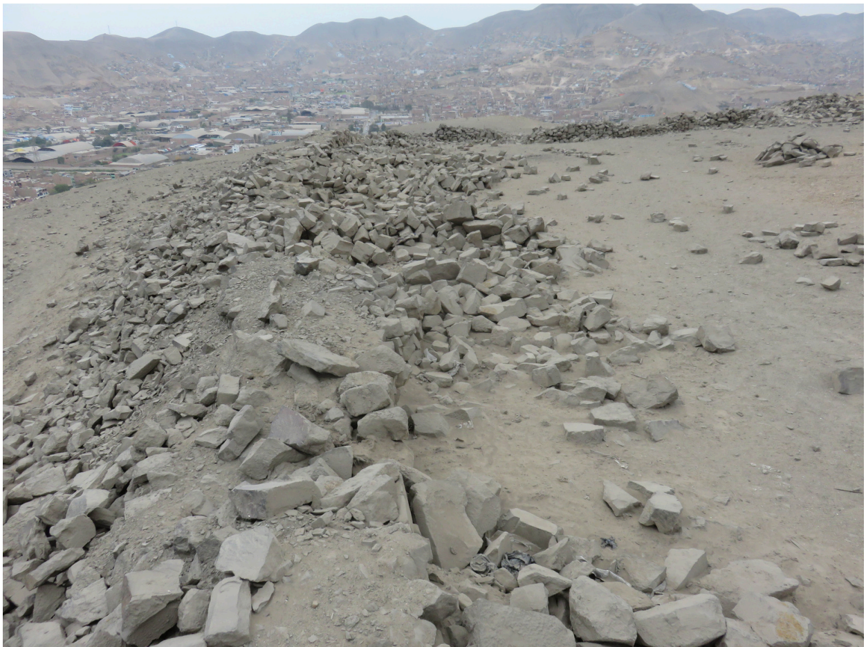
Fig. 4. Toma general del primer anillo con los recintos adosados en el lado suroeste. Vista de sureste a noroeste.