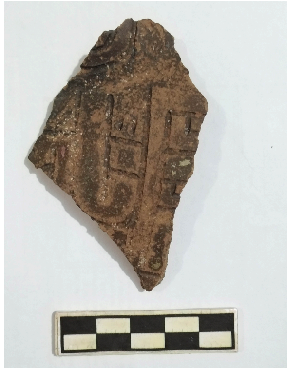
Fig. 6. Fragmento de cerámica de la figura 05, luego de haber sido limpiado in situ.

En el lado este, algunas piedras transversales probablemente conformaron otro acceso. Precisamente, la continuación hacia el este ha sufrido mayor afectación, pues la presencia del anillo es mínima. Este lado habría sido la ruta moderna de pastores para el traslado de animales, y de pobladores que ascienden para trasladar y conmemorar una cruz de madera ubicada sobre una base de piedras amontonadas.