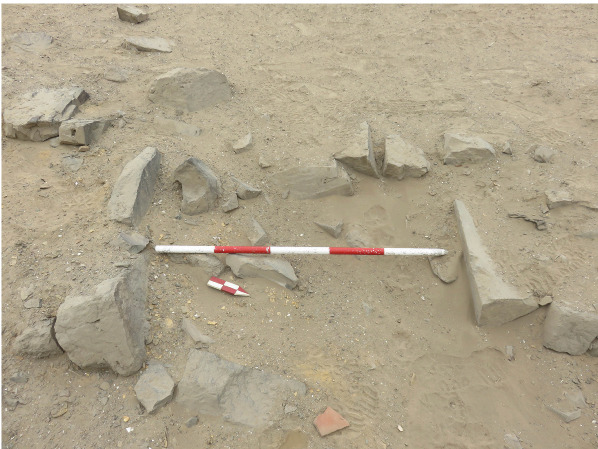
Fig. 7. Vano de acceso al norte del primer anillo. Vista de noreste a suroeste.

En el lado este, algunas piedras transversales probablemente conformaron otro acceso. Precisamente, la continuación hacia el este ha sufrido mayor afectación, pues la presencia del anillo es mínima. Este lado habría sido la ruta moderna de pastores para el traslado de animales, y de pobladores que ascienden para trasladar y conmemorar una cruz de madera ubicada sobre una base de piedras amontonadas.