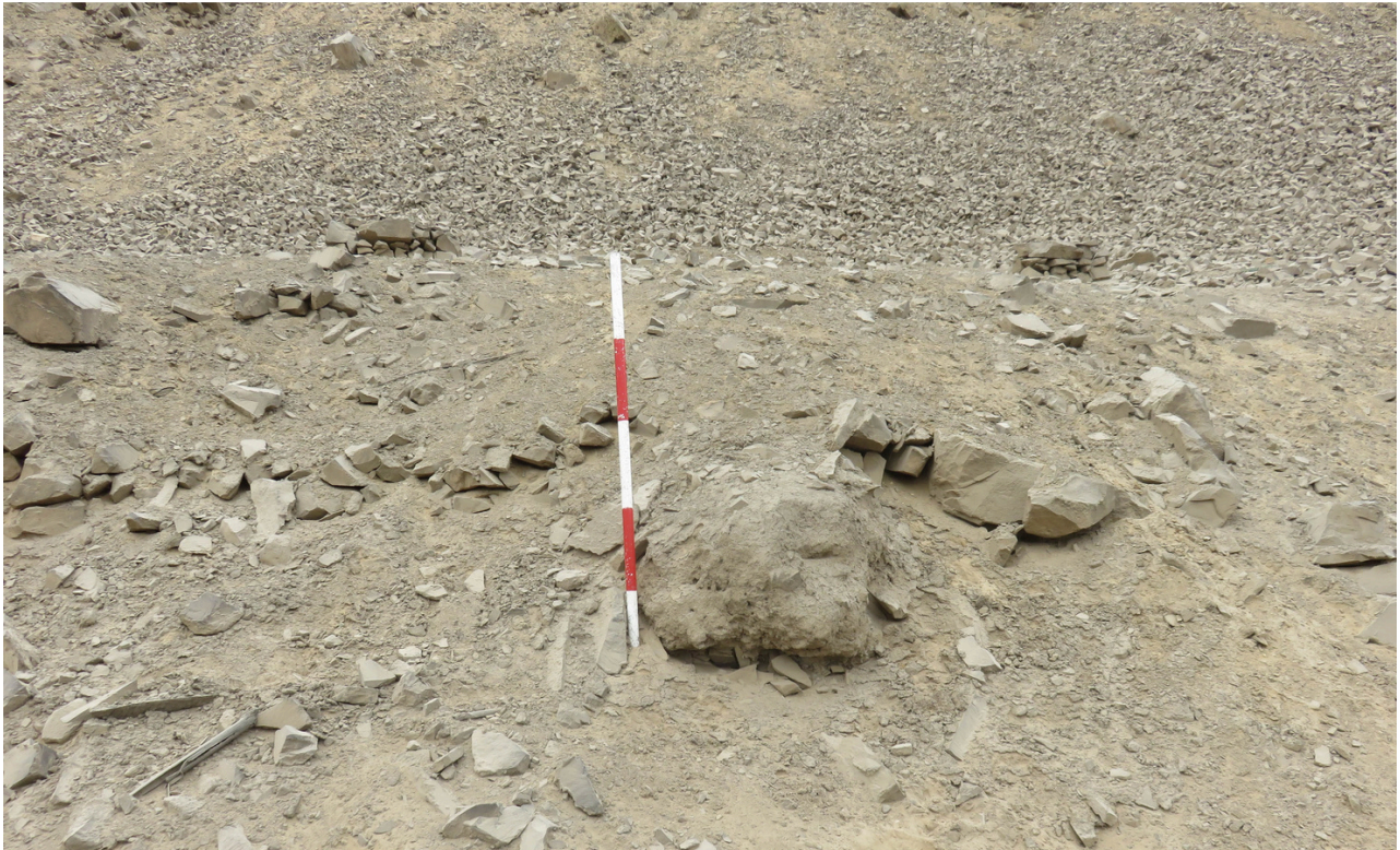
Fig. 12. Bloque de tapia con eje transversal en el lado noroeste inferior de Cerro Pro. Vista de noroeste a sureste.

No se ha realizado una investigación contextual que corrobore la atribución de Agurto (1984) de los anillos del Sector I al periodo Intermedio Temprano. Sin embargo, si comparamos la arquitectura de piedra de Cerro Pro con la arquitectura tardía de la Fortaleza de Collique o la comparamos con las elevadas murallas de Cerro La Regla (ambos asentamientos con el empleo de la piedra), podríamos deducir la misma temporalidad temprana. La cerámica de estilo Lima también es un indicador importante en Cerro Pro. Fragmentos de cerámica de este estilo han sido identificados en contexto por Del Águila (1997), y fragmentos de cerámica del periodo Intermedio Temprano, además de plataformas y muros de piedra del periodo Horizonte Temprano, han sido registrados por Bonavia (1966). Añadimos, también, los fragmentos de cerámica de estilo Lima [4] identificados en las excavaciones realizadas en Huaca Pro (estructura piramidal que explicaremos a continuación), dentro de los rellenos constructivos del periodo Horizonte Tardío (Raymond y Barr, 2021).