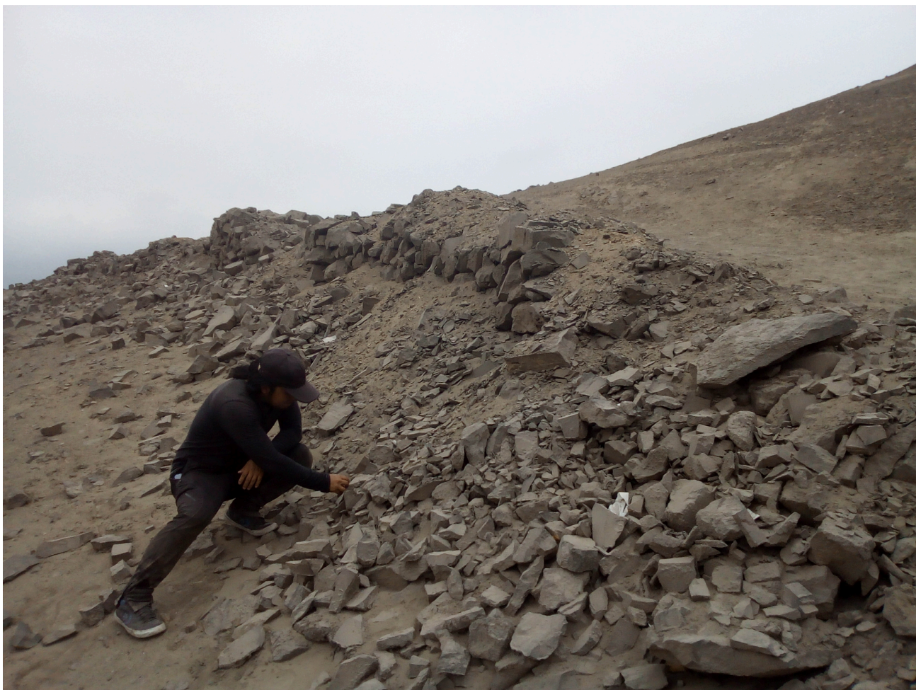
Fig. 8. Toma general del segundo anillo. Vista de oeste a este.

Hacia el norte, el cerro se extiende de manera alargada y descendente con un relieve ondulado. A 123 m del primer anillo se conserva un tramo del segundo anillo que también habría circundado el cerro. Este muro está compuesto por piedras canteadas unidas por argamasa, formando un paramento careado, con una proyección de noroeste a sureste. El tramo mide 128 m aproximadamente, sumando la silueta que representaría la proyección del muro. En las aerofotografías, en los antecedentes y en las tomas satelitales, se constata su probable forma perimetral, el cual transcurriría por debajo del primer anillo. Igualmente, el mal estado de conservación solo permite observar una cabecera ancha, abultada y alargada, que no excedería el 1 m de altura (Figura 8).