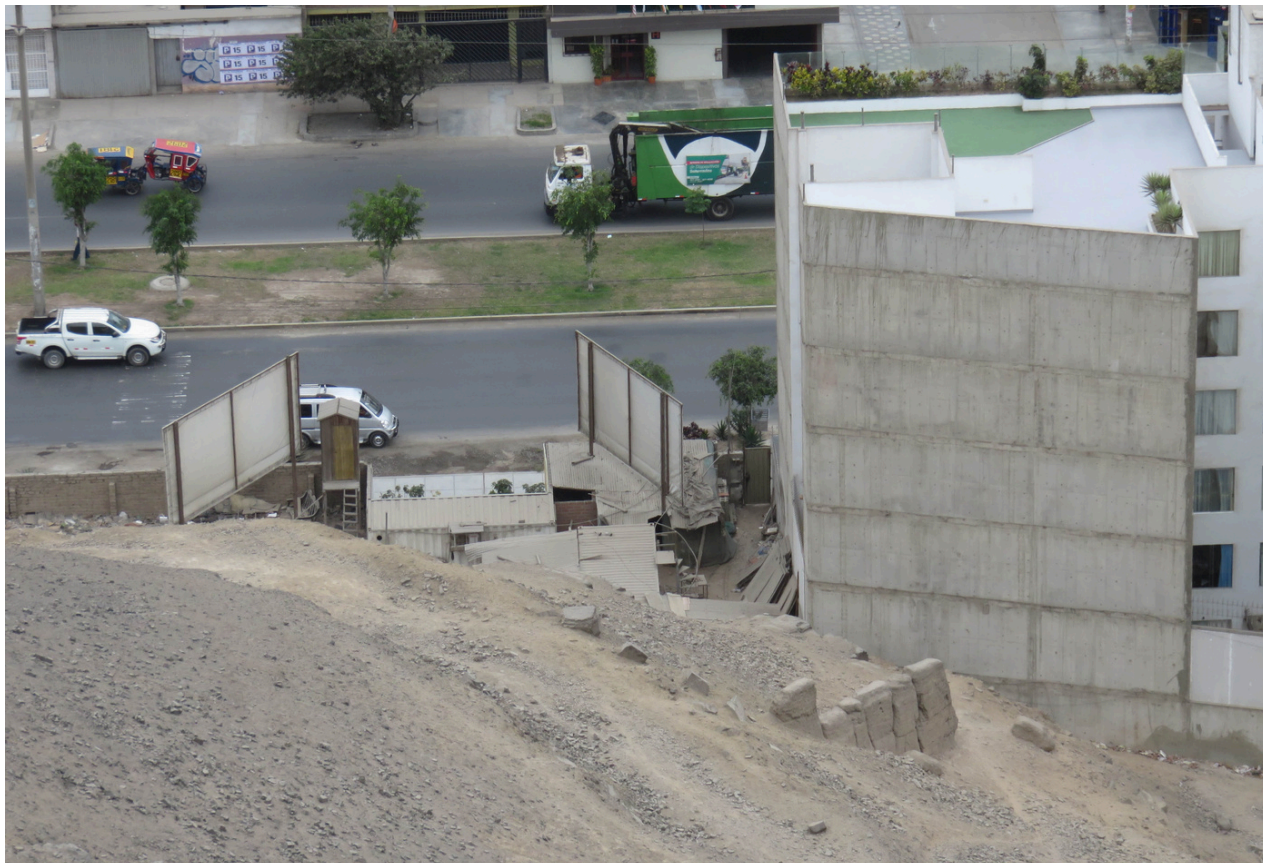
Fig. 11. Toma panorámica del muro trapezoidal, oculto por la construcción de edificios modernos. Vista de oeste a este.

Según los perfiles del lado este, ocasionados por la construcción del parque, los tapias fueron superpuestas en adobes cúbicos, permitieron rellenos para el levantamiento de plataformas y habrían correspondido a periodos tempranos (cf. Paredes, 2000). Vale agregar que, el ingreso hacia el parque es restringido, cuando se accede no se permite el ingreso libre hasta los perfiles y, al mismo tiempo, la vegetación impide la observación plena de la estratigrafía. Actualmente, dentro del parque existe un campo deportivo de fútbol que opera en alquiler.