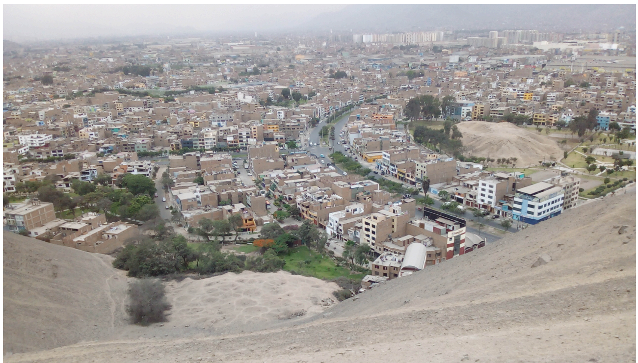
Fig. 10. Toma panorámica del Sector II desde la cima de Cerro Pro. Derecha superior: Huaca Pro. Izquierda inferior: Sector II. Vista de suroeste a noreste.

En el lado oeste del cono, cerca de la pendiente, la tierra adquiere una coloración negruzca que, según algunas capas de huaqueo, sería por actividades de quemazco. En este espacio las capas de excremento de animal ovino y caprino son notorias y presentan 1.20 m de altura aproximadamente. Se trataría entonces de corrales modernos con largos tiempos de ocupación. Cabe recordar que, su aspecto disturbado, con grandes círculos de huaqueo, se remonta hasta aproximadamente un siglo según las aerofotografías de la década del 1940 (Figura 10).