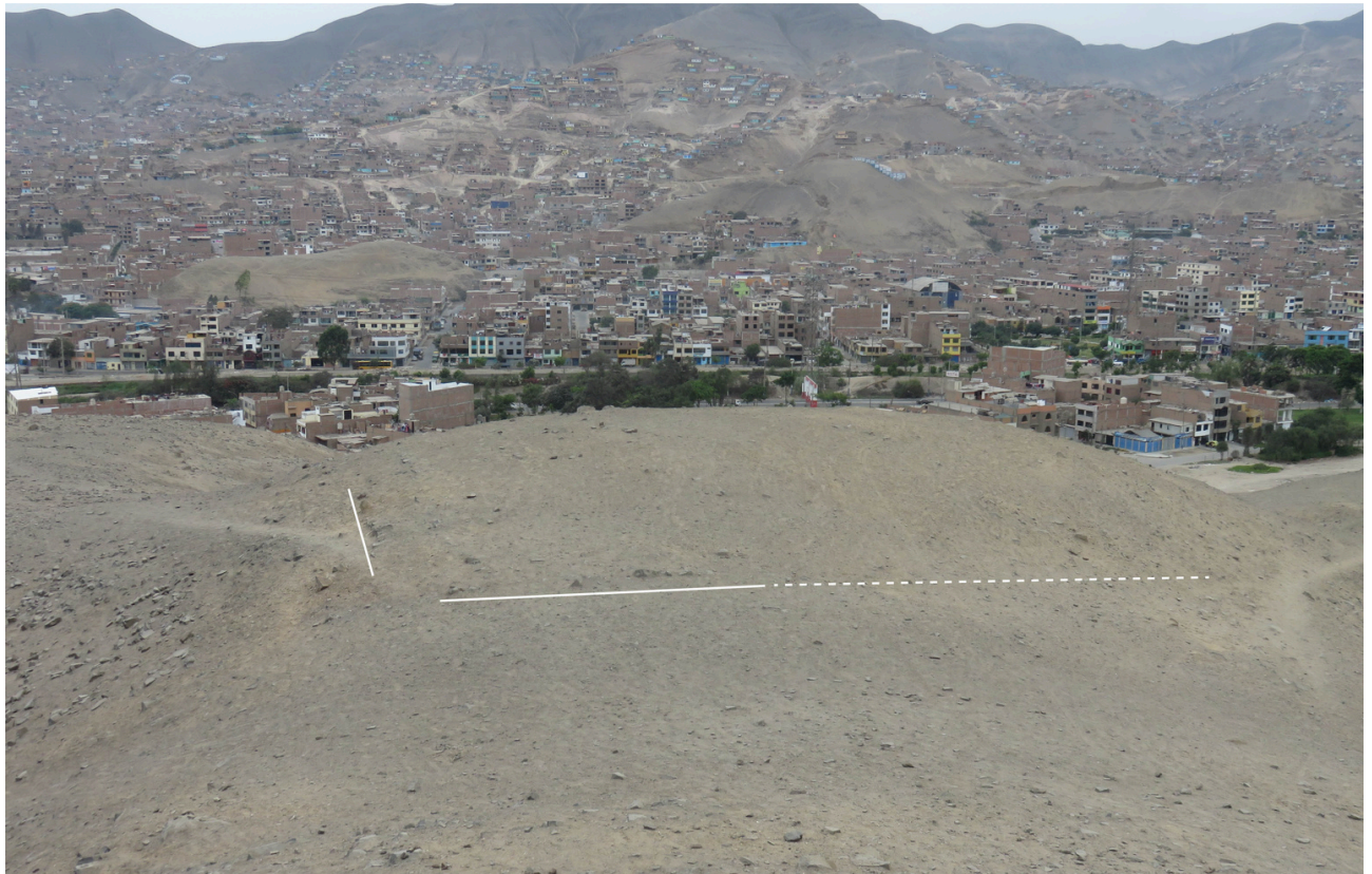
Fig. 9. Toma general de un montículo identificado al noroeste del Sector I. Vista de sureste a noroeste. Línea blanca: delineado de las plataformas de piedra. Línea punteada blanca: proyección de las plataformas.

En el lado oeste del cono, cerca de la pendiente, la tierra adquiere una coloración negruzca que, según algunas capas de huaqueo, sería por actividades de quemazco. En este espacio las capas de excremento de animal ovino y caprino son notorias y presentan 1.20 m de altura aproximadamente. Se trataría entonces de corrales modernos con largos tiempos de ocupación. Cabe recordar que, su aspecto disturbado, con grandes círculos de huaqueo, se remonta hasta aproximadamente un siglo según las aerofotografías de la década del 1940 (Figura 10).