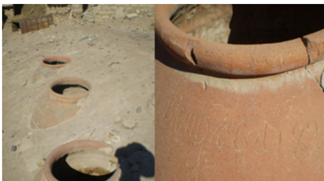
Fig. 7. Foto donde se pueden observar las chombas o vasijas de barro rojo de lo explorado se ha podido registrar la fecha más antigua de 1774 ( 2 años antes del estallido de la Independencia de las 13 colonias) y la siguiente de 1821 ( son 2 chombas que están registradas con la fecha del año de la Independencia del Perú, que el año pasado se celebró el Bicentenario de la Independencia nacional que se encuentran enterradas en la casa hacienda de Huaracane que sirvieron para producir y fermentar los deliciosas bebidas espirituosas de Moquegua para ser ofrecidas y , colocadas y vendidas en los mercados del Alto Perú para poder trasladar las mercancías, en los odres en la Colonia del Siglo XVIII.

Se pueden observar bodegas, fundo, casa hacienda, lagares, hornos, chombas y patios de estancia en cuyos bordes se localizaron fragmentos de vasijas coloniales fechadas, correspondientes mayoritariamente por sus características a botijas de barro rojo de cuello ancho. También, se pudo constatar una serie estructuras de construcciones coloniales constituidos por piedras acumuladas a base de cantos rodados, cercano a la casa hacienda en donde se pueden observar muchos restos esparcidos de madera y caña que están cayendo de los techos de mojinete que es una estructura única de la colonia identificada especialmente en este sector de la zona sur de Moquegua.