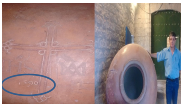
Fig. 10 Foto donde se identifica a una de las chombas o tinajas más antiguas de Moquegua fechada del año 1590 y con el icono de la cruz como símbolo que pertenece a la propiedad de la Iglesia Católica en tiempos de la Colonia, se ubica y se encuentra en la puerta del ingreso principal de la Oficina del Ministerio de Cultural DDC de Moquegua.

los cuales no solo conducían a los espacios de producción en donde se puede apreciar grandes reservas de hollejo de la vid procesada en el pasado para la obtención de vinos y aguardientes sino también a las estancias por los fecales de acémilas hallados., que seguramente fue el punto de encuentro de arrieros y comerciantes de este magnífico rubro vitivinícola cuyos productos cautivaron y mantuvieron activas a estas bodegas que abastecieron los mercados del Alto Perú y de la Audiencia de Charcas. Esperemos con mucho sentimiento esperanzador que las instituciones comprometidas puedan responder lo más pronto posible para rescatar definitivamente este valioso espacio arqueológico para aprendizaje de todos de las actividades coloniales realizadas sino también a las estancias por los fecales de acémilas hallados., en el pasado a redes de intercambios cuyas actividades inmersas aún forman parte de los resultados de futuros trabajos de investigación que se realicen en estos sectores y áreas de trabajo arqueológico para el conocimiento y el aprendizaje de los comportamientos de los pueblos, personajes y protagonistas del pasado local y regional.