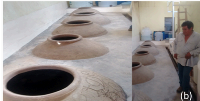
Fig. 5. Vista de la Casa hacienda, bodega y estancia recuperada y bien conservada por el dueño y administrador familiar el Sr. Don Camilo Valdivia del Alto de la Villa. (a) producción de vinos y aguardientes en la Bodega colonial de Don Camilo. (b) Bodega y chombas de barro blanco con inscripciones y fechados coloniales.