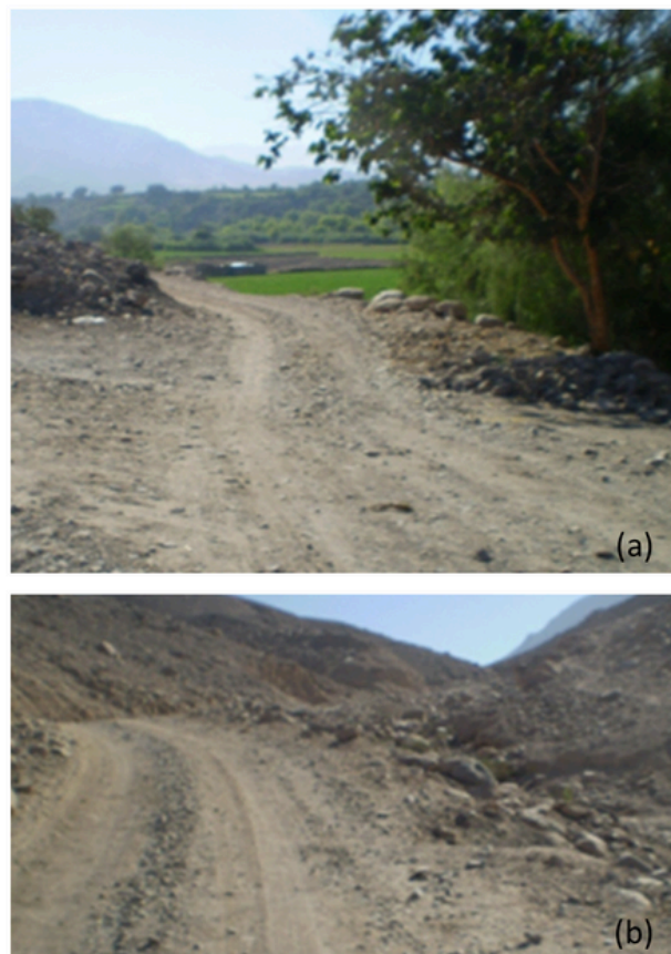
Fig. 2. Foto a detalle de los caminos y rutas de arrieros coloniales hacia Omate y el Alto Perú. (a) Antigua ruta de Arrieros Hacia: Omate – Arequipa - Alto Perú. (b) Antigua ruta al valle de Estuquiña – Altiplano – Alto Perú.

Cabe resaltar, que los transeúntes coloniales permitieron activar y dinamizar estos viejos y ancestrales caminos que contribuyeron activamente con la producción, el comercio y los negocios del sur del Bajo Perú con los nuevos mercados del Alto Perú. Las rutas del arrieraje de la propia ciudad en 1593[4] tuvo por finalidad, la consolidación de las rutas que permitían la comunicación y el comercio entre toda la gobernación y las zonas mineras del Alto Perú[5]. A partir de ello, el desarrollo del transporte fue de gran importancia. La misma descansaba en una razón geográfica, ya que Jujuy era la última ciudad del camino carretero entre el río de la Plata, el Tucumán y Potosí, hasta allí llegaban las carretas cargadas con mercancías con destino a los mercados del Alto y Bajo Perú en adelante solo se podía continuar el viaje en mula[6] y las mercancías debían enfardarse para ubicarlas en tercios de mula o burro.