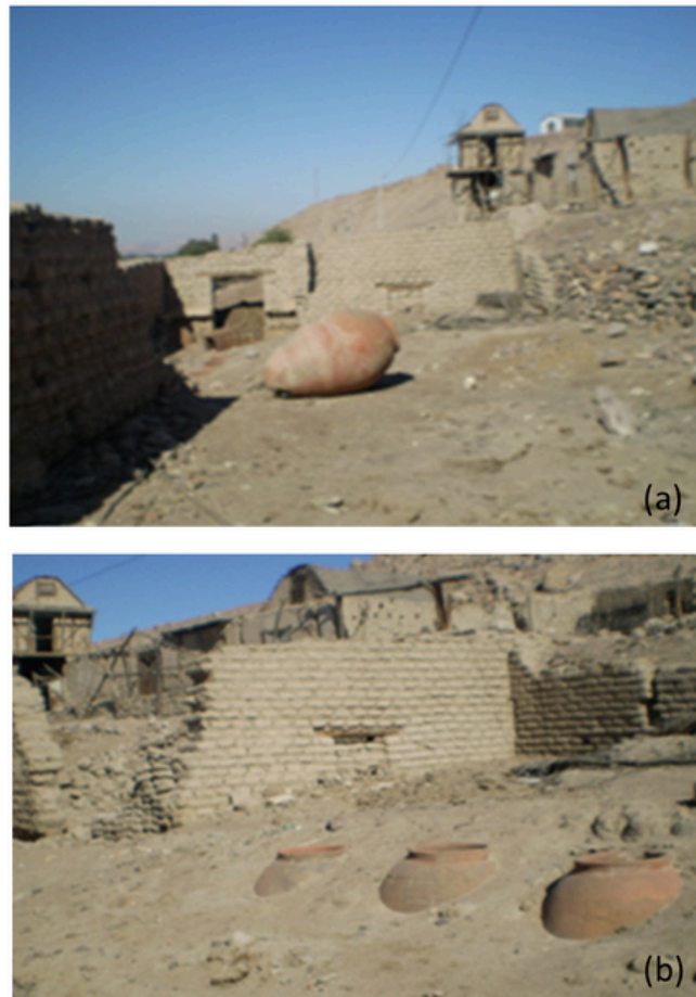
Fig. 4. Foto del espacio de producción de vinos y aguardientes en la Bodega colonial de Huaracane, con dos pisos y coronado con techo de mojinete, reforzado con cerco de adobo y adobón. (a) Casa hacienda y estancia con techos de Mojinete. (b) Chombas de la colonia, alineadas en la bodega.