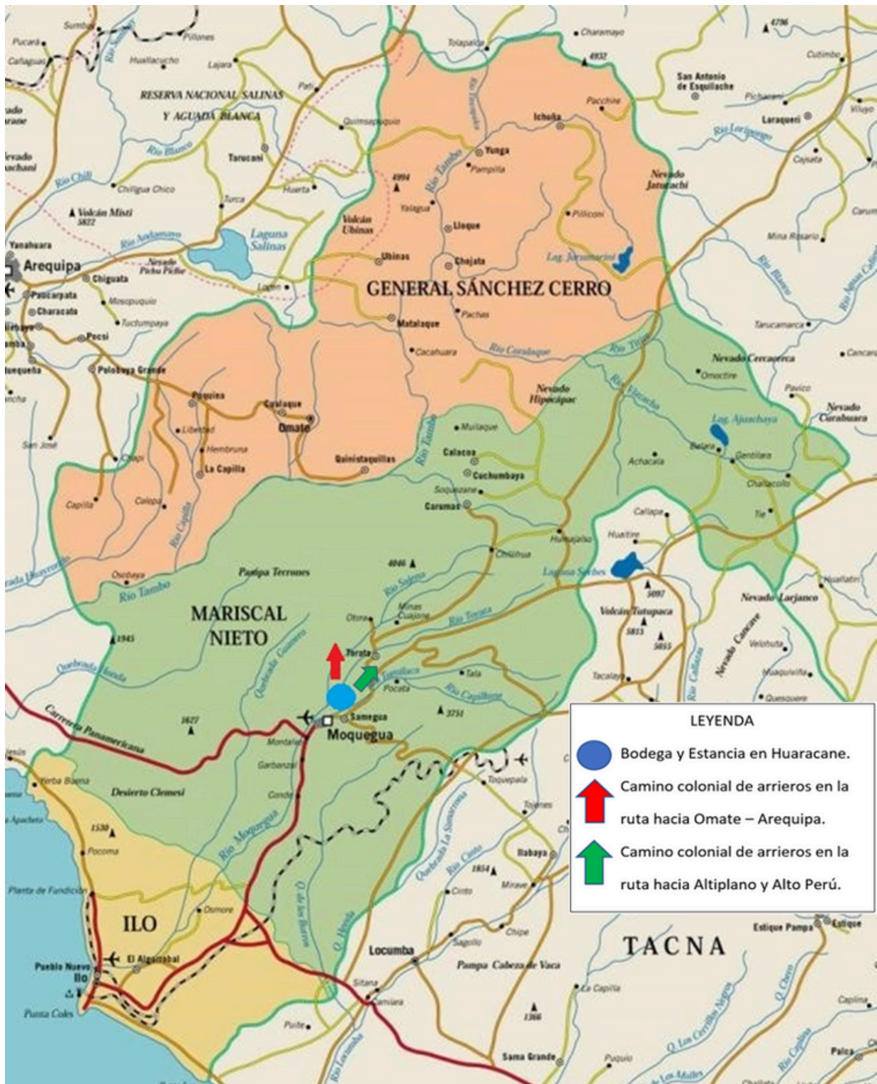
Fig. 1. Mapa de Moquegua donde se observa la ruta de los arrieros en la época colonial.