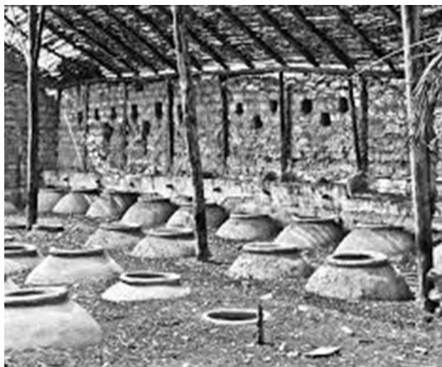
Fig. 9. Bodega colonial en el valle viejo de Moquegua, observar el procedimiento del entierro de chombas para acelerar el proceso de la fermentación del vino y los aguardientes como una practica continua colonial en el sur peruano, por la mayor cantidad de horas de luz solar y por la calidad del agua empleada para su elaboración.

los cuales no solo conducían a los espacios de producción en donde se puede apreciar grandes reservas de hollejo de la vid procesada en el pasado para la obtención de vinos y aguardientes sino también a las estancias por los fecales de acémilas hallados., que seguramente fue el punto de encuentro de arrieros y comerciantes de este magnífico rubro vitivinícola cuyos productos cautivaron y mantuvieron activas a estas bodegas que abastecieron los mercados del Alto Perú y de la Audiencia de Charcas. Esperemos con mucho sentimiento esperanzador que las instituciones comprometidas puedan responder lo más pronto posible para rescatar definitivamente este valioso espacio arqueológico para aprendizaje de todos de las actividades coloniales realizadas sino también a las estancias por los fecales de acémilas hallados., en el pasado a redes de intercambios cuyas actividades inmersas aún forman parte de los resultados de futuros trabajos de investigación que se realicen en estos sectores y áreas de trabajo arqueológico para el conocimiento y el aprendizaje de los comportamientos de los pueblos, personajes y protagonistas del pasado local y regional.