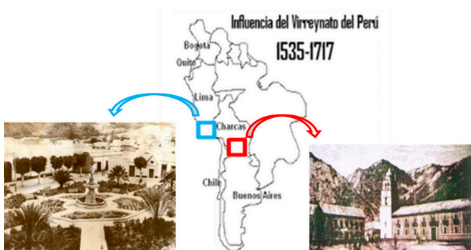
Fig. 11. Foto recreativa que visualiza e identifica las rutas seguidas por los arrieros y comerciantes del sur peruano, productores de aguardientes y vinos de alta calidad con amplia demanda en los mercados del Alto Perú lo que intensifico y activo el intercambio comercial entre las comarcas y pueblos del sur peruano con las minas de Potosí y las yungas de Cochabamba, la villa de Oruro hasta llegar a la Villa de la Plata en tiempos de la Colonia, ampliando le radio de comercialización que nos permite identificar la importancia del arrieraje y de los comerciantes de vinos y aguardientes de este tiempo.