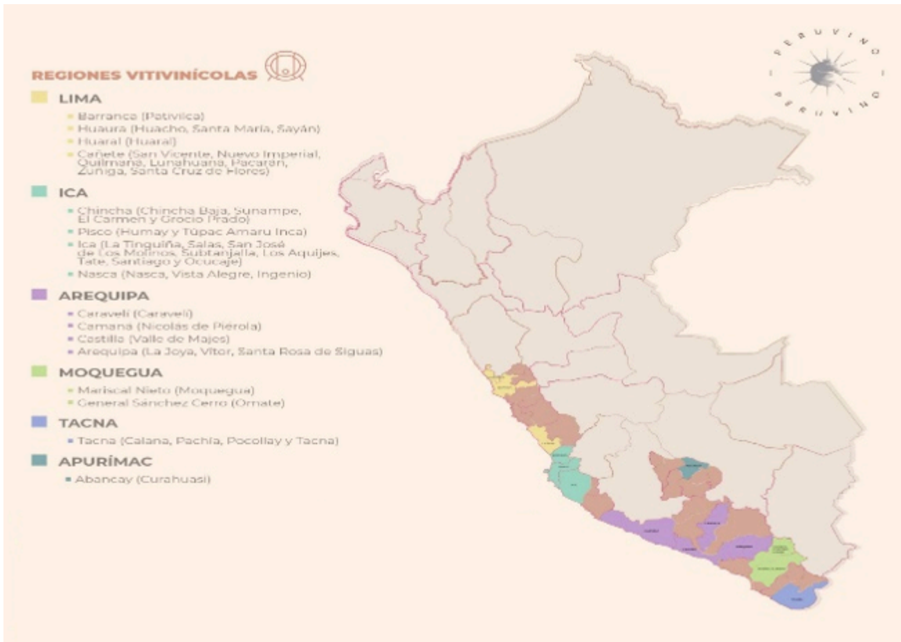
Fig. 12. Foto de afiche recreativo y diapositiva que visualiza e identifica las regiones vitivinícolas de la costa peruana, resaltando todas las regiones costeñas y Moquegua del sur peruano, productores de aguardientes y vinos de alta calidad de Moquegua y Omate.