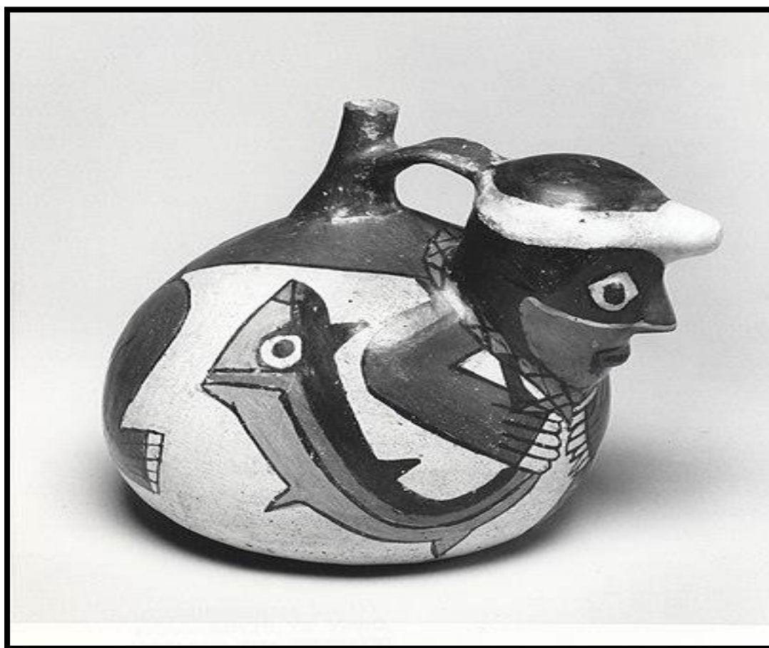
Figura 1: “Pescador Feliz”. Cultura Nazca.

La pesca marina fue una actividad fundamental en la extensa costa peruana. Así, se demuestra por los resultados de las investigaciones arqueológicas. La gran evidencia de esta práctica económica se aprecia desde la costa central hasta la costa norte, aunque todos los pueblos costeros de Moquegua, Arequipa y Tacna también debieron participar de esa experiencia económica. Más conocimientos se tienen desde la costa norte hasta Chincha. Además de la cerámica de las culturas Paracas, Nazca, Chancay, Moche, Lambayeque, Chimú, Tallán y Chincha donde se reconoce a los expertos pescadores y procesadores del rico alimento ictiológico cuya información ha sido rescatada por la arqueología y la etnohistoria (Rostworowski 1989:233-238) contando además con especialistas en otros oficios que nos dejaron la exquisita calidad de sus productos procesados con sal. Finalmente, se narra el encuentro de los balseros con la expedición de Francisco Pizarro en el segundo viaje al sur de Panamá.