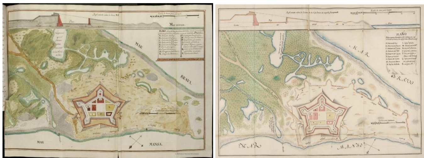
Figura 4: Relación del Conde de Superunda.