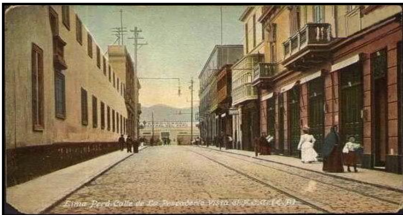
Figura 2: Calle Pescadería. Centro de Lima.

Es decir, cronológicamente pasando desde el mismo Lítico por el Arcaico y el Formativo hasta los incas. Los estudios en Caral, Bandurria, El Paraíso, muestran en abundancia la práctica con anzuelo, redes de pescar, balsas de totora o madera. En el periodo colonial, los grupos de pescadores mantuvieron sus privilegios o reclamaron los que gozaban en tiempos de los incas. Entonces, los pescadores y especialistas en el proceso de conservación se dedicaron durante el periodo colonial, en la continuidad de su experiencia pesquera. Solo recordar la existencia de la calle pescadería a espaldas del palacio de gobierno, y republicano nos indica la permanencia. Hoy, para el caso de la capital, los tenemos como asociación de pescadores artesanales en Chorrillos o en Ancón, por ejemplo. No debemos olvidar la pesca, incluso de camarones, en las márgenes de los ríos como el caso del río Rímac o de otros al sur de Lima.