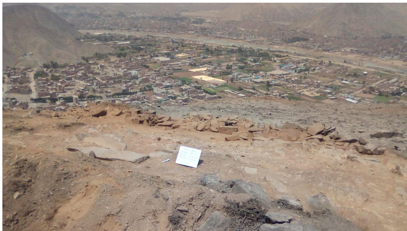
Figura 6: vista panorámica del valle de Carapongo visto desde la unidad 9.

Las hileras que conforman la terraza son irregulares, no uniformes. La capa S está conformada por un colchón de vegetación seca (achupalla), combinada con tierra de color gris, mezclada con grava en pocas proporciones, de naturaleza semicompacta y de 0.04 metros de grosor, no se encontró material cultural arqueológico mueble. La capa A es de color amarillenta con pequeñas gravillas (en menor proporción), con abundante inclusión de excremento de ganado caprino y algunas plantas de achupalla en la parte superior. Al finalizar la capa, a 0.38 metros de profundidad (el grosor de la capa es entre 0.05 metros y 0.38 metros, apareciendo solo en el área de la terraza, no existiendo en más de la mitad de la extensión de la unidad), se pudo ver la extensión de la terraza de 9 metros de largo con 0.50 metros de altura máxima, presentando en la parte superior de la terraza una pequeña estructura semisubterránea de 0.42 metros de diámetro, elaborada con piedras canteadas pequeñas y medianas sueltas. Se observó también un pequeño acceso a la parte superior de la terraza, a modo de vano, con su umbral de piedra alargada. Este vano tiene 0.52 metros de ancho y una altura conservada de 0.09 metros. No se encontró material cultural arqueológico mueble. La capa B está conformada por la roca madre aflorante de color amarillento, de naturaleza sólida, la cual aflora en el 75) de la unidad hacia la superficie.