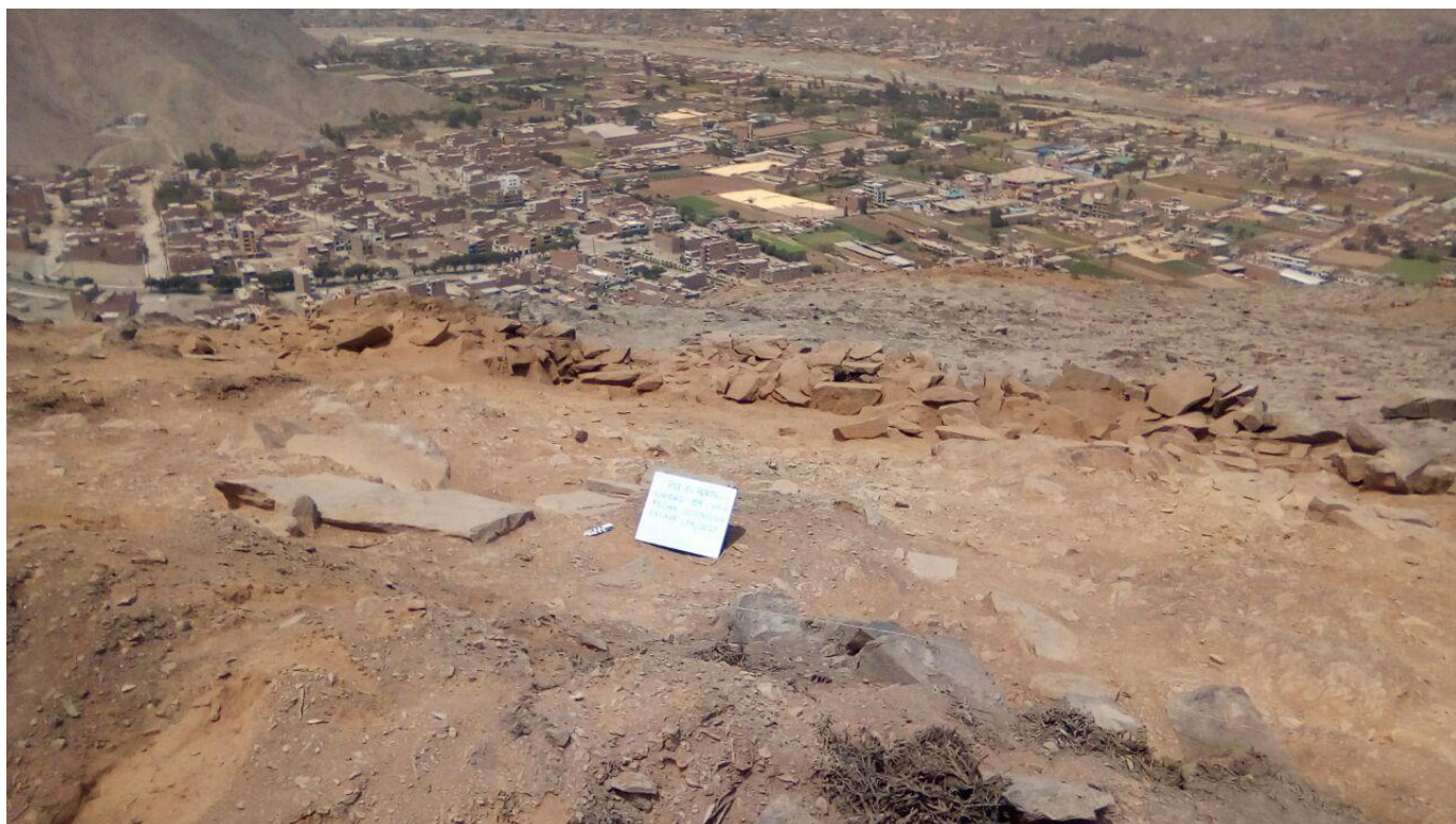
Figura 3: vista de la capa A, unidad 9.