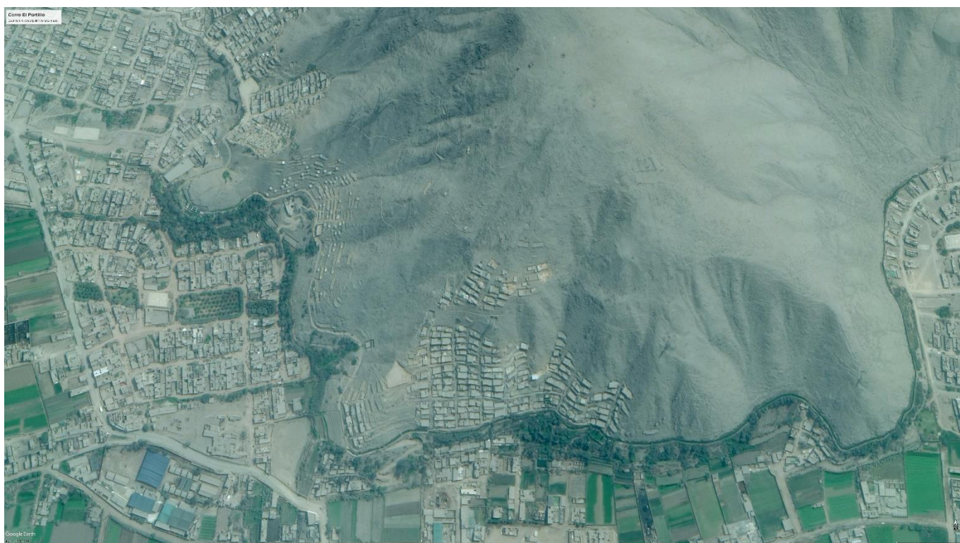
Figura 2: Vista en foto satelital de sitio arqueológico Cerro Portillo.

En la ladera superior del cerro se aprecia pequeños espacios planos o cimas intermedias en las cuales se aprecian estructuras; aunque gran parte de este sitio ha sido alterado por la población del Asentamiento Humano, quienes invadieron también esta zona, alterando gran parte de las evidencias. Este asentamiento se encuentra declarado Patrimonio Cultural de la Nación desde 1998 y es uno de los pocos sitios que se encuentra inscrito en Registros Públicos (SUNARP).