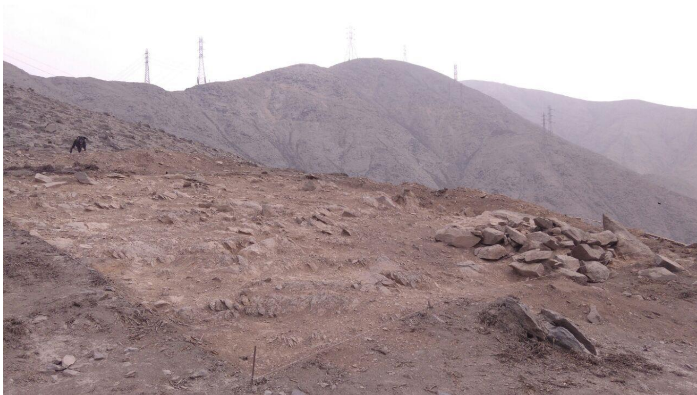
Figura 7: vista de la capa estéril, unidad 10. Vista de la estructura en el lado derecho.

canteadas de diferentes tamaños, elaborado por pircado simple (sin argamasa). Tiene un diámetro de 0.49 metros y 0.12 metros de profundidad. Al excavar la estructura se pudo observar la base que está hecha de piedra de diferentes tamaños que se condicionan en el terreno, no se observan que estén unidos con argamasa, sino como un pircado. Tiene 0.05 metros de grosor. No se encontró material cultural arqueológico mueble. Se observan algunas piedras sueltas de tamaño mediano y grande (de hasta 0.30 metros de largo). La capa A es tierra de color marrón claro amarillento combinado con gravas, de naturaleza compacta. Esta capa solo aparece en un 25% del área total de la unidad. Tiene 0.10 metros de grosor. Al culminar esta unidad se identificó el basamento de la estructura semisubterránea, la cual descansa sobre la roca madre. No se encontró material cultural mueble al interior, ni al exterior.