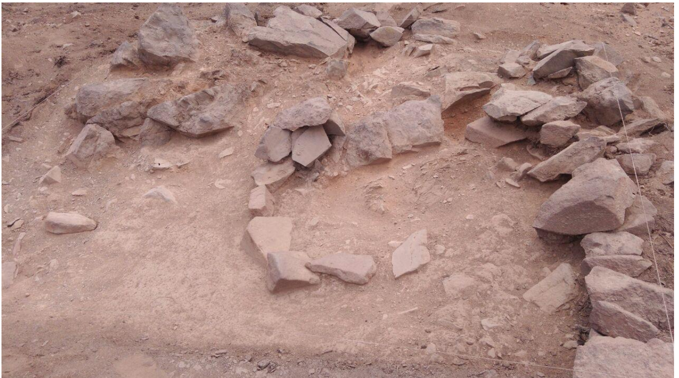
Figura 10: Otra vista del paraviento de la unidad 12.

UNIDAD 14: Esta unidad es una trinchera de 8 x 2 metros, ubicada en un espacio plano, junto a la cruz de madera (cruz de camino), en un área cubierta de vegetación seca (achupalla), en las coordenadas UTM: 8673162N, 297560E. En los alrededores de la unidad hay