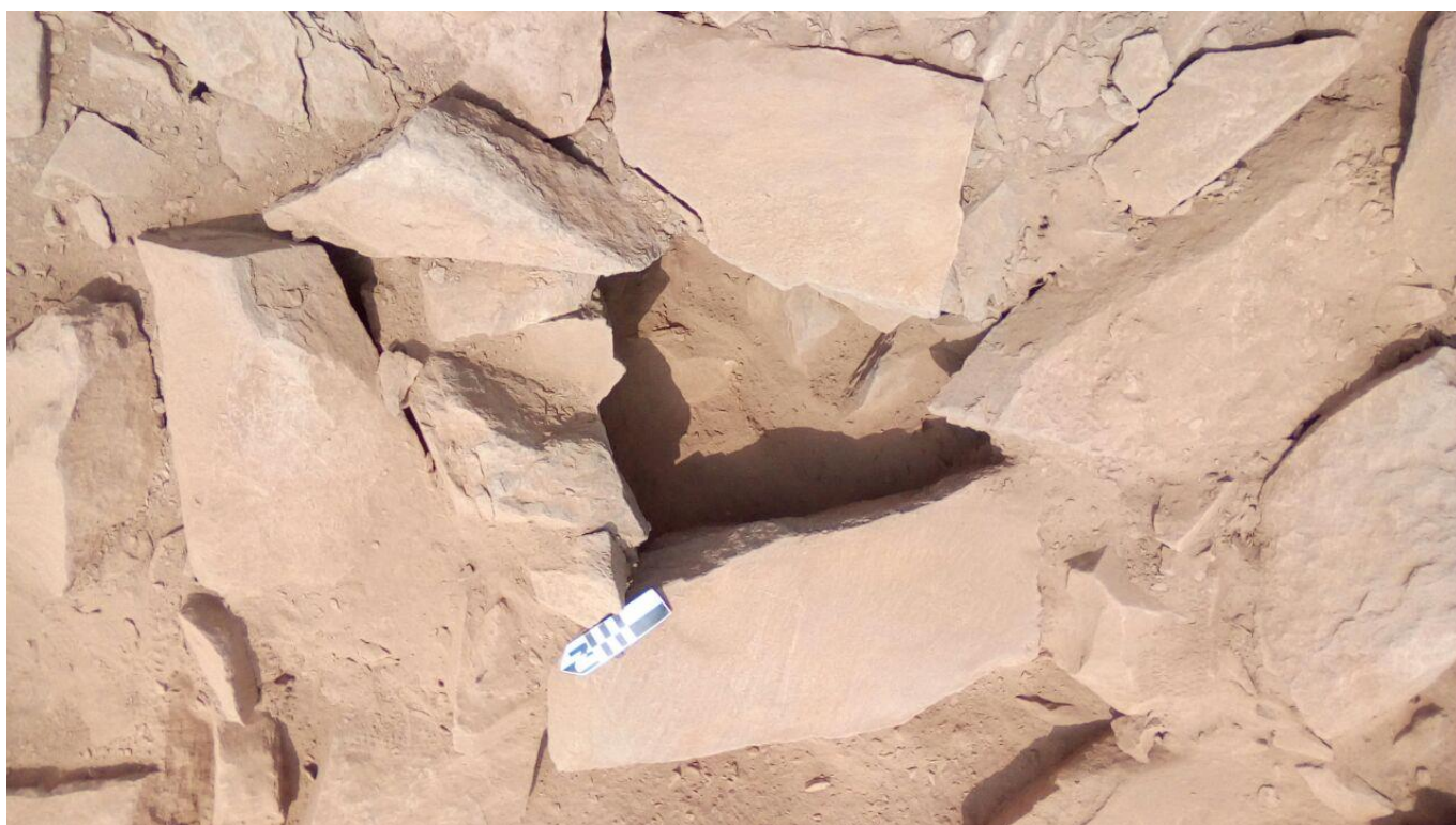
Figura 4: vista de la estructura semisubterránea en unidad 9.

piedras canteadas, sin argamasa intermedia. La capa S es de tierra color gris, entremezclada con pequeñas gravas. Es semicompacta, de naturaleza eólica, de 0.02 m de espesor; es una capa formada por la acumulación de pulvurescencia compactado por el agua de las lluvias, no