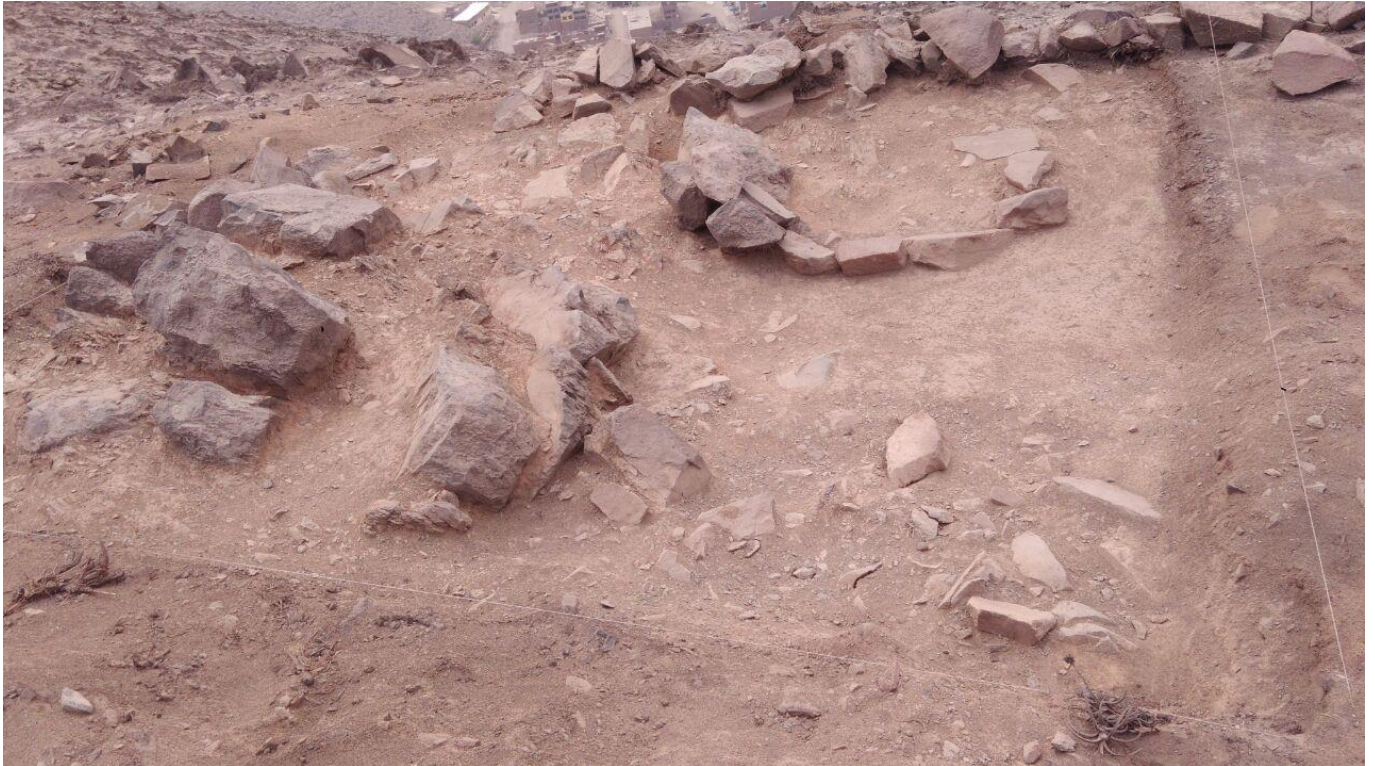
Figura 9: vista final de la unidad 12 y del paraviento.