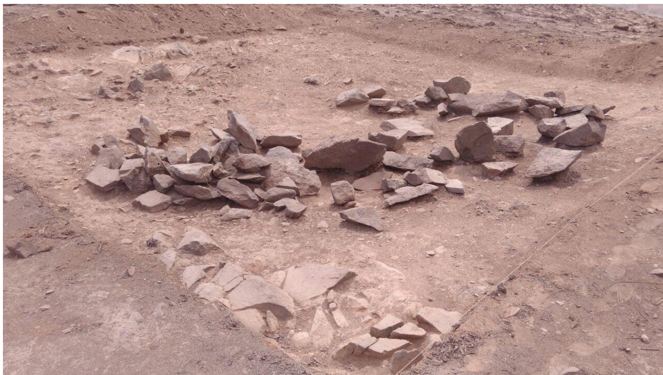
Figura 8: vista final de la excavación de la unidad 11, nótese la estructura circular elaborado en tiempos contemporáneos.

UNIDAD 12: Se emplazó en un área de poca pendiente, en las coordenadas UTM: 8673221N, 297547E, es una cuadrícula de 4 x 4 metros. La secuencia estratigráfica identificada en la excavación es la siguiente: La capa S es de color gris, de origen eólico, con presencia de inclusiones de gravillas y achupalla, tiene un espesor de 2 cm aproximadamente, de naturaleza suelta. La capa A es de tierra de color marrón claro amarillento, que está combinada con pequeñas gravas de relleno. La tierra no es compacta, no presenta problemas al excavar. Esta capa es compacta, con un grosor de 0.28 metros. Se identificó al interior de esta capa, una estructura de planta circular, ubicado al lado central de la unidad, la cual tiene 0.92 metros de diámetro y 0.52 metros de profundidad, intruyéndose en la roca madre (capa B). Al excavar al interior de esta estructura, edificada con piedras canteadas medianas, unidas con argamasa, se halló tierra de relleno color marrón amarillento entremezclada con piedras pequeñas; sin hallarse material cultural mueble alguno.