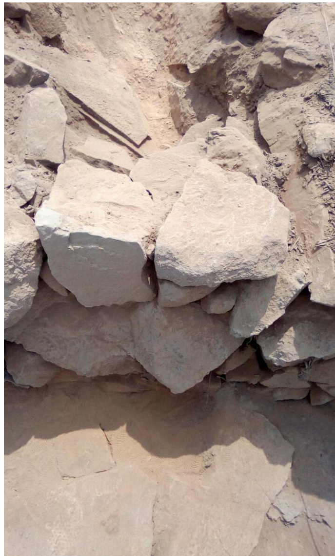
Figura 5: vista de la terraza de unidad 9.

UNIDAD 8: Esta es una trinchera de 8 x 3 metros, emplazado en una zona plana del cerro, en las coordenadas UTM: 8673299N, 297421E. No se encontró ninguna evidencia arqueológica.