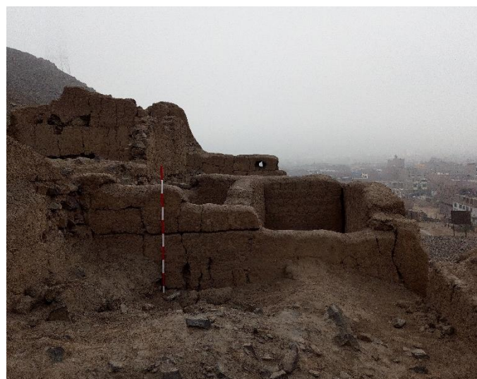
Figura 5 (izquierda): Vista de los muros de tapial del sitio arqueológico Gloria Chica. Vista de sur a norte. Figura 6 (derecha): Vista de la técnica constructiva expuesta en uno de los conjuntos arquitectónicos. Vista de norte a sur.