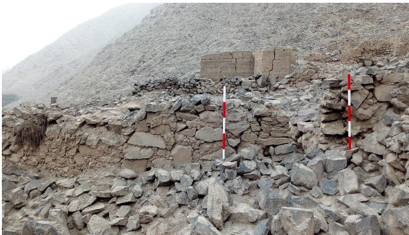
Figura 8: Vista de los muros con la técnica constructiva del tapial y muros de piedra con argamasa en el sitio arqueológico de Gloria Chica. Vista de oeste a este.