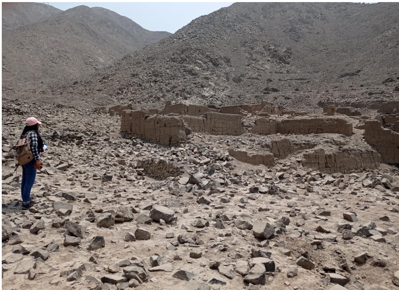
Figura 4: Vista del conjunto arquitectónico de tapial del sitio arqueológico Gloria Chica. Vista de norte a sur.