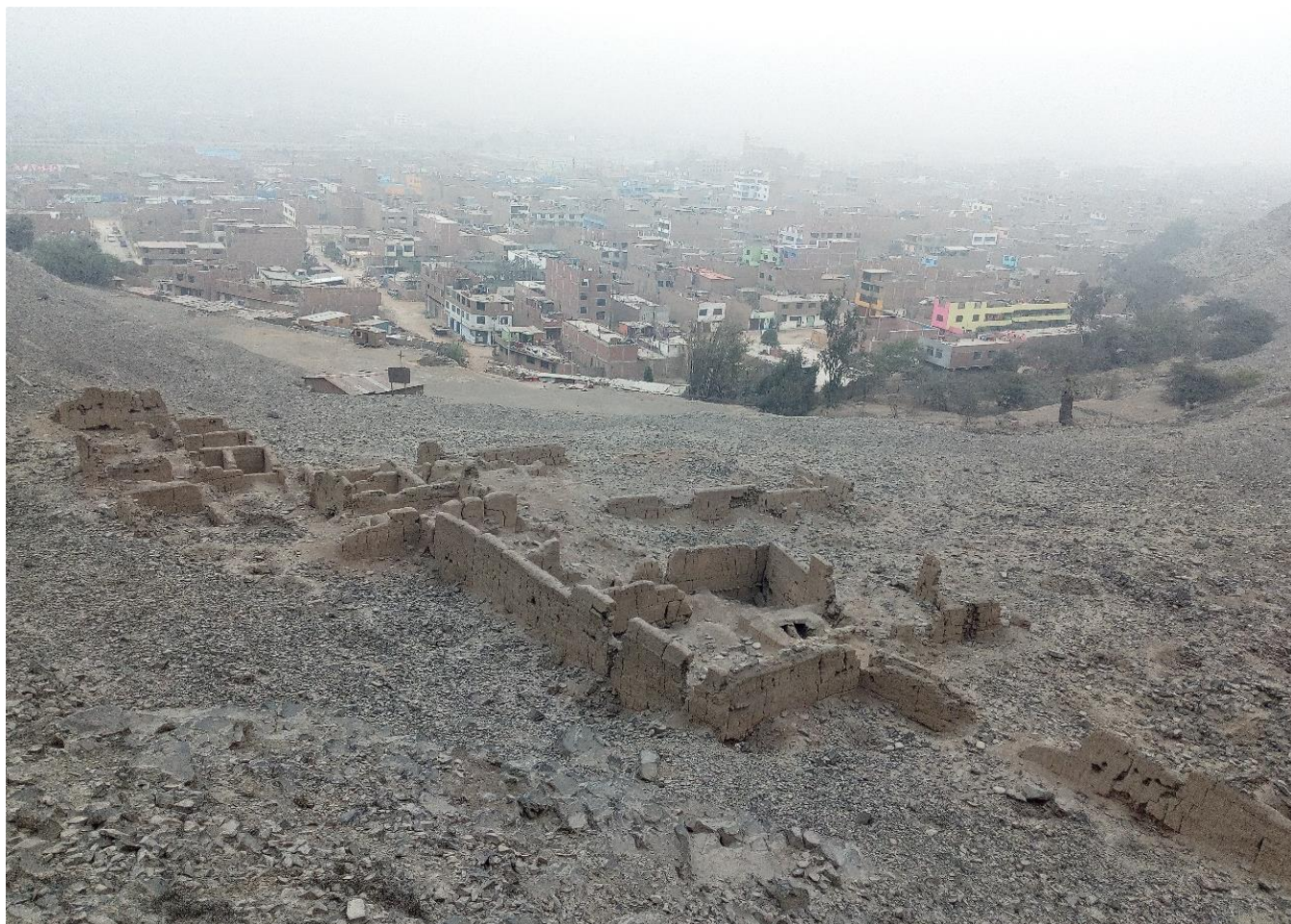
Figura 3: Panorama de la Residencia de Elite del sitio arqueológico Gloria Chica. Al fondo se visualiza la urbanización San Germán. Vista de Sur a Norte.

de los monumentos. A fines de la década de 1990, el Lic. Luis Felipe Villacorta hace un estudio del valle medio y bajo del río Rímac proponiendo la existencia de Conjuntos Palaciegos (Villacorta 2001) y los caracteriza por estar encerrados en muros perimétricos, tener áreas abiertas con depósitos y recintos con funciones residenciales y de almacenamiento. Luego en el 2004 postula que la arquitectura del poder estuvo íntimamente ligado a un tipo particular de edificio: La residencia de elite o palacio. (Villacorta 2004).