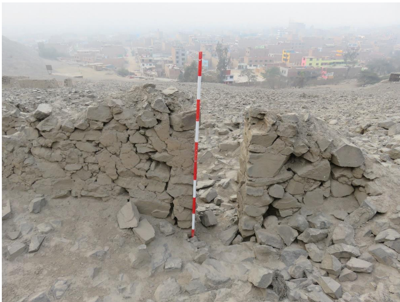
Figura 7: Vista de un vano de acceso compuesto por piedra y argamasa del sitio arqueológico Gloria Chica. Vista de sur a norte.