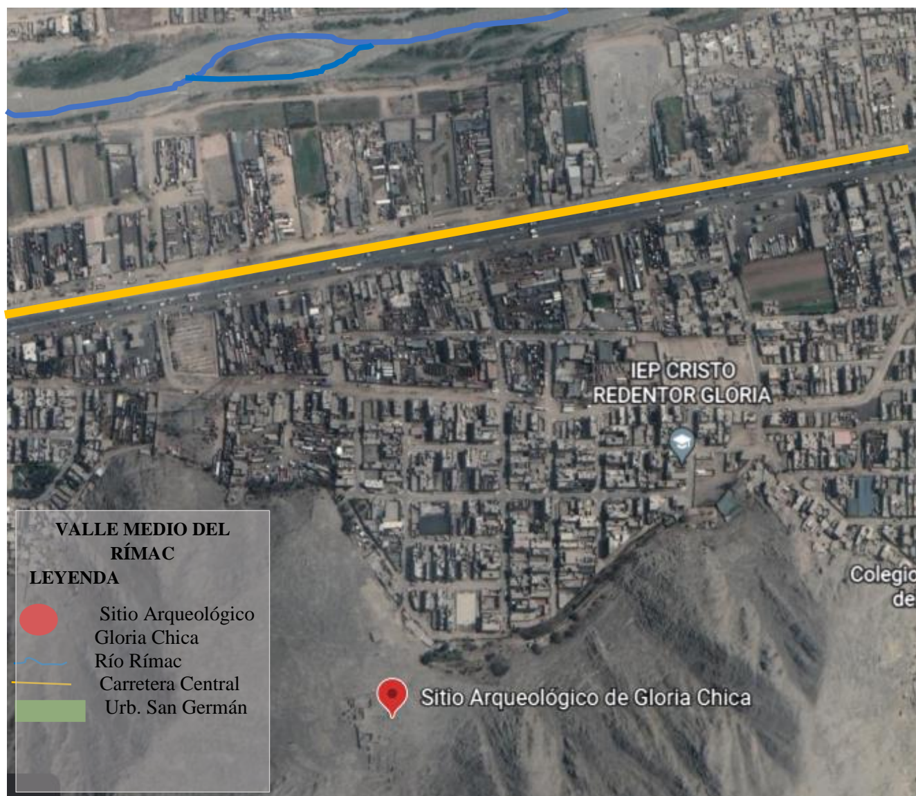
Figura 1: Imagen de la ubicación del sitio arqueológico Gloria Chica, valle medio de la margen derecha del río Rímac.