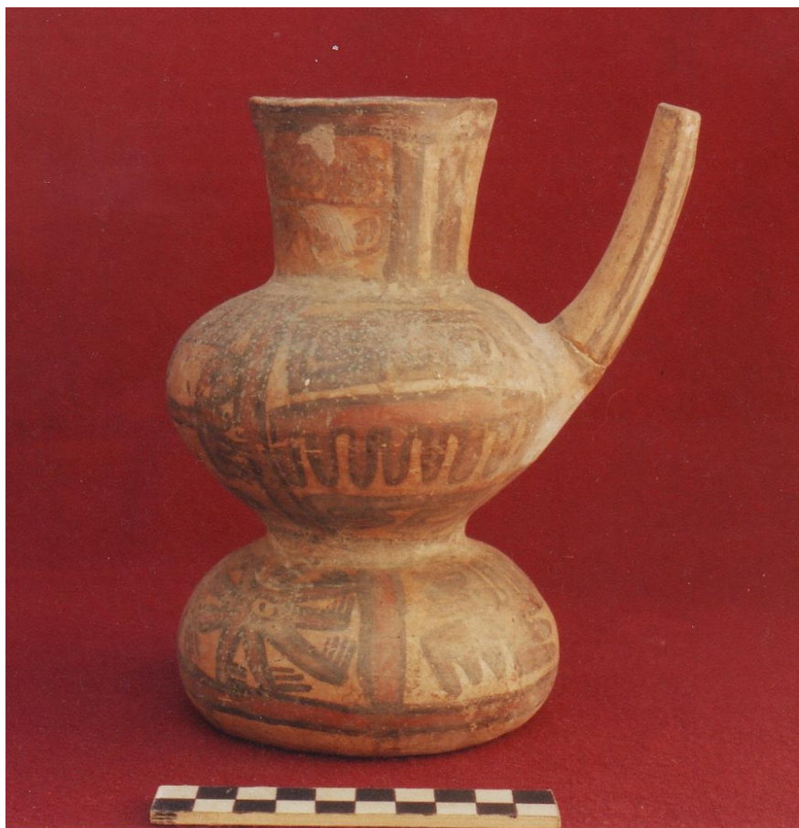
Figura 7: Vasija de doble cuerpo de estilo Nazca Tardío en Wariwillca.

Sus formas son de vasijas cerradas en su mayoría, con gollete y asa lateral (Shady; 1989), doble gollete y asa puente, con soporte trípode, cancheros, así como cántaros mamiformes. Para el Horizonte Medio 2A, el estilo Nievería se asocia con Pachacamac y Atarco (Shady, 1989, p. 20). Su distribución nuclear fue en la cuenca del río Rímac, Chillón, Ancón y Lurín, y en las áreas periféricas, en Huaral, Huaura y Supe-Pativilca y en las zonas alejadas como en la Costa Norte y Sierra Norte (Callejón de Huaylas).