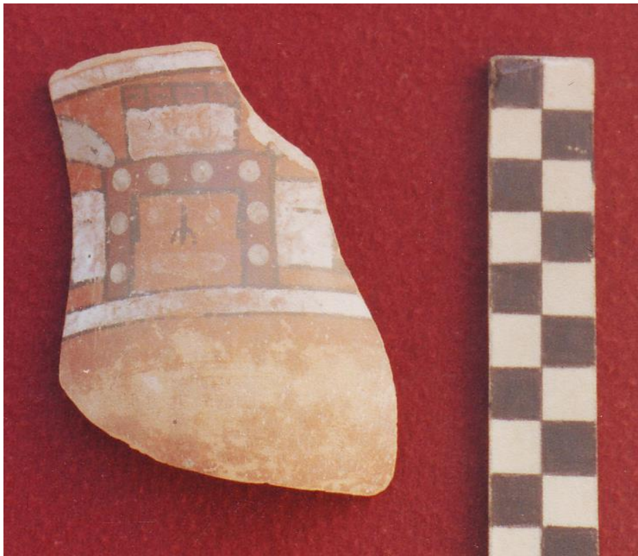
Figura 5: Fragmento cerámico de Estilo Pachacamac, ubicado en Wariwilka.

La fase identificada en la Zona Arqueológica Monumental Huari, como Fase Quebrada de Ocros (400-600 d.C.), se inicia a finales del Intermedio Temprano y finaliza en el Horizonte Medio 1A. Del templo semisubterráneo de Moraduchayuq, siguiendo la construcción del muro de piedra y el piso de barro, el templo fue modificado varias veces por la adición de relleno y nuevos pisos. Una muestra de carbón de los estratos últimos produjo un fechado de 720 +/- 60.