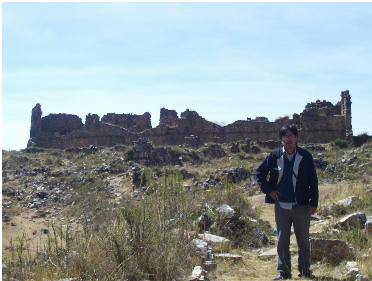
Figura 3: Vista del sector del Castillo, Markahuamachuco.

El sitio ocupa una terraza remanente o espuela de casi 2 o 3 km de ancho que se proyecta a 6 o 7 km dentro del valle de Ayacucho desde el flanco oriental. La superficie de la espuela es bien elevada desde el fondo del valle, y las altitudes fluctúan desde casi los 2600 m en las partes más bajas, en el lado occidental hasta casi los 3000 m en el este, donde se une el lado principal del valle.