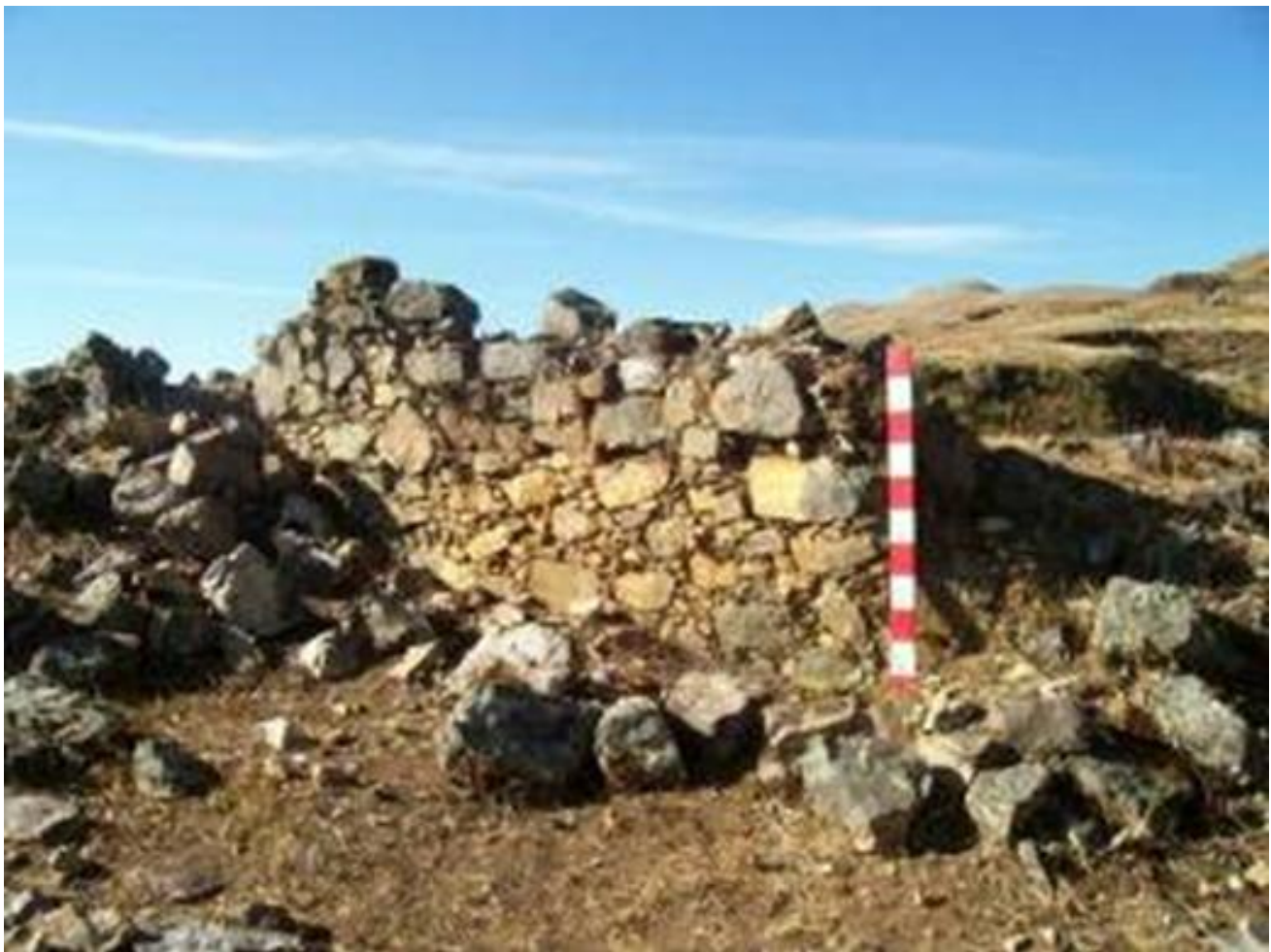
Figura 1: Vista de un muro formativo con la técnica de la pachilla. PEA La Arena, 2007.

De acuerdo, a lo indicado líneas arriba, se desprende que Marcahuamachuco configuró diversas funciones dentro de su misma área, a través de los diferentes tipos de recintos, donde prevalece una continuidad en su ocupación con cambios estructurales leves, lo que le confiere una autonomía social, política y económica antes, durante y después del Horizonte Medio. Además las características arquitectónicas son resultados de una larga tradición cultural (Fig. 1), lo cual le da una autonomía regional y establece vínculos e interacciones en el área de la sierra norcentral andina, lo cual debido a su prestigio en el ámbito religioso influyó de manera concreta y decidida hacia el sur, donde el área que tuvo dentro de sus funciones el culto a los ancestros influyó también decididamente hacia todo el área andina, esto se ha definido a través de los recintos de diferentes formas como las galerías con nichos y torres rectangulares asociadas con restos humanos.