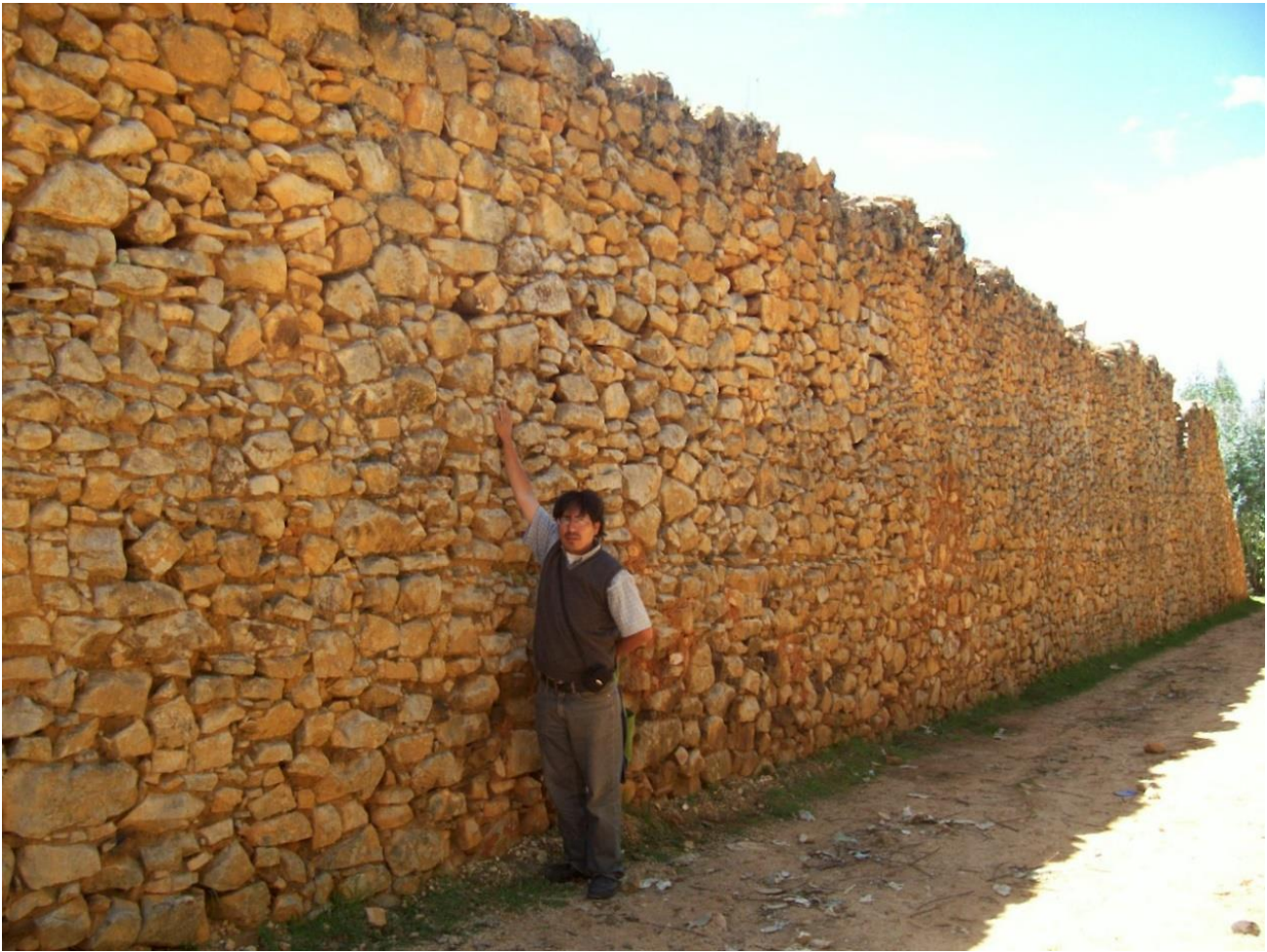
Figura 6: Véase la altura de un muro en Wiracochapampa.

Está claro que el templo no fue destruido, sino renovado y el sitio preparado para una nueva edificación. Lo que indica una renovación tal cual se hacía en el Periodo Precerámico. La interrogante primera es si las capas finales sobre el piso del templo representan pisos finales o deliberados rellenos de entierros. Hay interrogantes acerca de la reconstrucción del muro oeste. No hay un estrato de basura en el templo para indicar un periodo muy largo de desocupación antes que la nueva edificación fuera construida sobre el templo. La nueva fase de construcción data al Horizonte Medio Época 1B.