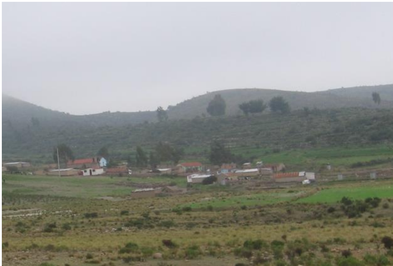
Figura 5: Vista del poblado de San José de Uzuña.

sacrificio de una niña con estos fines puramente rituales (la momia juanita). Además, ampliaron los andenes y terrazas con fines puramente agrícola, aprovechando al máximo las laderas escarpadas y edificando sinuosos y complejas obras hidráulicas, trasladando el agua desde lejanas zonas.