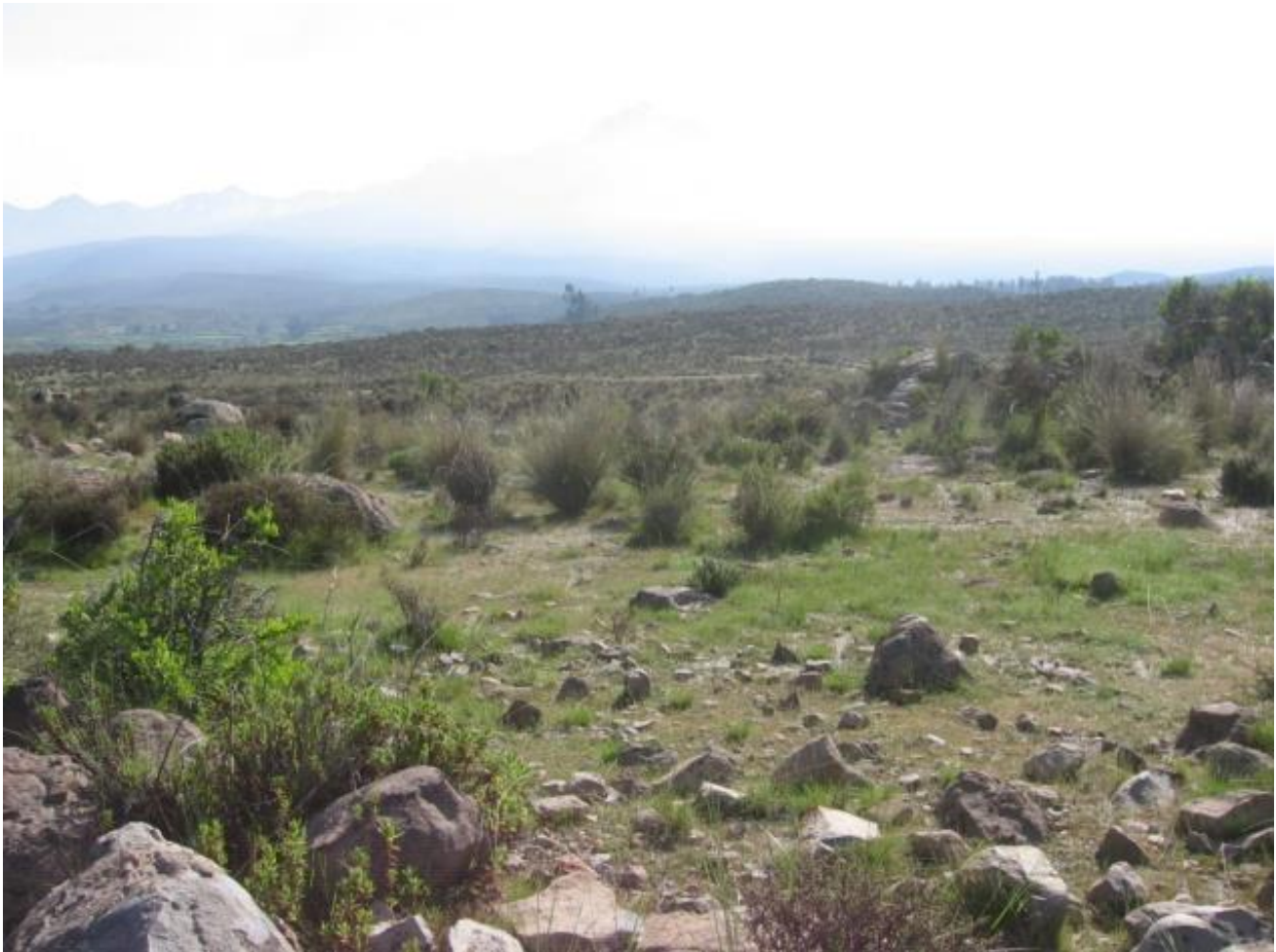
Figura 2: Vista panorámica de la puna de Polobaya.

Son escasos los antecedentes de investigación en esta zona, aunque a nivel departamental los estudios realizados han permitido proponer una secuencia de ocupación cultural prehispánica que abarca desde los periodos más antiguos hasta la invasión española.