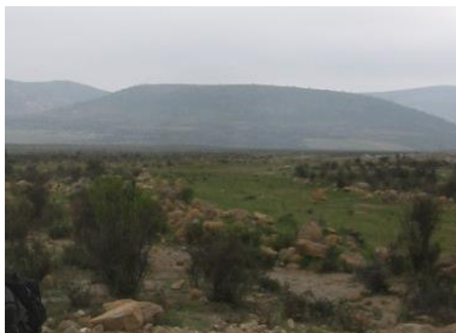
Figuras 3 y 4: Vistas del paisaje del área de investigación.

Para el Periodo Formativo u Horizonte Temprano las investigaciones en el valle de Arequipa han determinado la introducción de una economía agrícola, con un patrón de asentamiento basado en pequeños asentamientos en el fondo del valle, con terrazas de cultivo asociadas. Los sitios son muy simples, con arquitectura a base de piedras canteadas unidas con o sin argamasa.