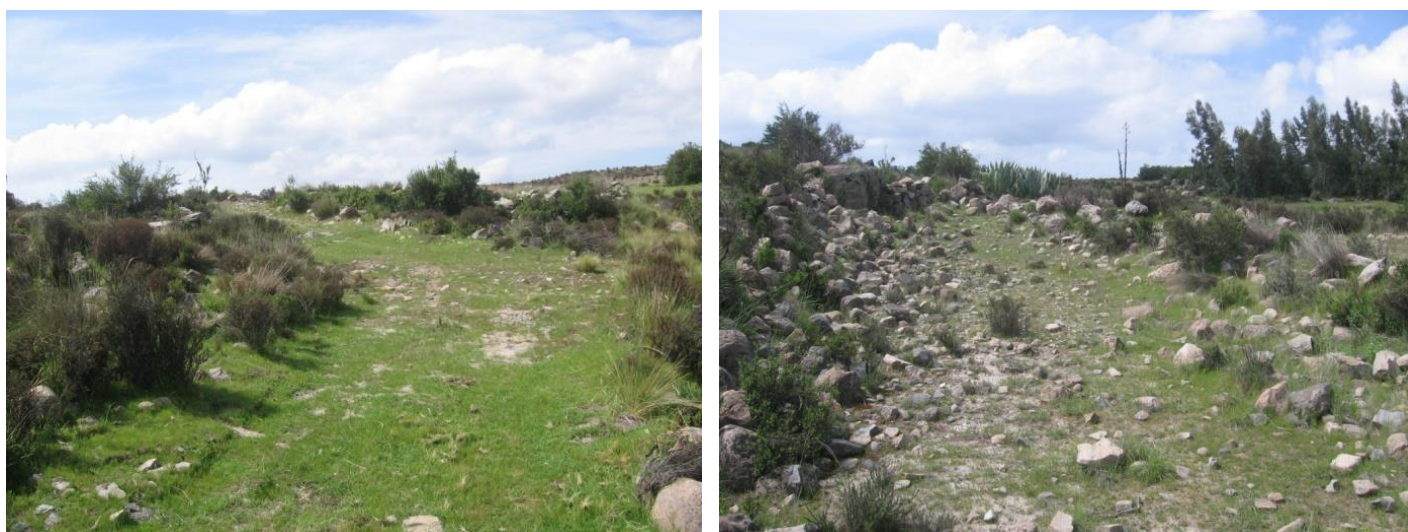
Figuras 11 y 12: Vistas panorámicas del camino 1.

Se ubica entre el punto 15 y 14 del sistema eléctrico Polobaya, a casi 20 metros de distancia del punto 15 pasa un camino de 6 metros de ancho, delimitado por piedras de gran tamaño que llega hasta la esquina de la colina, discurriendo luego en zigzag. Se ubica en la coordenada UTM: 251233E, 8167338N, a 3290 msnm.