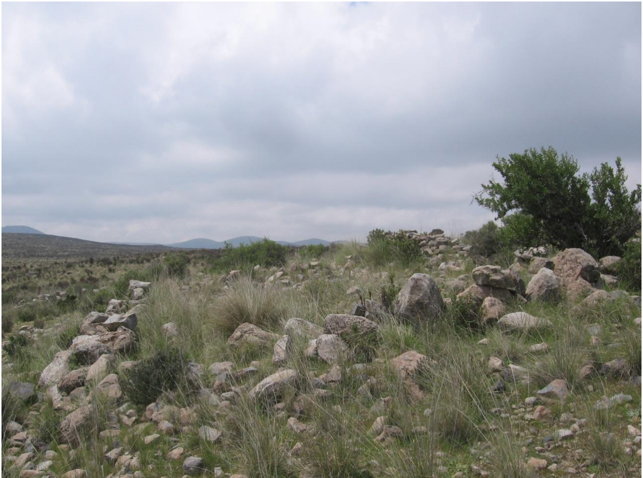
Figura 10: Vista de uno de los extensos corrales del sitio.

En la cima que corona la lomada se aprecia una estructura de forma casi rectangular con esquinas curvas, orientado en el eje Norte – Sur, de 17 m. x 6 m., edificado a base de piedras canteadas, apreciándose solo la base del mismo. Junto al canal bajo se aprecia una estructura elevada (a desnivel) de forma rectangular que presenta el vano hacia el lado oriental. La estructura tiene 4.80 metros de ancho y 21 metros de largo. Los muros tienen entre 0.80 y 0.90 metros de ancho. Presenta en su interior tres compartimientos de forma cuadrangular cada uno. En el lado posterior se ubica a +0.50 metros con respecto a la superficie natural y en la parte frontal a +1.00. El vano principal tiene 1.40 metros de ancho. Hacia el lado SE del sitio se aprecian algunas estructuras de planta cuadrangular, de amplio tamaño.