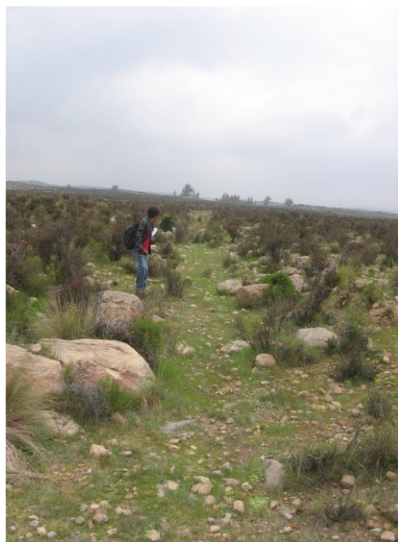
Figuras 14 y 15: Vistas panorámicas del camino 2.