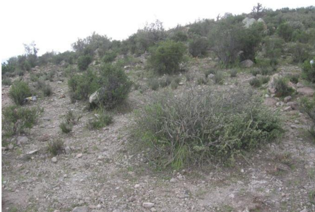
Figura 1: Vista de la vegetación local en la puna de Polobaya.

El área del proyecto, en general, presenta condiciones climáticas con temperaturas frías entre -5 y 25° C, con presencia de hielo en las zonas altas. Los meses de diciembre a marzo se caracterizan por la presencia de precipitaciones pluviales, en los meses de junio, julio y agosto se presentan vientos fuertes. La temperatura promedio es de 15 °C.