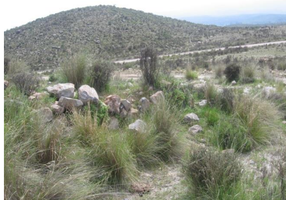
Figuras 7 y 8: Vista de una de las estructuras de planta cuadrangular del sitio.