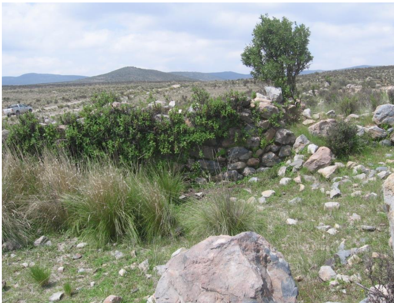
Figura 6: Vista de uno de los muros que delimitan los espacios del sitio por el lado Oeste.

Estado de Conservación: El sitio se encuentra en mal estado de conservación.