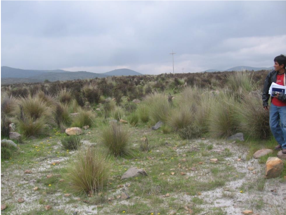
Figura 16: Vista panorámica del camino 3.

Camino que va de Agua Buena a Bellavista. Tiene 6 metros de ancho y va a desnivel con respecto a la superficie (profundidad). Está delimitado por piedras de regular tamaño a ambos lados. Se unía con el camino 2. Cruza la línea en 251945E, y 8166943N, a 3311 msnm.