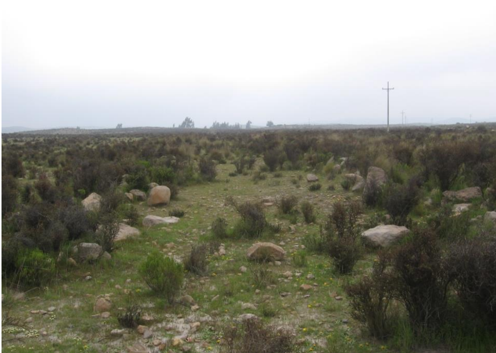
Figura 17: Vista panorámica del camino 3.