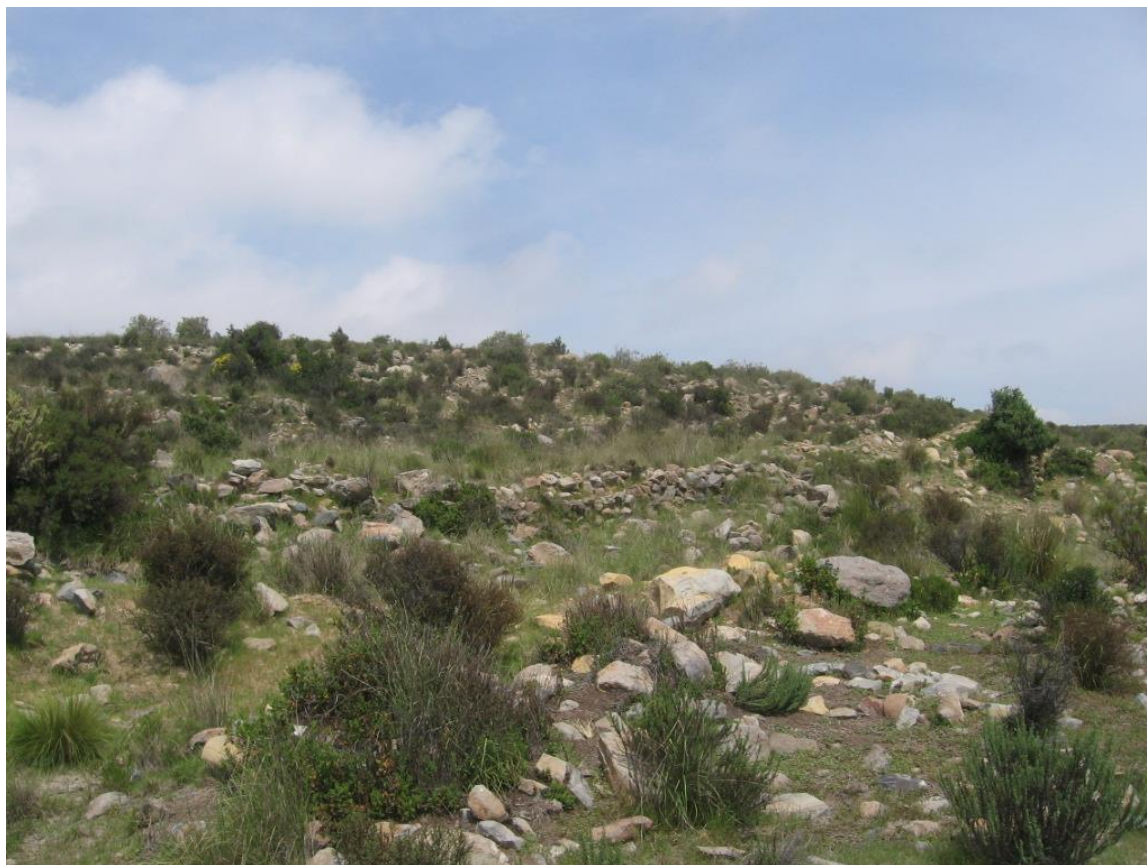
Figura 9: Vista panorámica del sitio.

La estrategia constructiva del sitio denota la construcción de plataformas, sobre las cuales se han edificado amplios patios (de hasta 13 m. (N-S) por 14 metros (E-W), de planta cuadrangular. En la parte superior del espolón del cerro se aprecia una estructura de planta rectangular, de 7 metros de largo por 5 metros de ancho, orientado en el eje Norte – Sur, construida sobre un aterrazamiento, edificado a base de piedras canteadas de hasta 1.10 metros de altura. Los muros están muy destruidos. En la superficie interna se aprecian abundantes piedras producto del colapso de los muros.