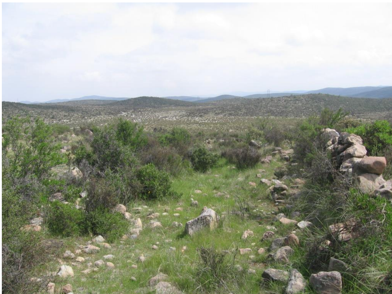
Figura 13: Otra vista de camino 1.