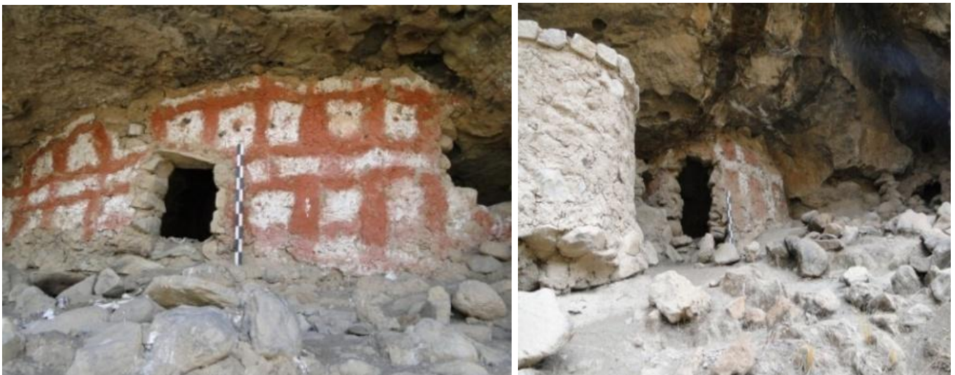
Figuras 11 y 12: Nótese las formas de diseño en su muro.

En el segundo caso, presenta una decoración en forma de cuadros (ajedrezado) con una línea horizontal, en la parte superior y en la parte media adosado a la roca viva, con la misma característica se observa la siguiente estructura con líneas verticales y una horizontal en la parte media, estas estructuras se registran en la parte superior, que probablemente al igual que las estructuras del tipo A, fueron diseñados para personas de estatus social importante (véase Figuras 11 y 12).