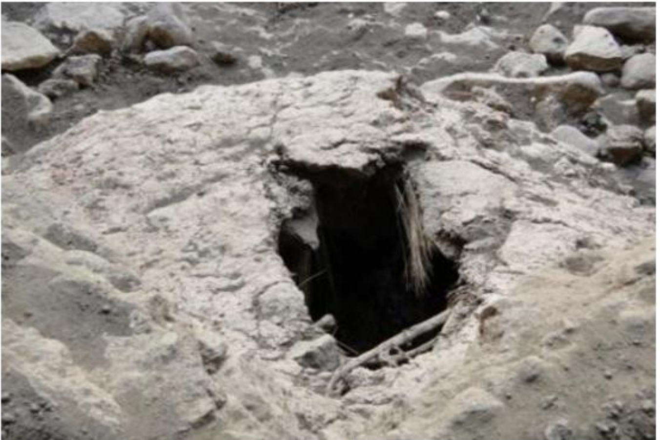
Figura 15: evidencia las formas de techo.

En el tercer caso, las cubiertas o techos de las estructuras arquitectónicas, se registra en las chullpas de forma ovoide, circular, los cuales se ubican en los espacios abiertos o libres, es decir para este caso se utilizó vigas para el armazón y soporte de techos, para el amarre de estas vigas o traviesas se habría usado el tiento (qeswa) hecha a base de cuero de camélido otras veces habrían sido fabricado a base de paja liza (huaylla ichhu), cabe precisar, que estos materiales son propias de la zona, como Qeuña, Tásta, ichhu, una vez construida el armazón del techo de la estructura, la superficie exterior de la cubierta muestra un enlucido con mortero de arcilla mezclada con paja, dándole un acabado final al techo de la estructura (véase figura 15). En la figura 16, el acabado de techo es muy diferente que las anteriores mencionadas, es decir por encima del techo aparece otra estructura pequeña como segundo nivel, probablemente para acondicionar el enterramiento de un niño, rodeado de piedras con evidencias de enlucido, es así que en el intermedio se registra una capa gruesa de paja, para darle seguridad a un segundo nivel. Probablemente estas construcciones corresponden a una secuencia ocupacional el cual es materia de una investigación.