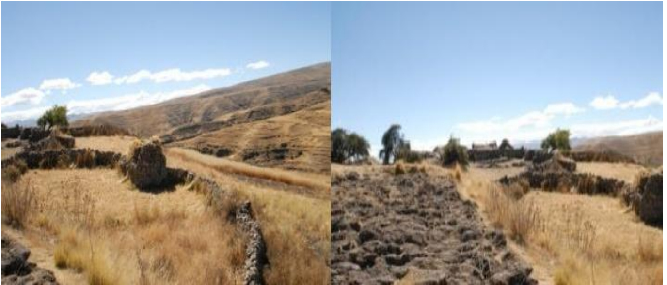
Figuras 5 y 6: Vista panorámica de la zona T'oqra ubicada en la cima del cañón de Ch'iñisiri.

de 0.40m a 0.60m. de ancho, de formas circulares, ovaladas y rectangulares, asociado a estas estructuras, se evidencia fragmentos de cerámica decorados y llanos, del periodo Horizonte Medio, Intermedio Tardío y cerámica doméstica 11 así como herramientas líticas, que corresponde a puntas de proyectil en obsidiana, cuarzo, batanes, morteros, reutilizados a la fecha y muchos de ellos partidos en dos. En este entender es necesario precisar que el pueblo de Toqra, habría aprovechado los espacios de abrigos naturales de Ch'iñisiri para sus enterramientos (figuras 5 y 6).