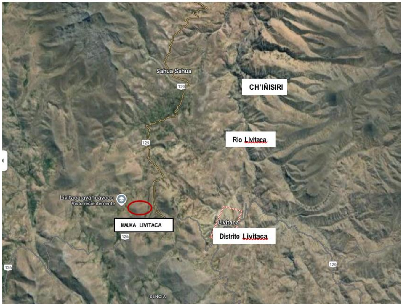
Figura 2: Entorno geográfico del sitio.

pacífica; por lo que Inca Yupanqui tuvo que tomar medidas necesarias para integrarlos a las etnias de estas provincias (Cieza, 1553: cap. LII), luego el Inca organizó el pueblo en ayllus disponiendo la organización política encabezado por los curacas y gobernadores, planificando para estos efectos, sus formas de vida a través de ayllus. En esta perspectiva el pueblo de Livitaca en el periodo Inca estaba al servicio y sujeto al inga Topa Inga Yupanqui y posteriormente a sus descendientes 2 . En el aspecto social la forma de vestir, tomó su propia característica de la zona que fue permitido por el Inca 3 A partir de la presencia de los Incas, Chumbivilcas formó parte de los Condesuyo, por ende, Livitaca. A partir de entonces se precisa que el pueblo de Livitaca está entre los límites del Condesuyo y Collasuyo; dicho ejemplo se demuestra en la actualidad, con la fiesta ritual y/o batalla (pelea) de Tocto entre comunidades de Livitaca, Condesuyo y las comunidades de Canas Collasuyo por reconocimiento de sus linderos; es así que, desde el punto de vista Histórico, Livitaca es privilegiada porque recibe la influencia de dos culturas, de los Condesuyos y Collasuyos 4 .