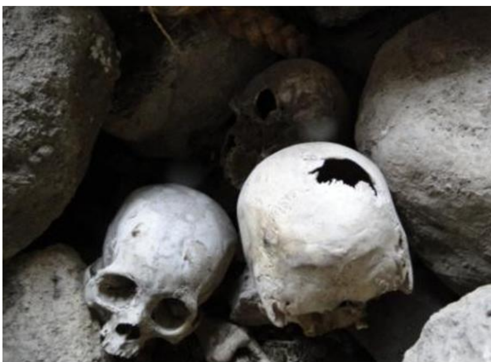
Figuras 19 y 20: véase los cestos y cráneos dispersos.