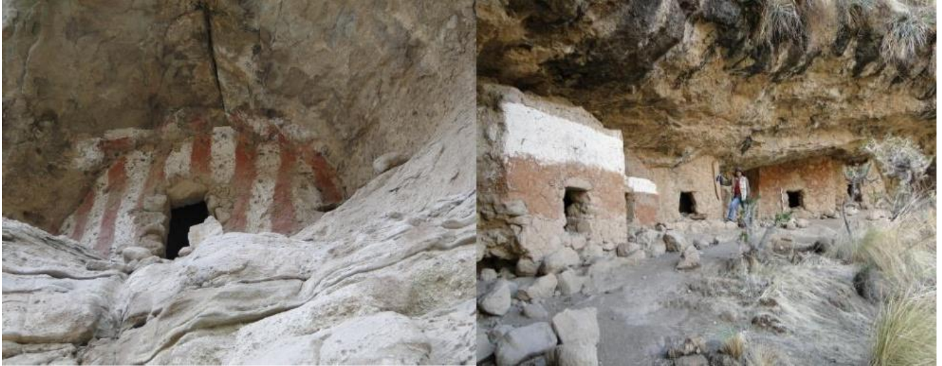
Figuras 9 y 10: Nótese diseños de bandas verticales.

El primero corresponde a estructuras con diseños de bandas horizontales y verticales, se exhiben en Chullpas de forma ovoide, cuadrangular y circular, los cuales se ubican en las partes altas que están adosadas a roca viva, probablemente fueron diseñados para personajes de estatus social importantes o de Jerarquía (véase figuras 9 y 10).