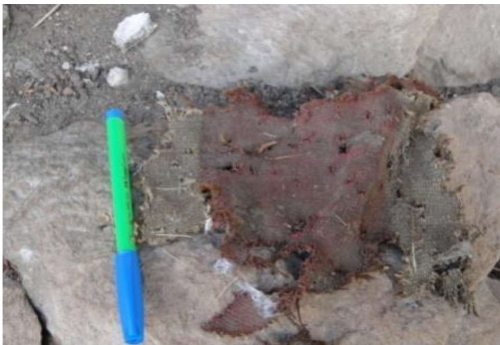
Figuras 17 y 18: formas de tejidos.