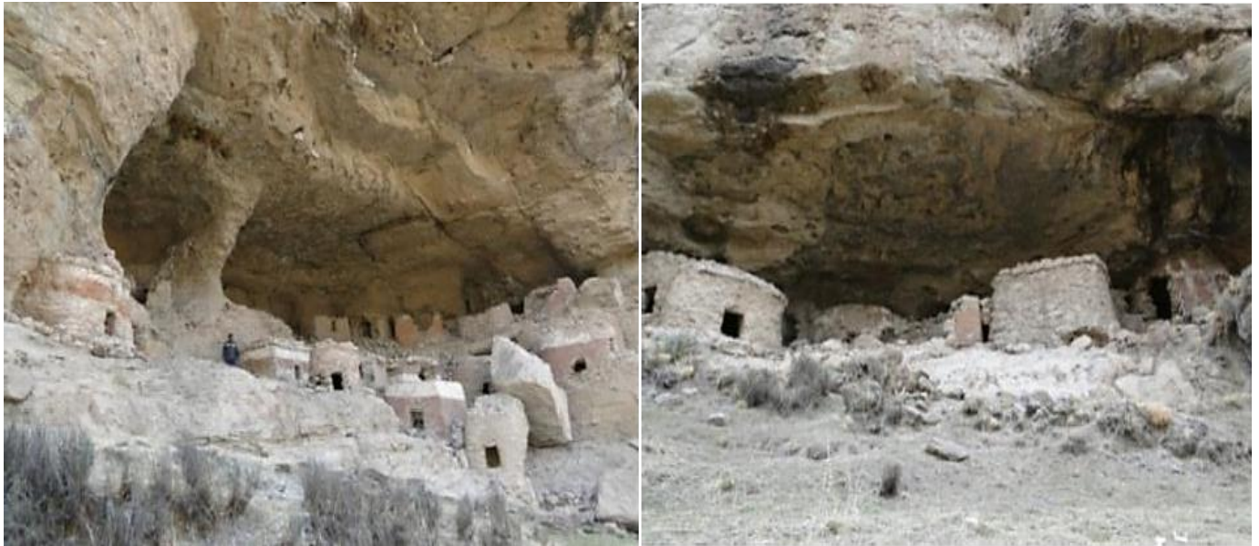
Figuras 7 y 8: Vista del Cementerio Pre- Hispánico por debajo de las grutas.