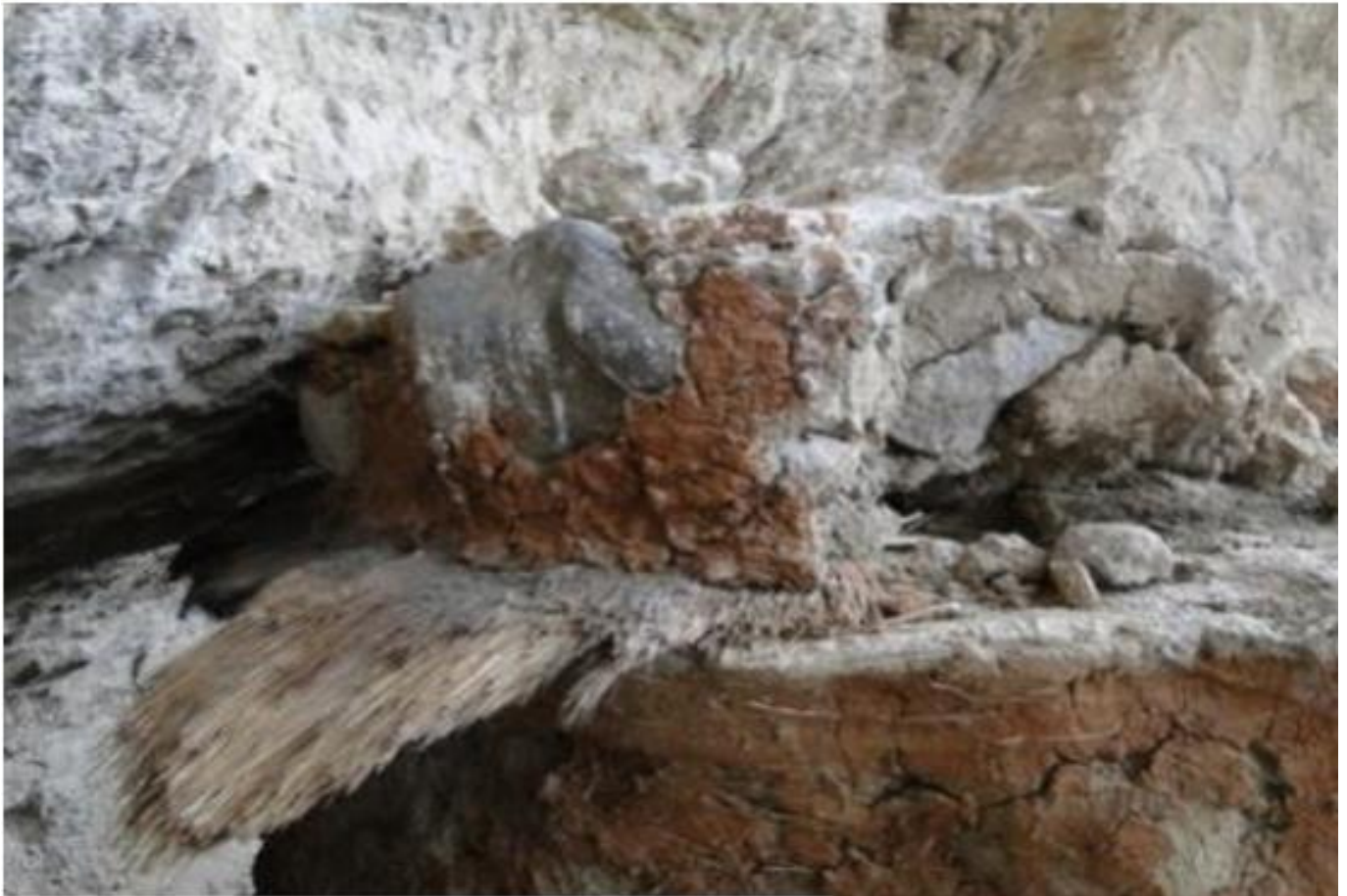
Figura 16: evidencia las formas de techo.