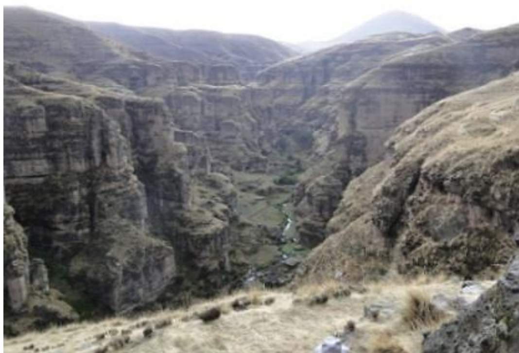
Figuras 3 y 4: Registro panorámico del cañon Ch'inisiri.

Se verifica, que el cementerio Ch'inisiri está articulado a la población y/o caserío de Toqra, el cual se ubica en la parte superior como una meseta, pertenece a la Comunidad Unión Qora, del Distrito de Livitaca Provincia de Chumbivilcas, a 3851 m.s.n.m entre las coordenadas UTM 0211157 E 8422164N, está asociado a dos quebradas profundas, por el lado Nor Este con el Cañón de Ch'inisiri, y por el lado Oeste con el río Livitaca, cuyas aguas desemboca en el río Apurímac., el poblado se ha acentuado sobre las bases de una población antigua; cuyas viviendas y cercos perimétricos, se ha construido utilizando elementos líticos de la época prehispánica, por debajo de las viviendas, patios y canchas, se denota cimientos pre hispánicos,