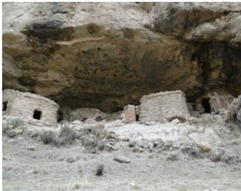
Figuras 13 y 14: Nótese la forma de techos.