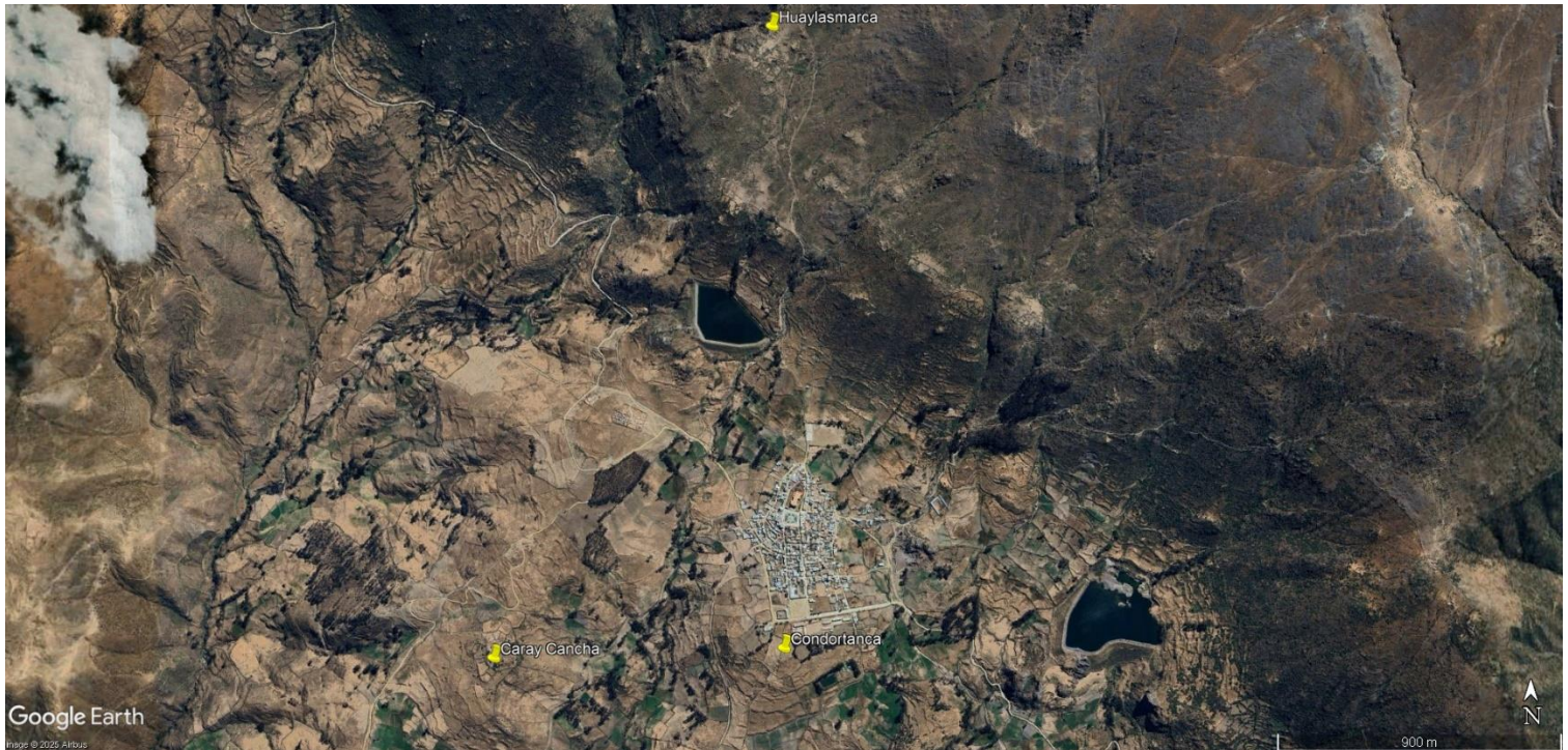
Figura 1: vista de ubicación de los tres sitios arqueológicos en relación al pueblo de Huamantanga.

Se trata de un sitio ceremonial del Tawantinsuyu que se encuentra mencionado en numerosos documentos de extirpación de idolatrías de la provincia de Canta. Se trataría de un templo al Sol que actualmente se encuentra cubierto de tierra.