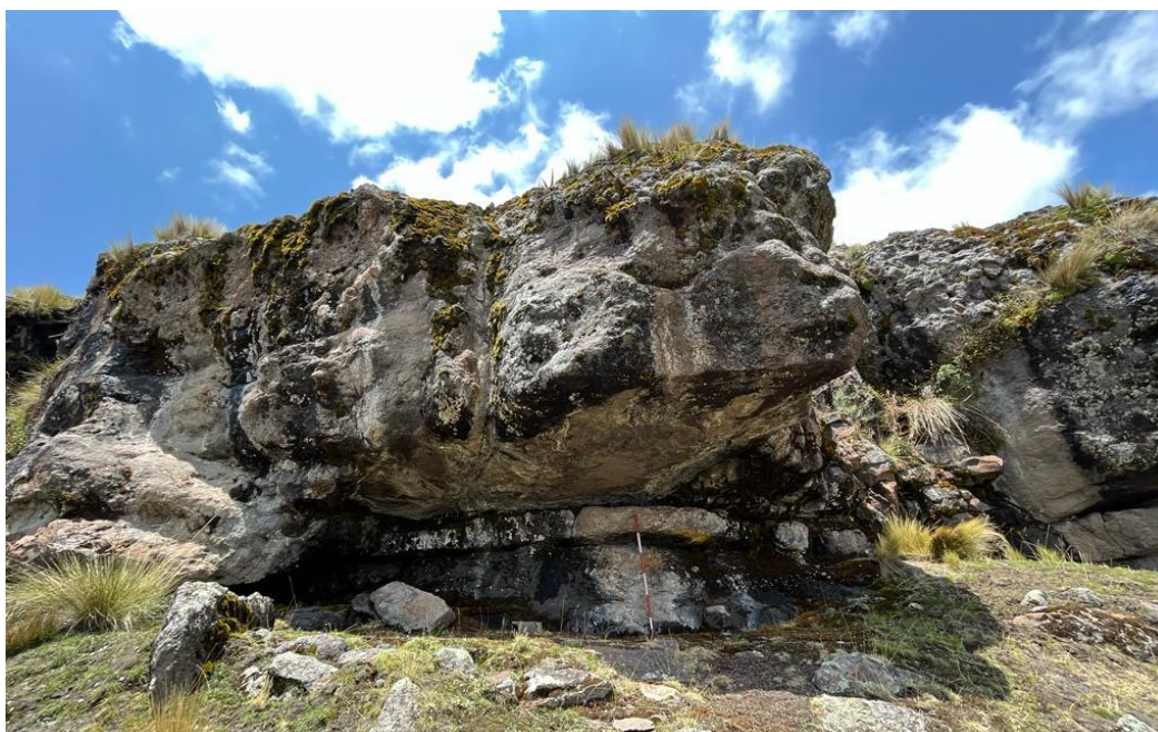
Figura 1: vista panorámica del primer abrigo rocoso de Qonqayllu donde se han identificado las pinturas rupestres.