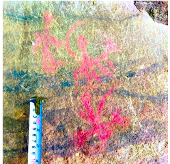
Figuras 9 y 10: Vista de la escena 2.