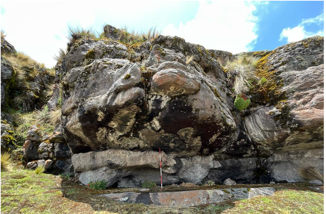
Figura 4: vista panorámica del segundo abrigo rocoso de Qonqayllu donde se han identificado las pinturas rupestres.