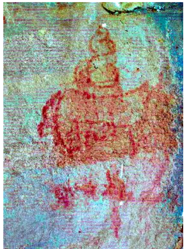
Figuras 11 y 12: Vista de un ave, posiblemente de la zona