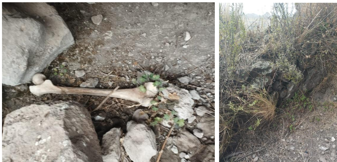
Figuras 7 y 8: evidencia de restos óseos y muro que circunda al abrigo rocoso.

En una de las paredes rocosas internas del abrigo se observan pinturas en color rojo, muy deterioradas por agentes naturales y antrópicos. Se aprecian, sin embargo, algunos motivos conformados por líneas verticales, camélidos, etc.