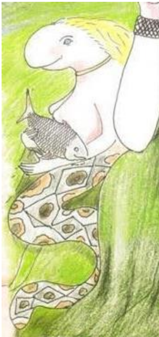
Figura 1: Pocyena según Anselmo Cruz en la caratula de "Los yanesha y la pesca" del IBC (2006).