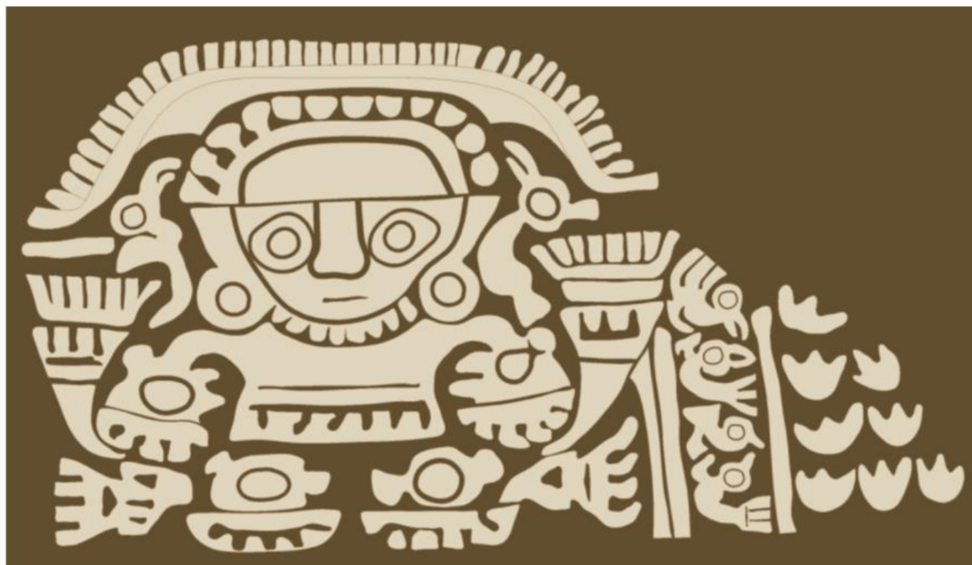
Figura 3: El dios del mar Lambayeque según Narváez (2014).

La deidad del mar de la cultura Lambayeque debe circunscribirse al territorio que esta cultura dominó que es, más o menos, el mismo que la región epónima del Perú actual. Se le va a representar como un ser antropomorfo con manos y pies con forma de ola marina (Figura 3), pero también como una ola del mar; compuesta por varias olas pequeñas, en su remate, en vez de la rompiente de la ola vamos a encontrar un rostro humano, con las características básicas de una máscara Lambayeque. Siguiendo a Narváez (2014) no todas las máscaras son iguales; este ser se encuentra asociado siempre a aves, conchas de Spondylus y serpientes. En otras representaciones de olas éstas son representadas con aves y serpientes, enfatizando este vínculo que, por otro lado, se enlaza con lo representado en la cultura Moche (Golte, 2009).