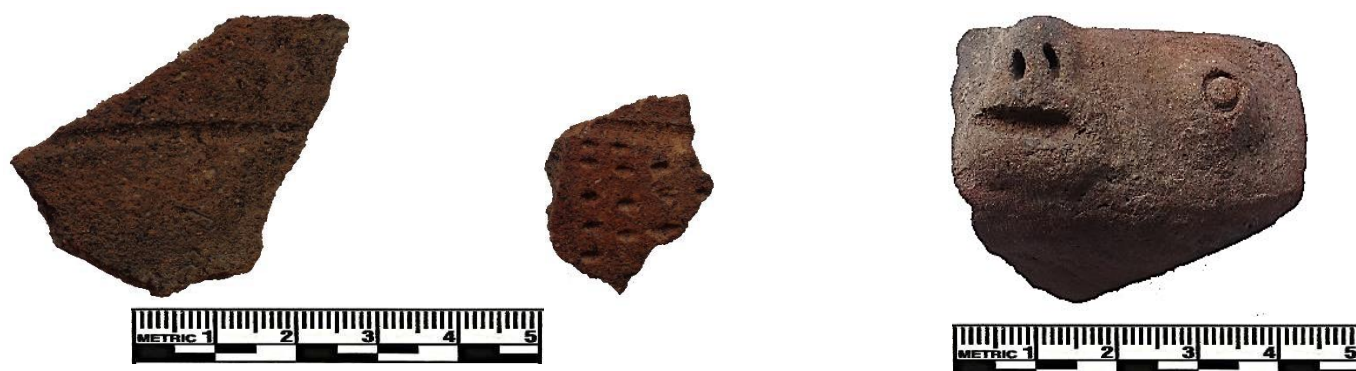
Figura 3: Fragmentos 5, 6 y 7.

En el lugar de Camino Real , también tierras de Cocachacra, en una inclinación con terrazas cubiertas por deslizamientos de tierra, se ha reportado la presencia de fragmentaria cerámica con características estilísticas del Formativo, Intermedio Temprano y Horizonte Medio. La cerámica temprana se corresponde a fragmentos de pasta gris, cocción reductora, con decoración incisa, y engobe negro. Un fragmento muestra líneas delgadas incisas definiendo paneles geométricos en cuyo interior se estila la impresión o estampado de puntos en forma de "D" (frag. 8). Otro fragmento (frag. 8) evidencia un fragmento de cuerpo recto-globular con trazos con línea diagonal incisa.