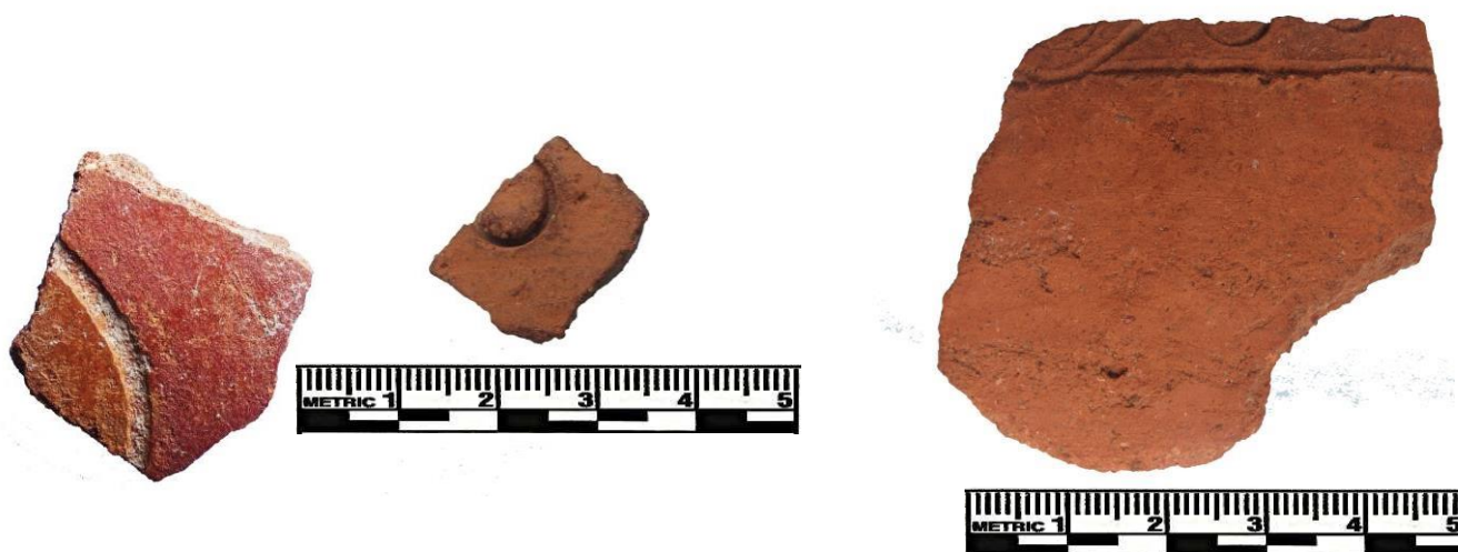
Figura 5: Fragmentos 11, 12 y 13.

8, de imprecisa relación con el grupo Cupisnique poco señalado en el Formativo de la Costa Norte, ha sido sugerido por su presencia en contextos de la Fase Copa de Kuntur Wasi (550-250BC) con un origen en las tierras altas norteñas durante el Formativo Final (Burtenshaw-Zumstein, 2004, pp. 244-245).