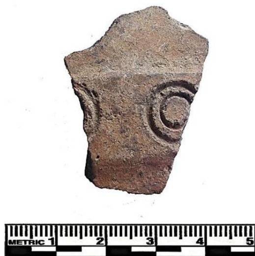
Figura 6: Fragmento 14.

Decorados incisos están bien documentados para el Formativo, sin embargo, el decorado con líneas rectas y líneas sinuosas incisas del frag 12 es de difícil reconocimiento debido reportarse sus motivos de forma incompleta. Un dato no menor para Punkucalla, es la presencia de fragmentos de alfares reportados que revelan partes de cantaros con base de trípode y cantaros de cuerpo carenado. En la quebrada de Canchacalla, San Mateo de Otao, las presencias de cantaros con base en trípode están reportados para inicios del Intermedio Temprano extendiéndose hasta el Horizonte Medio (Milla, 1974b, p. 57, ver lámina 5), mientras los cantaros carenados en sitios como Gatero, están presentes para el Intermedio Temprano (Bueno, 2014), mientras en Sisigaya son evidentes ya desde el Formativo Final (R. Padilla comunicación personal 2019). No podemos precisar la temporalidad del decorado de líneas incisas del frag 12 , pero en general los decorados con líneas incisas y motivos estampados presentes en Punkucalla podrían estar apareciendo entorno a finales del Formativo e inicios del Intermedio Temprano.