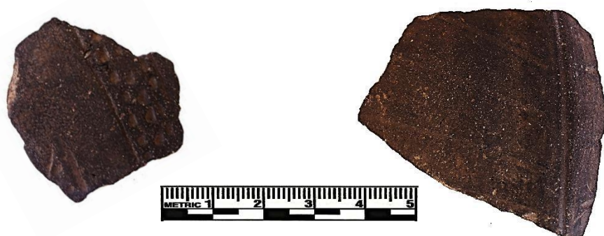
Figura 4: fragmentos 8 y 9.

En San Bartolomé , en la colina donde se construyó el estadio Municipal y una antena de alta tensión, algunos restos de muros aún son visibles en superficie junto con una gran cantidad de fragmentaria cerámica prehispánica esparcida por todo el lugar (Sitio San Bartolomé 01). Los fragmentos diagnósticos, revelan formas de cantaros sin cuello y otros de labio divergente, cuencos y algunas ollas de cuello corto. Manos de moler y restos óseos también ha sido reportados. En este lugar se ha evidenciado un fragmento (frag 10) de pasta marrón rojizo de cocción completa oxidante, con engobe marrón claro, decorado con una línea incisa gruesa y sinuosa (curvada) y pintado en zona. Esta línea incisa parece estar formando círculos grandes, cuyo exterior se halla decorado con pintura en zona, y el interior presenta solo el color del engobe mencionado. Este estilo decorado guarda similitudes con estilo de las botellas de type 8 reportadas por Julia T. Burtenshaw-Zumstein (2004, p. 243, ver figura 7.18 p. 348). El estilo type