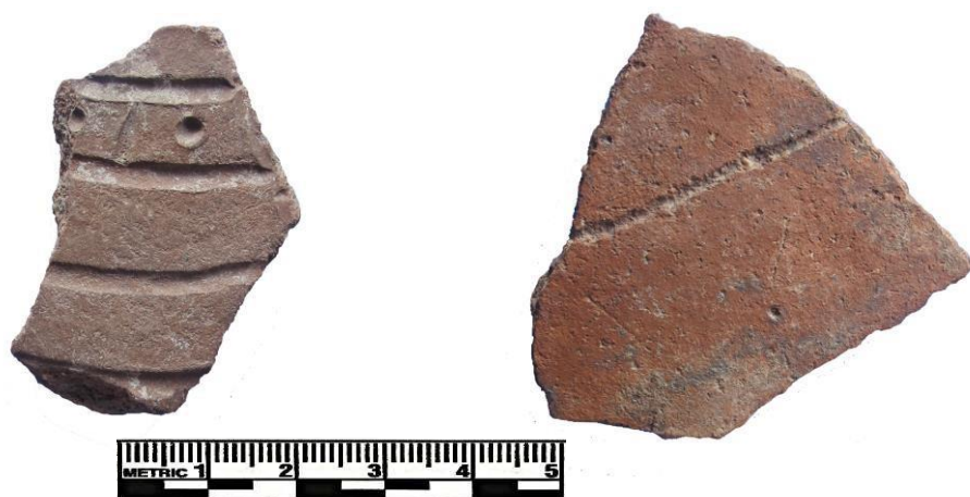
Figura 1: Fragmentos 1 y 2.

En la margen izquierda de la desembocadura de la quebrada Santa Ana-Huayco , otro gran asentamiento de cima de cerro (Sitio Santa Ana-Huayco 01), rodeado de muros perimétricos, con muralla y trinchera de cabecera, patrón semejante a los asentamientos amurallados de larga ocupación del valle medio, evidencia considerable presencia de formas alfareras que van del Intermedio Temprano al Intermedio Tardío. El bastante característico estilo Inca está ausente. Entre las formas de alfares más tempranos se evidencian cuencos carenados, ollas sin cuello, y destaca un fragmento de pasta marrón-gris con decoraciones incisas de líneas rectas y curvas. El motivo representado encierra una línea gruesa en un semicírculo a modo de ojo (frag. 3). Las características del motivo recuerdan al formalismo decorado de los alfares incisos del Formativo Medio reportados en la quebrada Canto Grande (Abanto, 2009).