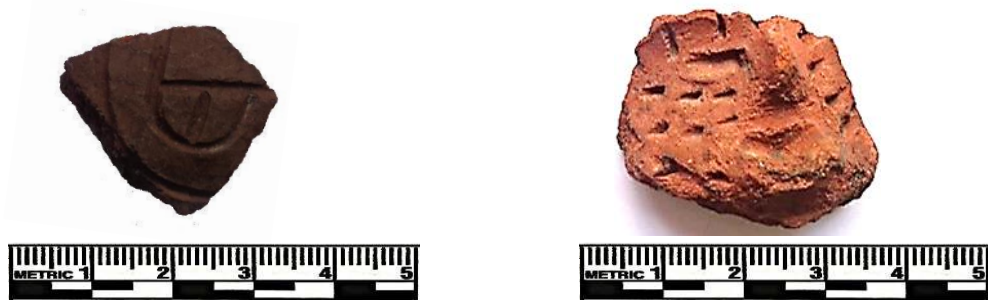
Figura 2: Fragmentos 3 y 4.

En la margen izquierda de la desembocadura de la quebrada Santa Ana-Huayco , otro gran asentamiento de cima de cerro (Sitio Santa Ana-Huayco 01), rodeado de muros perimétricos, con muralla y trinchera de cabecera, patrón semejante a los asentamientos amurallados de larga ocupación del valle medio, evidencia considerable presencia de formas alfareras que van del Intermedio Temprano al Intermedio Tardío. El bastante característico estilo Inca está ausente. Entre las formas de alfares más tempranos se evidencian cuencos carenados, ollas sin cuello, y destaca un fragmento de pasta marrón-gris con decoraciones incisas de líneas rectas y curvas. El motivo representado encierra una línea gruesa en un semicírculo a modo de ojo (frag. 3). Las características del motivo recuerdan al formalismo decorado de los alfares incisos del Formativo Medio reportados en la quebrada Canto Grande (Abanto, 2009).