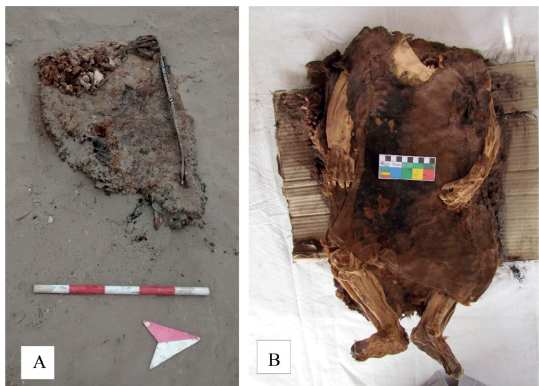
Figura 3. El fardo del Contexto Funerario 26 de la Unidad 10, Subunidad 12 de Cerro Colorado: a) el fardo ubicado in situ en el campo, y b) el cuerpo momificado con la cabeza ausente y la articulación completa de las demás partes.

Nuestro estudio señala también la extracción de cráneos de los fardos. El uso ritual de las cabezas humanas en el Periodo Intermedio Tardío está confirmado por la iconografía de las culturas contemporáneas a Chancay, como Chimú, Lambayeque e Ychma. Una de las cabezas falsas de Macatón analizada por nosotros contenía un fragmento del cráneo de un recién nacido, que en momento de la construcción de la cabeza ya estaba momificado, entonces este fragmento fue extraído de un contexto todavía más antiguo. Sin embargo, tenemos que incluir otras opciones, como la huaquería, pues en muchos casos se puede encontrar un rico ornamento metálico y textil colocado sobre el rostro, o envuelto alrededor,