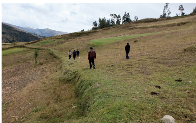
Figura 6. Camino en plataforma en el segmento 1 sección, Rain Córdor – Colquillas

mejor conservadas del camino presenta elementos arquitectónicos como muros de contención que forman una plataforma (Fig. 5), conservando parte del muro de contención de aproximadamente 1 m de altura, con una calzada de 2 m aproximada. Este segmento se encuentra en mal estado de conservación afectado por factores antrópicos y naturales, causados por la expansión de campos agrícolas en terrenos de la comunidad de Rain Córdor. En la parte baja de este segmento se ubica una cantera al