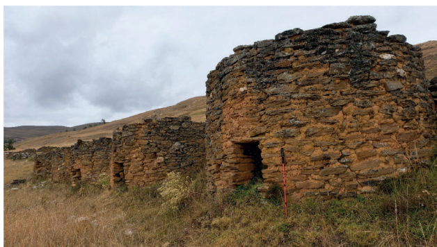
Figura 3. Sector de Guellar Cancha, formado por diez estructuras de planta circular o colcas.

alargada de planta rectangular (kallanka 3 ) que presenta esquinas internas curvas, con cuatro vanos de acceso orientados hacia el suroeste (Fig. 2). Este componente arquitectónico evidencia la presencia cusqueña al interior de un sector público local, que obedecería a una estrategia de control político por parte del estado Inca a los grupos “Wamallí”, que les permitiría contar con importantes aliados en su avance hacia el oriente de los Andes septentrionales.