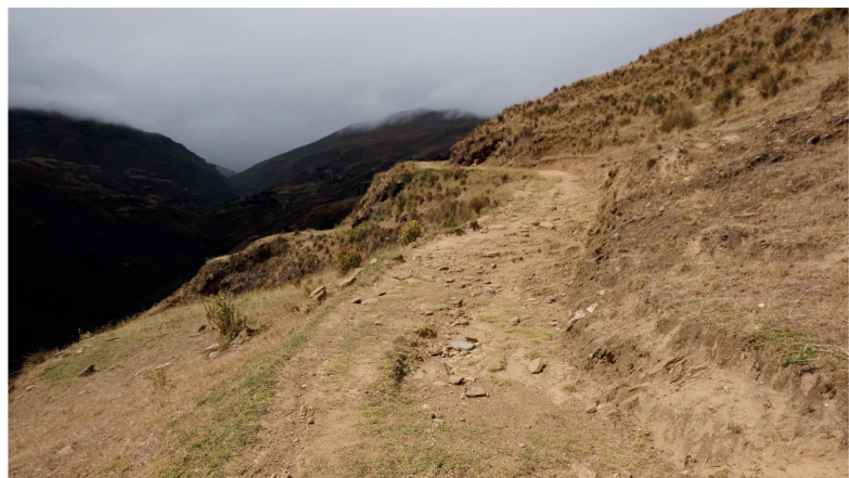
Figura 1. Proyección del camino en corte talud sección Rain Cóndor – Jircancorral, camino al Monzón.

El conocimiento del desarrollo cultural prehispánico en el Alto Maraón es todavía un tema que amerita