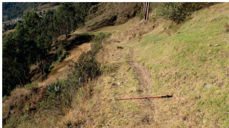
Figura 7. Camino empedrado segmento 2, Sección Rain Cóndor - Colquillas

Christian Vitry (2017:40-41), ha propuesto una secuencia de conquista territorial Inca para el Collasuyu, esquema que vamos a utilizar que nos permite esquematizar el proceso de anexión política y militar del Alto Marañón. En primer lugar sugiere que el estado Inca implementa una etapa de exploración socioambiental, caracterizado por la necesidad de búsqueda de información, una suerte de “servicio de inteligencia”, donde se realizan las pesquisas para conocer los territorios a conquistar, de esta forma elaborar un panorama completo de los recursos humanos y ambientales. En ese sentido, los incas se adentran hacia los principales asentamientos locales ubicados en el Alto Marañón. Las crónicas de Garcilaso de la Vega (1985 [1609]) y Cieza de León