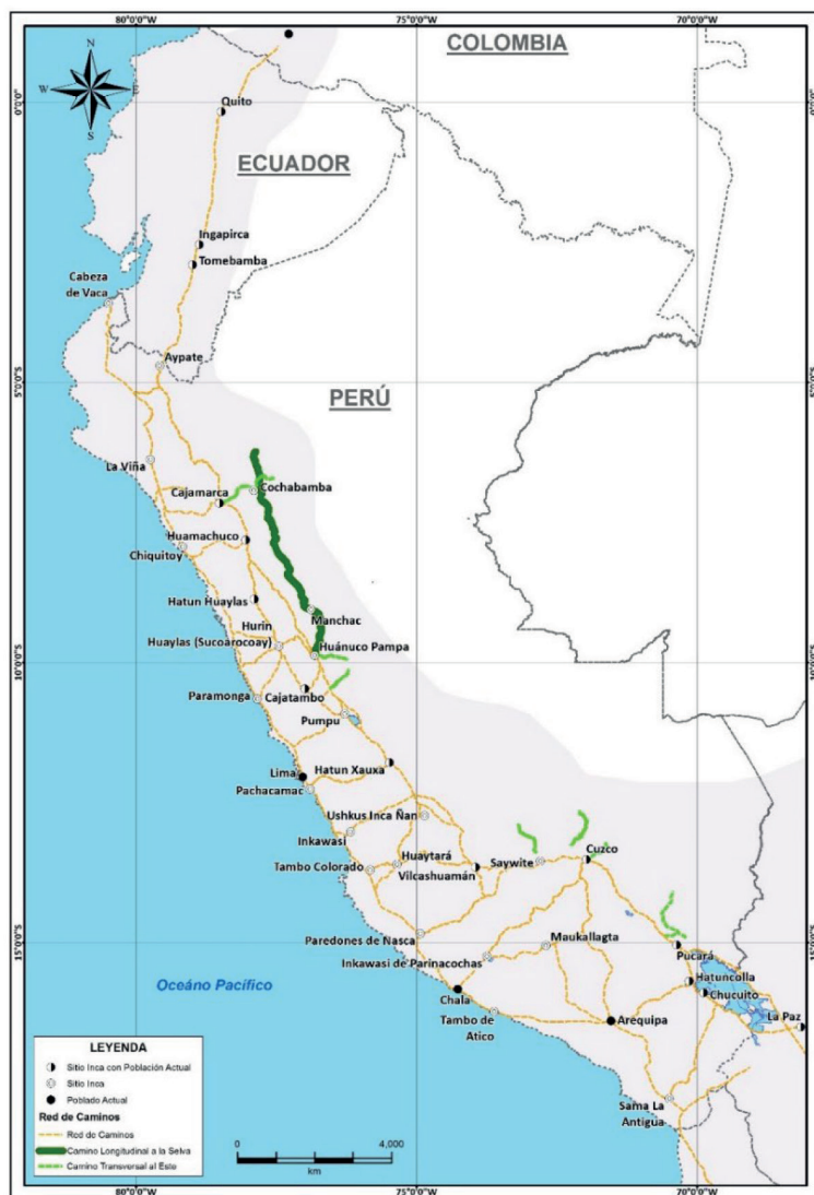
Figura 4. Mapa actualizado de la red vial Inca en base a Hyslop

Para el registro de la vialidad se ha aplicado la metodología de campo y gabinete utilizada por la coordinación de Identificación y Registro del Proyecto Qhapaq Ñan (Ministerio de Cultura 2016); lo que nos ha permitido sectorizar la ruta en tramo, subtramo, sección y segmento, detallando las características físicas del camino de acuerdo a su estado de conservación y sus elementos formales tangibles. Adicionalmente se ha realizado una revisión de las cartas nacionales 1/100,000 y 1/25,000 del Instituto Geográfico Nacional y del Ministerio de Agricultura respectivamente, así como el empleo de