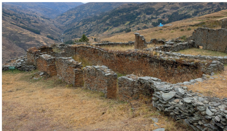
Figura 2. Estructura de planta rectangular de filiación Inca en Garu, sector Gantu Corral Bajo.