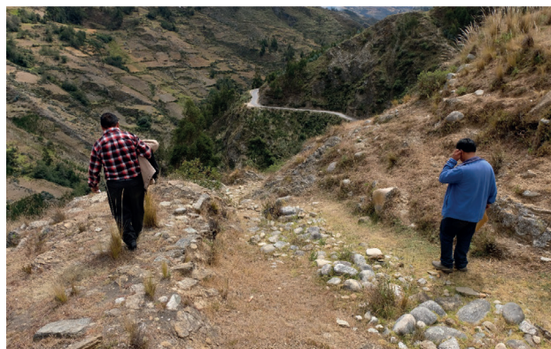
Figura 8. Proyección del camino por daños, segmento 3, sección Rain Cóndor - Colquillas

(2005 [1553]), indican que este contacto se dio al momento de la expansión hacia los Chachapoyas. Los asentamientos Wamallí se encontraban formado por aldeas multi componentes (aldeas-cementerios), con un patrón de asentamiento y arquitectónico común, y organizados políticamente de forma segmentaria (Salcedo 2012). Este conocimiento previo habría permitido a los incas tener un diagnóstico clave para poder diseñar una estrategia de negociación o conquista con cada uno de entidades políticas que ocupaban la cuenca alta del Marañón, ya fuera llegando a un acuerdo pacífico o un enfrentamiento bélico, discutiéndose las propuestas o contrapropuestas para un acuerdo. De acuerdo a las crónicas podemos sugerir que la irrupción Inca no fue drástica o violenta, al contrario los resultados de estos acuerdos fueron pacíficos, llevados por la vía diplomática que