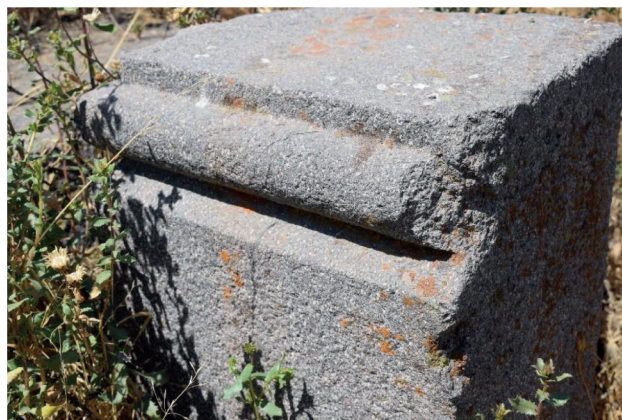
Figura 10. Detalle ornamental cerca del vano de doble jamba de la kallanka.

sitio arqueológico de Yumina (López 2012: 399, INC 2005: 31, 2006: 140).