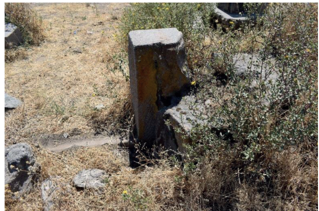
Figura 8. Detalle de la doble jamba (lado Este del vano) de la kallanka.