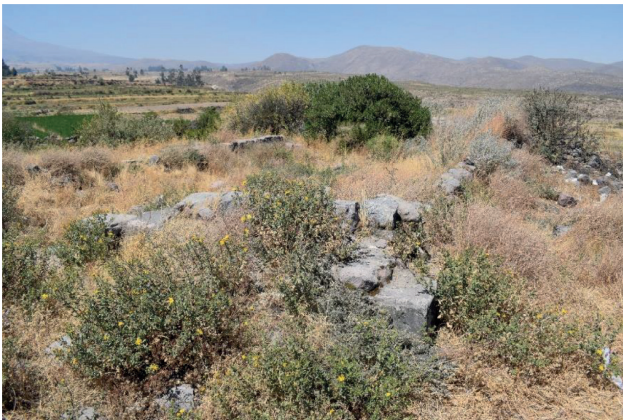
Figura 5. Kallanka inka construida con bloques de piedra labrada y pulida, de 8 x 35 metros y un acceso de doble jamba.

la cumbre del cerro Candelón desciende la Pampa Misti y llega a Corralón, con un ancho de 8.60 metros. Finalmente en Sabandia, asciende hasta el