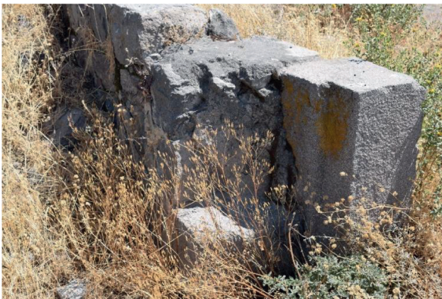
Figura 7. Detalle de la doble jamba (lado Oeste del vano) de la kallanka.