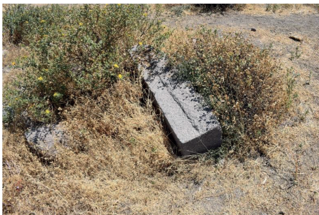
Figura 9. Foto del posible dintel del vano principal, al norte de la kallanka.