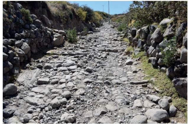
Figura 4 Detalle constructivo de las escalinatas de piedra del camino Inka que viene de las faldas del Misti, cruzaba el río Huasamayo en dirección a la plaza de armas de Chiguata.

Desde la quebrada cabayomanzana, continúa hacia Corralón y desaparece en la parte superior de los cerros Huancune, Januhuara y Candelón. Desde