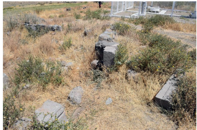
Figura 6. Vista del vano con doble jamba de la kallanka.