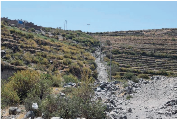
Figura 3 Vista de escalinatas de piedra en mortero de barro del camino Inka que viene de las faldas del Misti, cruzaba el río Huasamayo en dirección a la plaza de armas de Chiguata.