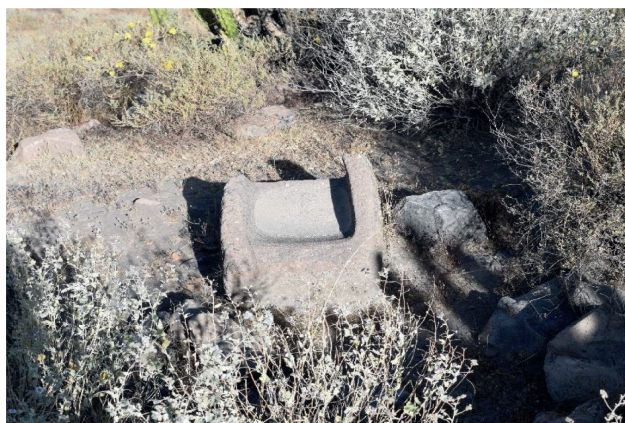
Figura 1. Mortero fragmentado en Pueblo Viejo de Chiguata. Nótese el gran uso que sufrió.