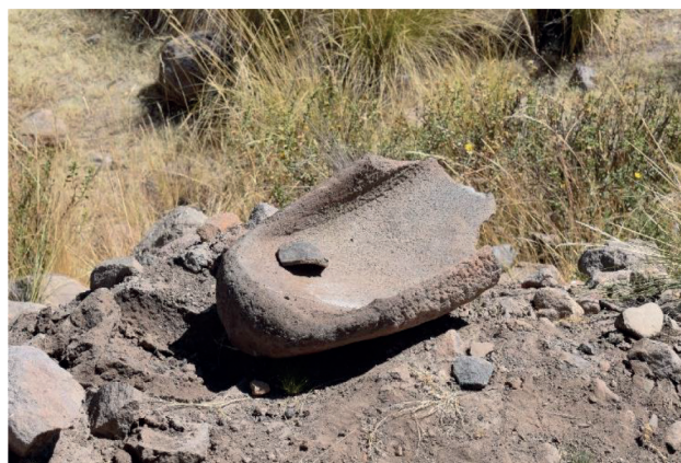
Figura 2. Uno de los morteros que se observan entre los recintos del sitio Tablones.

Es importante destacar que desde Tambo de Ají partían tres ramales: Uno hacia el distrito de Poci en la Provincia de Arequipa, otro a Puquina - Omate (Moquegua), y un tercero al valle de Arequipa. En Tambo de Ají existe una kallanka inka de 32 m x 8 m.