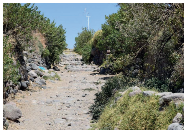
Figura 12. Vista de la escalinata que lleva a la kallanka.

beneficio del Estado inka, dejando a un gran grupo de puquinas, en calidad de mitimaes mineros puquina.