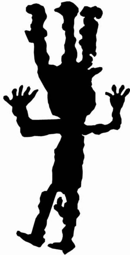
Figura 1. Quílca de Turulaca, Mirave, Tacna. El «Turulaco».

SINAMOS. s/f. Hermanos! Una mañana del mes de noviembre de 1781, y luego de la transitoria derrota de Túpac Amaru, apareció en bandos públicos diseminados a lo largo del Cuzco la siguiente sentencia contra el pueblo. S/pi.