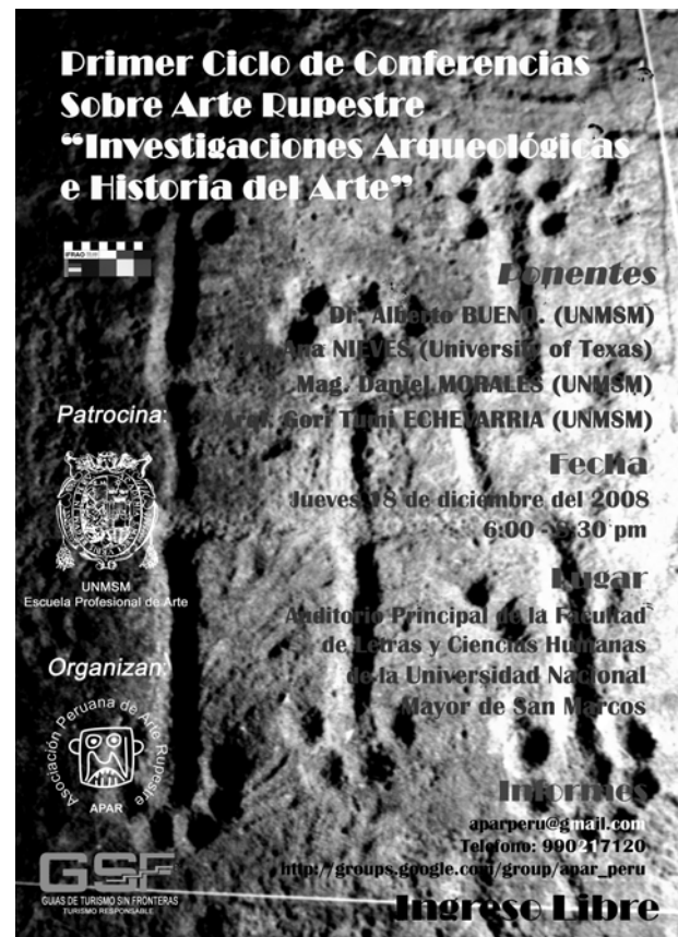
Afiche del 1er Ciclo de Conferencias de APAR