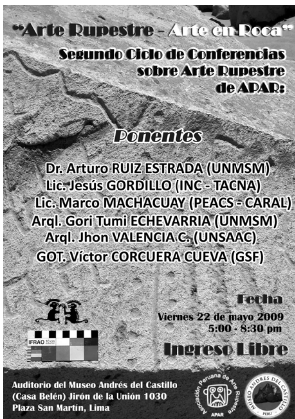
Afiche del 2do Ciclo de Conferencias de APAR