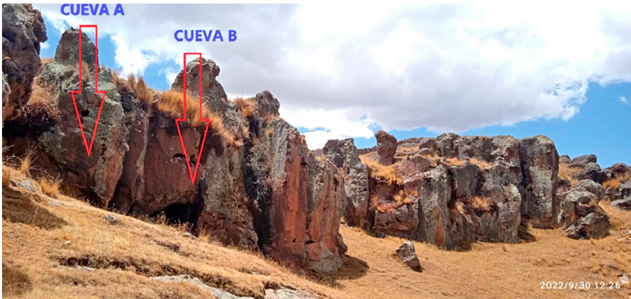
Figura 1. Farallones de roca ígnea, donde se localizan las quillcas. Sitio arqueológico Wachachi qhata.

zoomorfa de color rojo, el cual se encuentra a una altura de 2.30 m. Cabe indicar que el estado de conservación de este panel es malo debido a su exposición a los medios, por lo que el motivo se encuentra deteriorado. Es posible, no obstante, que se pueda identificar más motivos con la ayuda de equipos tecnológicos.