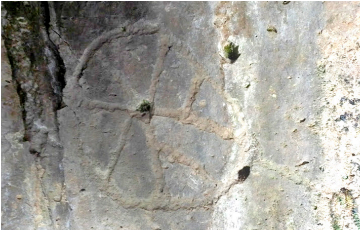
Figura 5. Quillca del panel 3, sitio arqueológico Wachachi Qhata.

De acuerdo a las observaciones realizadas durante la visita al sitio arqueológico de Wachachi Qhata, podemos indicar que las quillcas de este yacimiento son uno de los testimonios culturales más importantes de Ccacho-Limamayo, Chamaca, Chumbivilcas, y forman parte de un complejo cultural asociado que incluye otros componentes culturales antiguos, como arquitectura expresada en