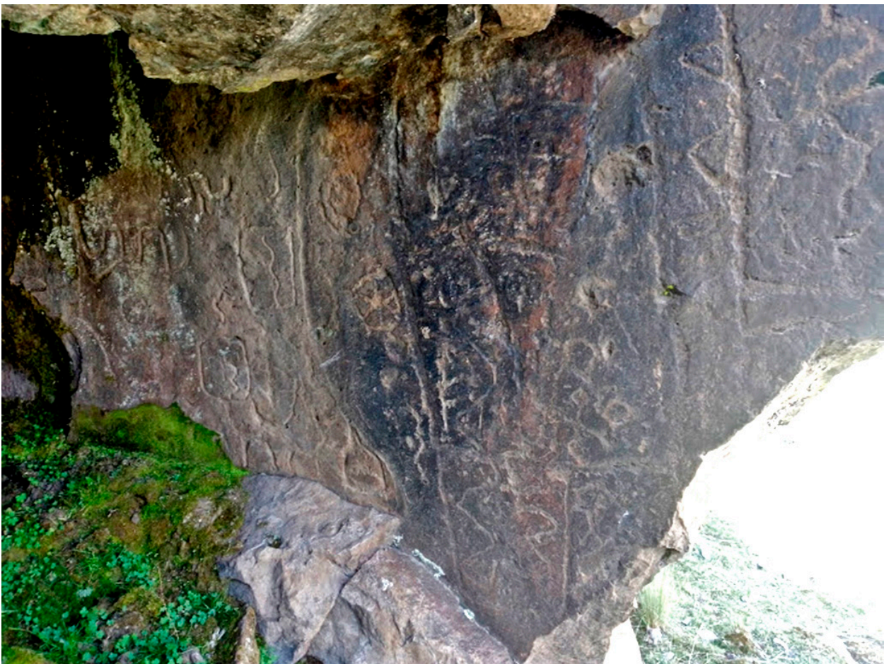
Figura 6. Panel 5 con petroglifos, sitio arqueológico Wachachi Qhata.

Universidad Nacional San Antonio Abad del Cusco