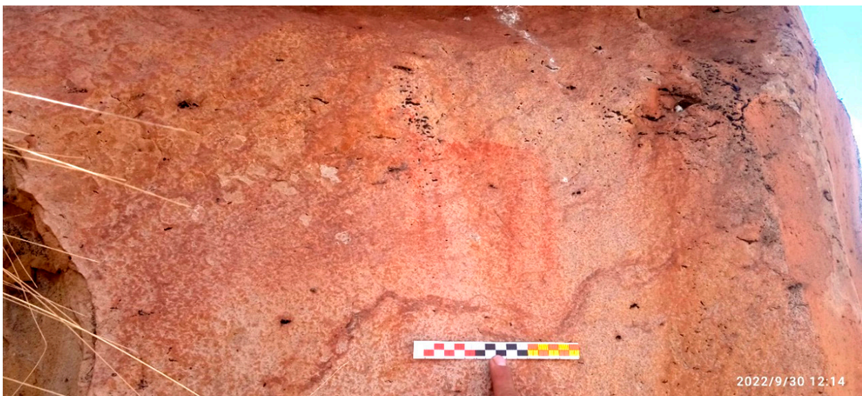
Figura 2. Panel 1 con restos de pinturas. Sitio arqueológico de Wachachi Qhata.

Este panel se ubica dentro de la cueva B, a 3.0 m de profundidad siguiendo un plano horizontal. Este panel expone una quillca compuesta por un solo motivo de forma circular. El diseño destaca por la presencia de un t'oqo en el punto medio de la figura, desde donde se proyectan líneas hacia la circunferencia (Fig. 5). Esta quillca fue claramente producida a base de percusiones, lo que permitió generar surcos que formaron el motivo mencionado. La conservación de este panel es mala, debido principalmente a que el espacio ha sido afectado