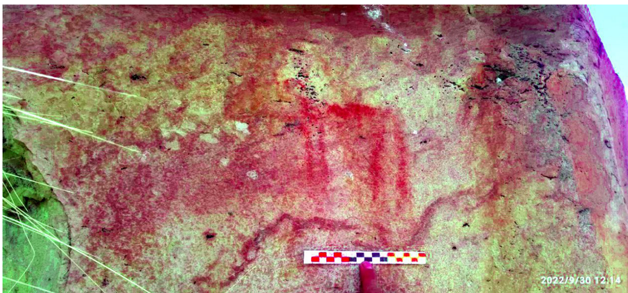
Figura 3. La misma imagen de la figura 2, procesada con DStretch. Sitio arqueológico de Wachachi Qhata.