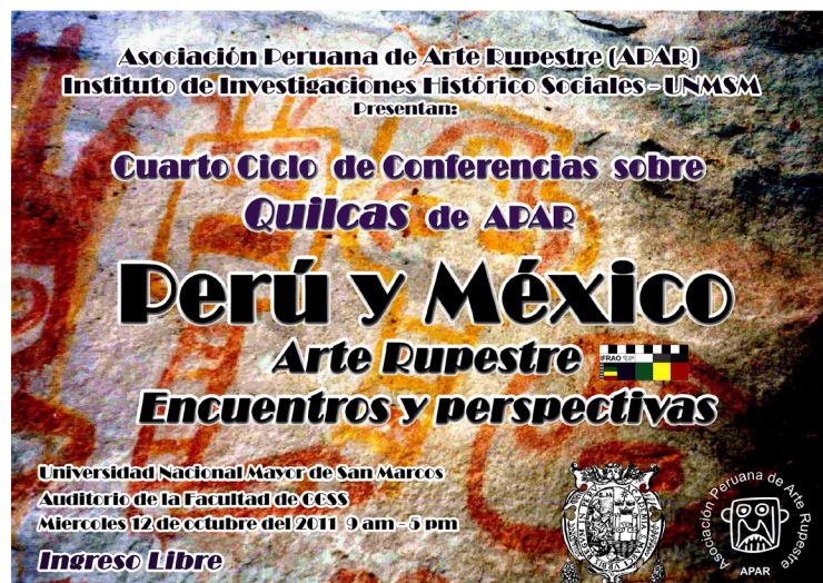
Figura 1. Afiche del IV Ciclo de Conferencias sobre Quilcas de APAR, Perú y México, Arte Rupestre, Encuentros y Perspectivas. UNMSM 2011.

Continuaron disertando el arqueólogo Gori Tumi, quien expuso un panorama de sus investigaciones en la cuenca del río Chillón o Carabayllo, enfocándose en el sitio de Checta. Es en este lugar donde se ha podido determinar una larga secuencia de producción rupestre de más de dos mil años, la cual pone en evidencia el grado de desarrollo gráfico entre 3000 y 800 aEC, vinculado a grandes procesos culturales, entre ellos el desarrollo civilizatorio de Caral y el impacto Chavín en la costa central del Perú. Checta es un sitio que permite articular la producción de quilcas en toda la costa central, como se pudo ver también durante la exposición del arqueólogo Marco Machacuay,