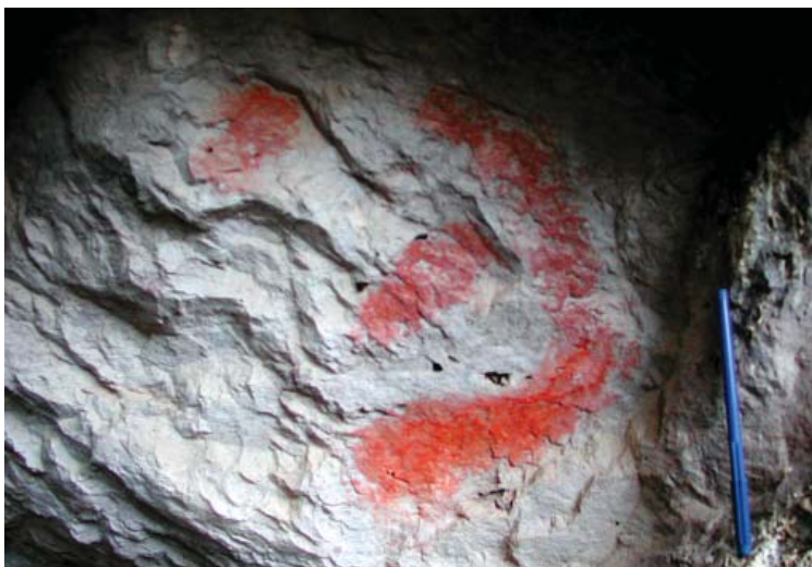
Figura 11. Detalle de las pinturas rupestres del sitio arqueológico de Mansilla.