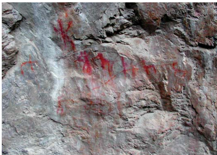
Figura 5. Vista panorámica del panel 1, quilcas, pinturas rupestres del sitio arqueológico de Suni.