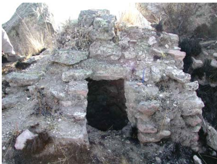
Figura 3. Vista de una chulpa, sitio de Suni.

Se ha identificado sobre la superficie, abundante material cerámico de