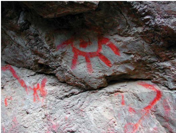
Figura 7. Vista de algunas figuras del panel 2, destaca la figura abstracta semicircular con apéndices lineales proyectados (a modo de sol?).