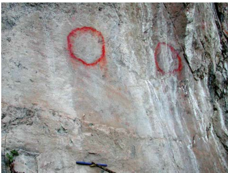
Figura 10. Detalle de las pinturas rupestres del sitio arqueológico de Mansilla.