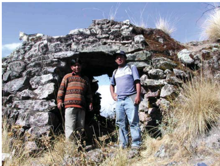
Figura 4. Vista de la altitud de una de las edificaciones más representativas del sitio de Suni.