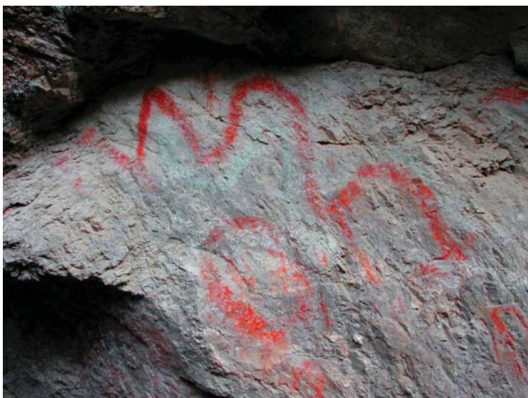
Figura 8. Vista de detalle de las pinturas del sitio de Suni.

naturaleza doméstica que va desde el Intermedio Temprano hasta el Horizonte Tardío.