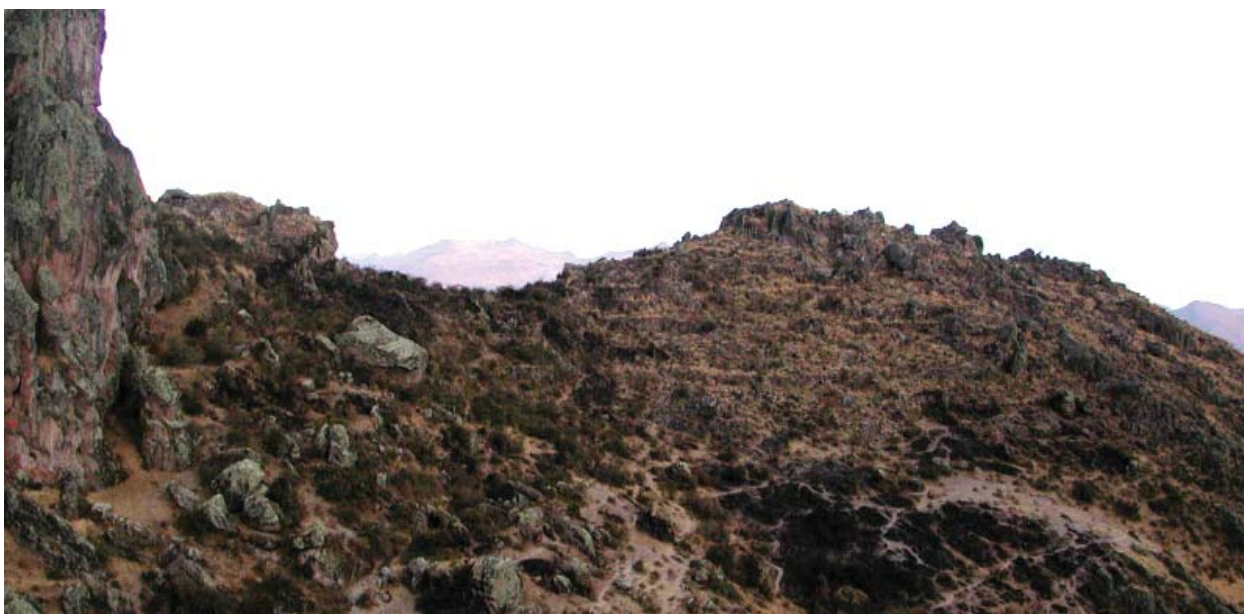
Figura 9. Vista panorámica del sitio de Mansilla.