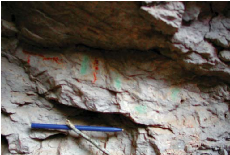
Figura 6. Vista panorámica del panel 2, quilcas, pinturas rupestres del sitio arqueológico de Suni.