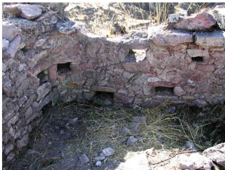
Figura 2. Vista parcial del interior de un recinto doméstico, sitio Suni

B.- Las cámaras funerarias o "chulpas". Su distribución se da de manera restringida y aislada. Se trata de estructuras rectangulares de 4 a 6 metros de largo, por 1 m de ancho, con muros de 0.35 m de ancho, por 1 m de alto. La cubierta fue hecha mediante la técnica de la falsa bóveda con el empleo de lajas y barro batido. Por lo general, cuatro lajas definen el vano con una abertura de 0.40 m por lado. En el interior los restos óseos están desarticulados y pertenecen a varios individuos, por lo que definimos el carácter múltiple de los contextos funerarios (Figs. 3 y 4).