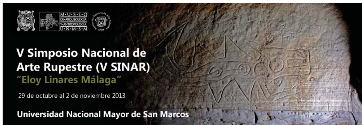
Figura 1. Imagen zootropomorfa Nasca, registrada por Ana Nieves y Gori Tumi en la quebrada Majuelos en la cuenca del río Nasca en Ica. Símbolo del VI SINAR "Eloy Linares Málaga".