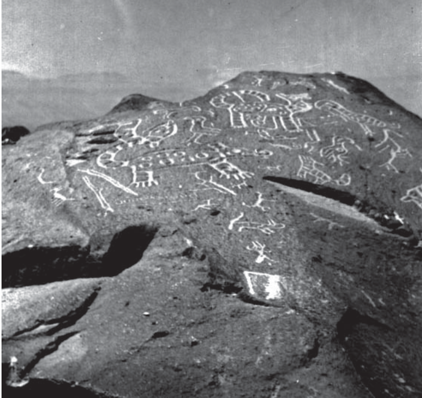
Quilcas del sitio arqueológico Hatunquilcamarca o Toro Muerto.