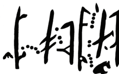
Figura 3. Quilca 23-4. Quebrada Palo. Lima.

dispatched Cacircapac for a general inspection of the lands and pastures, giving him his commission in stripes on painted stick” 4 . The criticisms regarding Larco Hoyle’s theory have no actual basis but are based on a generalization.