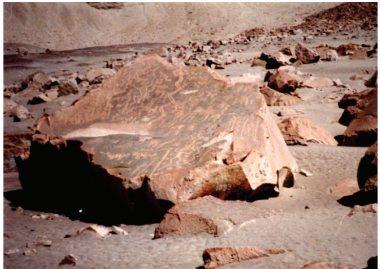
Figura 3: Quilcas de Toro Muerto.