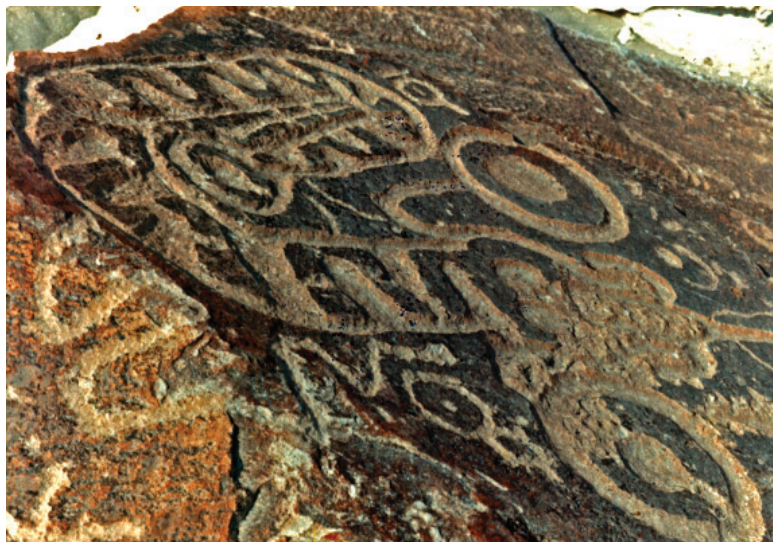
Figura 10: Quilcas de Toro Muerto.