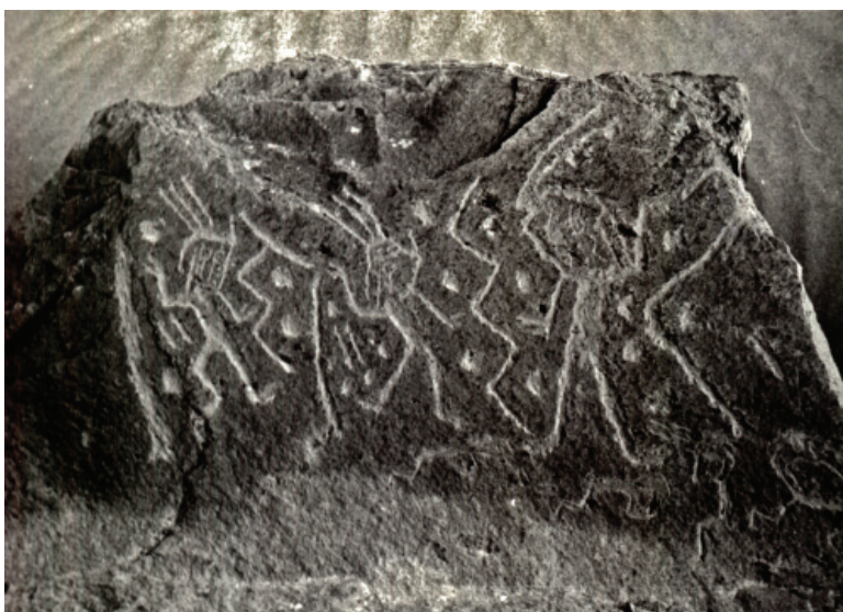
Figura 6: Quilcas de Toro Muerto.