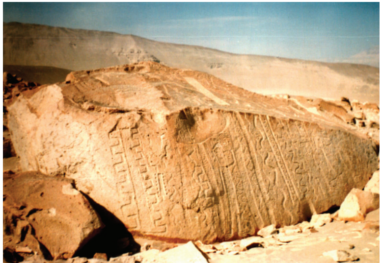
Figura 9: Quilcas de Toro Muerto.