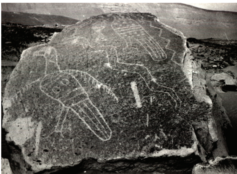
Figura 7: Quilcas de Toro Muerto.