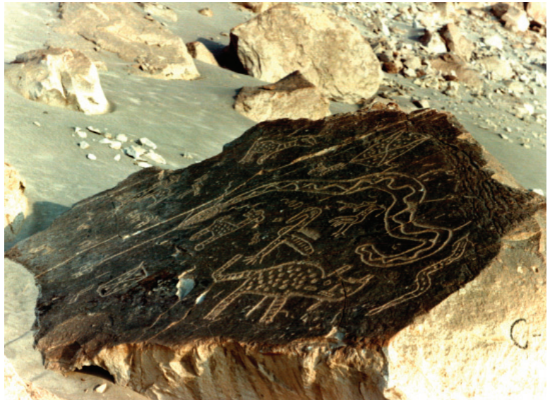
Figura 8: Quilcas de Toro Muerto.