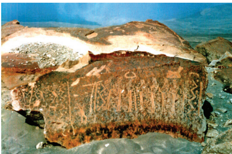
Figura 5: Quilcas de Toro Muerto.