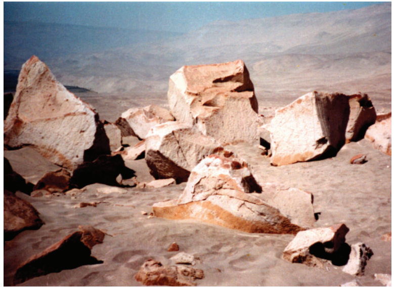
Figura 2: Quilcas de Toro Muerto.

Se han calculado 5000 bloques con millares de figuras.