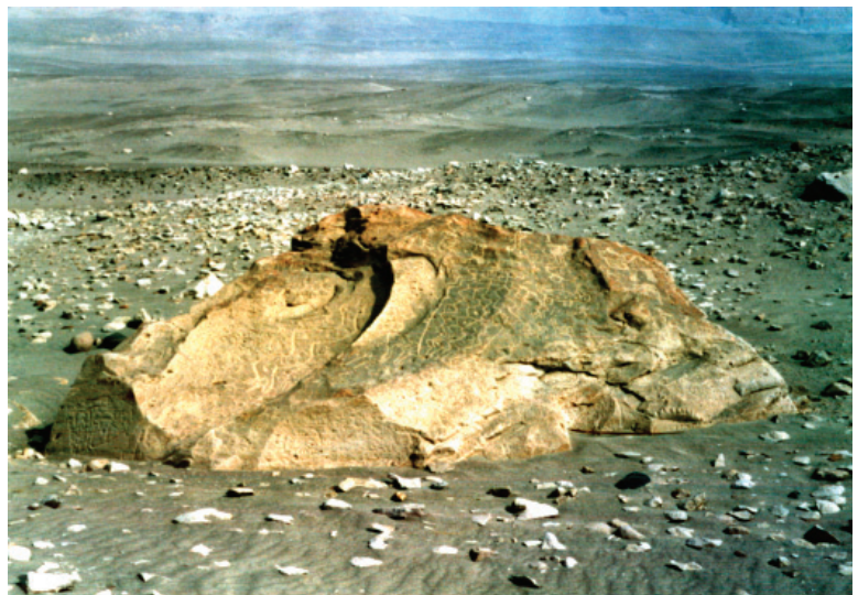
Figura 4: Quilcas de Toro Muerto.