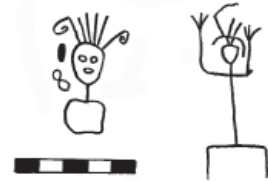
Figura 6. Motivos de la cara posterior de la Quillca N° 1. Sonomoro.