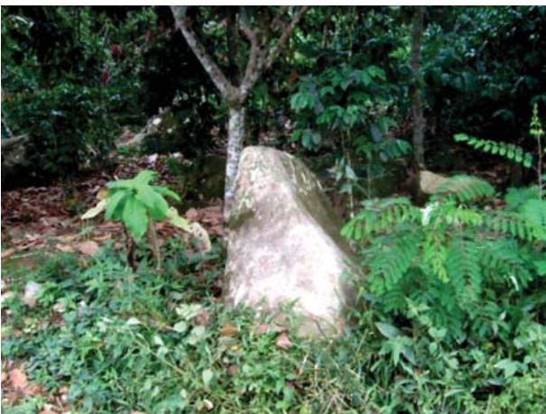
Figura 22. Quillca 2 de La Libertad de Arpayo.