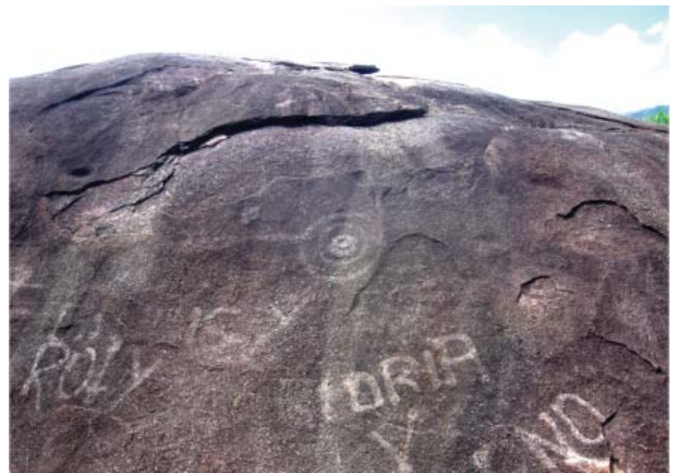
Figura 33. Círculos concéntricos, Quillca S.M de Pangoa.