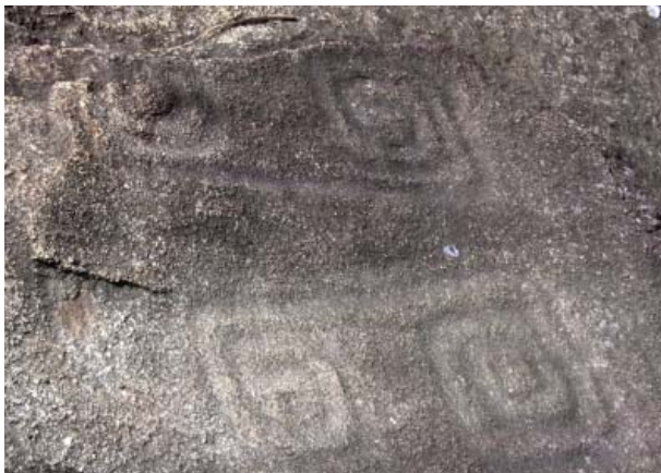
Figura 32. Figura geométrica de la cara sur, S.M de Pangoa.