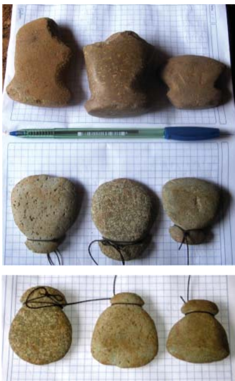
Figura 44 y 45. Hachas de piedra halladas en los alrededores de la Quillca N. Horizonte.