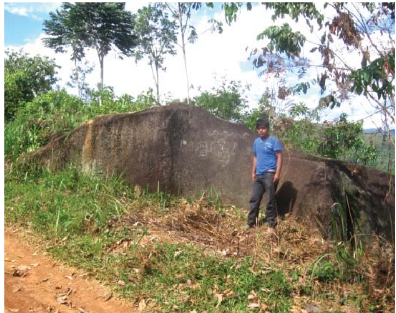
Figura 37. Vista panorámica del Quillca de Nuevo Horizonte.