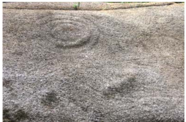
Figura 29. Detalle, Quillca 5 de La Libertad de Arpayo.