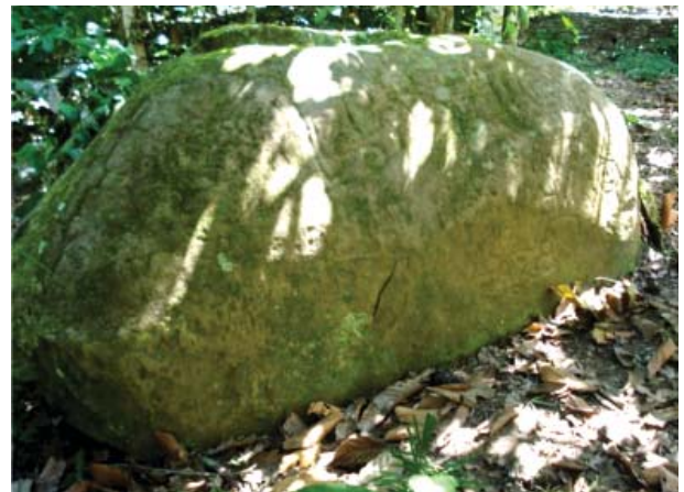
Figura 7. Vista panorámica de la Quillca N° 2 de Sonomoro.