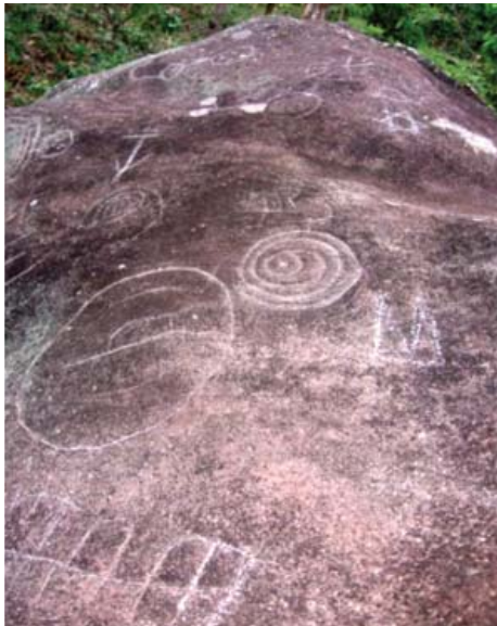
Figura 16. Ms 16 y 20, quillca de Alto Chavini.