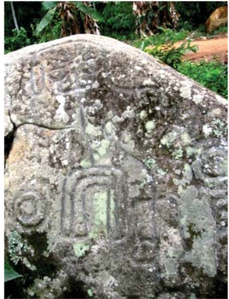
Figura 21. Quillca 1 de La Libertad de Arpayo.