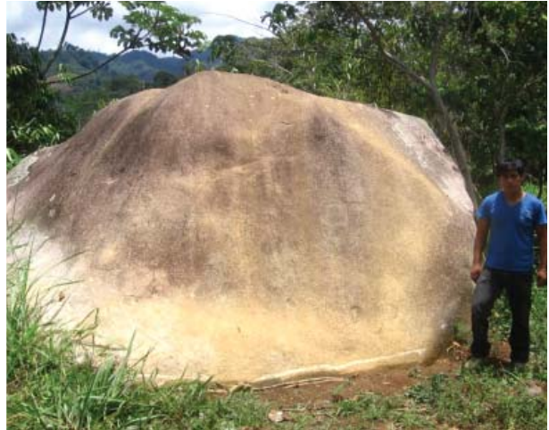
Figura 35. Quillca de Vilcabamba.