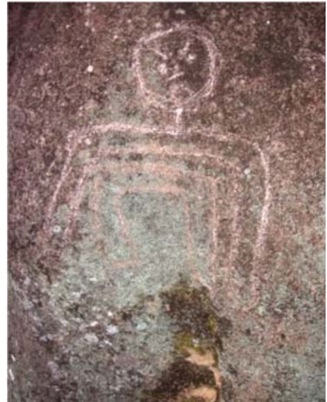
Figura 13. Motivo 24, quillca de Alto Chavini.