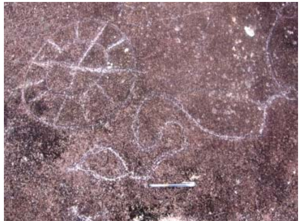
Figura 9. Vista de los Motivos 1 y 2, quillca de Alto Chavini.