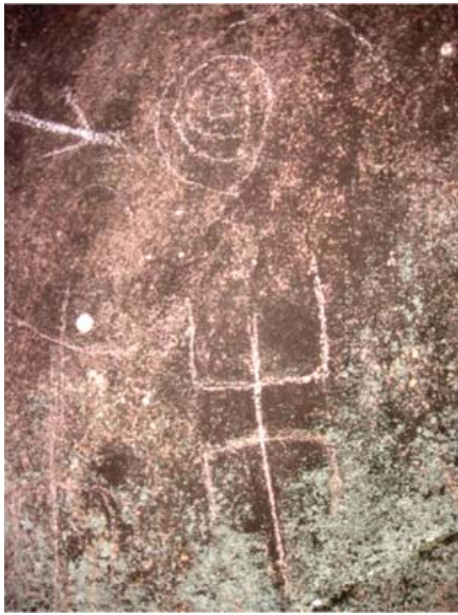
Figura 14. Ms 22 y 21, quillca de Alto Chavini.