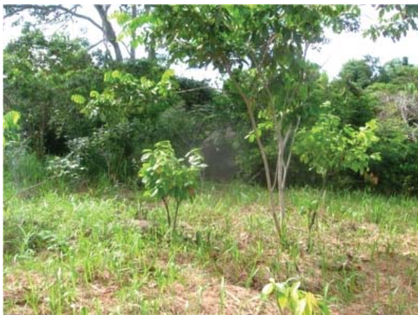
Figura 18. Vista panorámica de la quillca de Bajo Celendín.