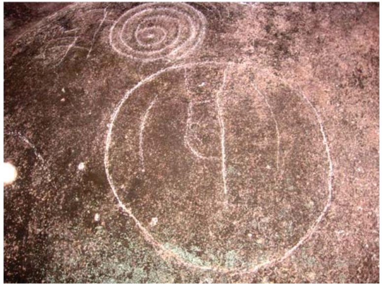
Figura 17. Motivo 20, quillca de Alto Chavini.