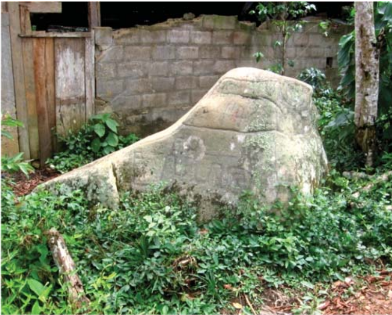
Figura 20. Quillca 1 de La Libertad de Arpayo.