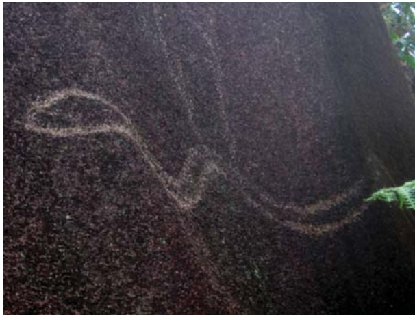
Figura 42. Figuras de la cara sur. Quillca de N. Horizonte.