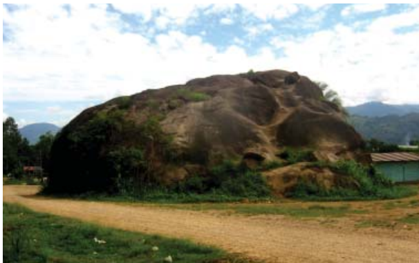
Figura 30. Vista panorámica de la quillca de San Martín de Pangoa.