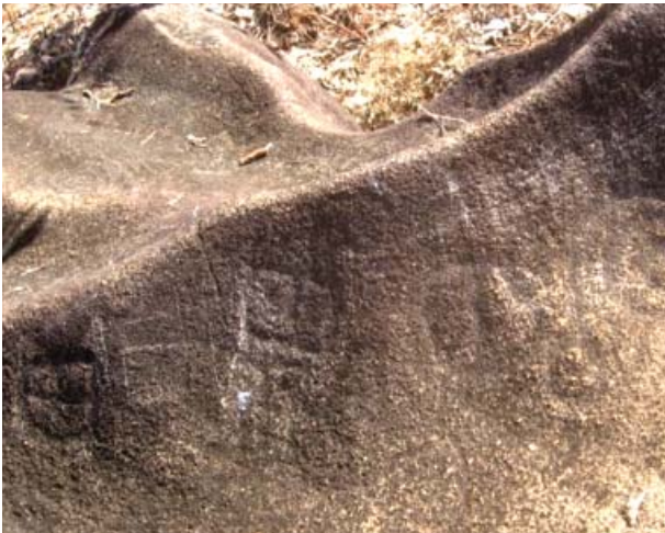
Figura 38. Figuras parte superior, Quillca de N. Horizonte.