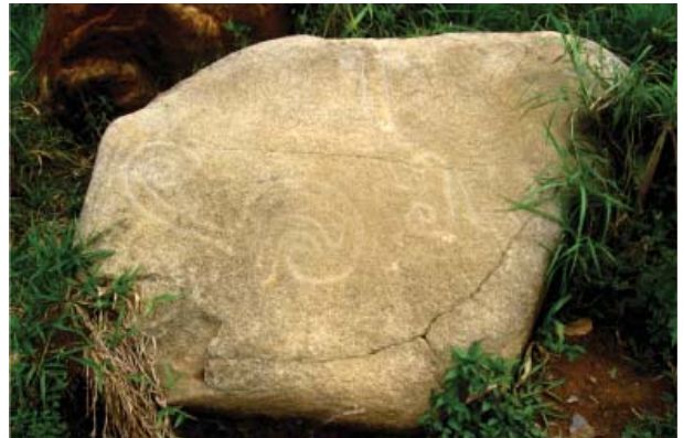
Figura 27. Quillca 4 de La Libertad de Arpayo.