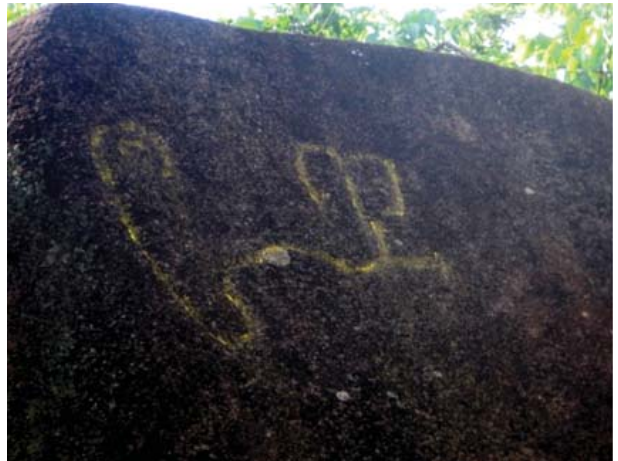
Figura 43. Figuras de la cara sur. Quillca de N. Horizonte.