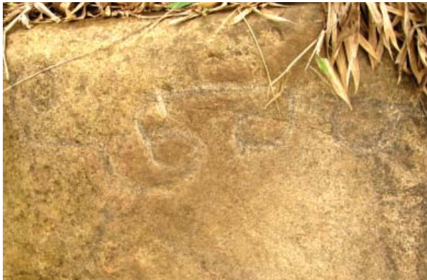
Figura 26. Quillca 4 de La Libertad de Arpayo.