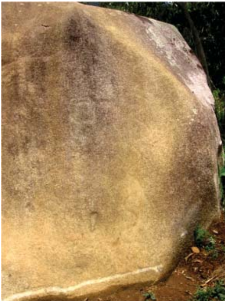
Figura 36. Detalle, Quillca de Vilcabamba.