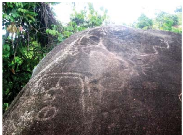
Figura 19. Vista panorámica de los motivos de la quillca de Bajo Celendín.