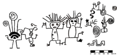
Figura 5. Vista de las figuras representadas en la parte frontal de la Quillca No 1 de Sonomoro.