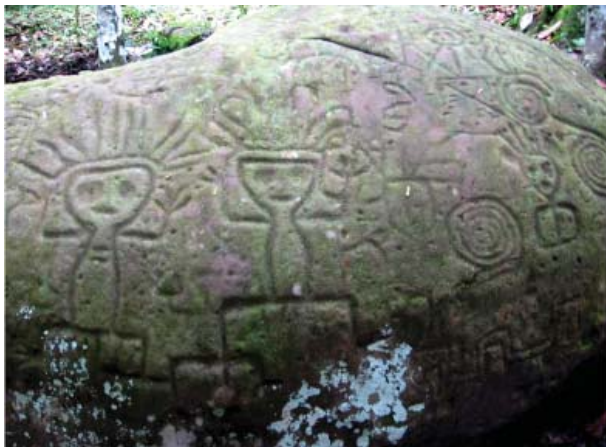
Figura 3. Detalle de los motivos de la Quillca N° 1, Sonomoro.