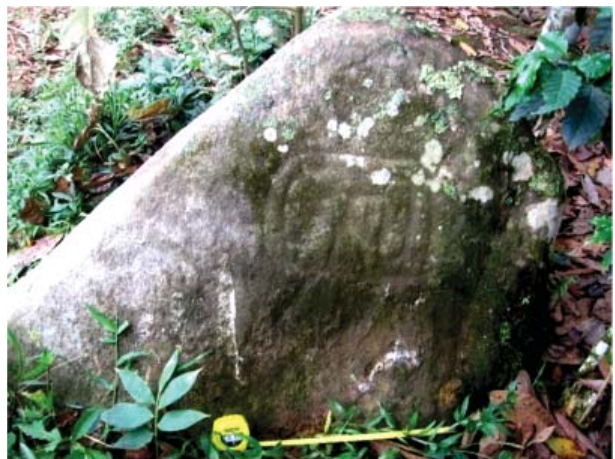
Figura 23. Detalle, Quillca 2 de La Libertad de Arpayo.