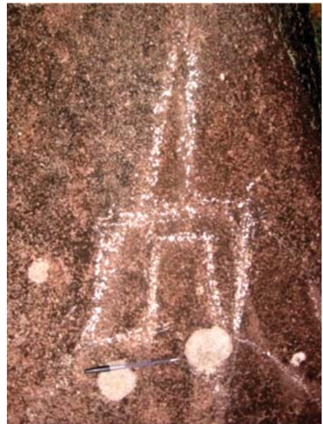
Figura 11. Motivo 19, quillca de Alto Chavini.