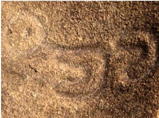
Figura 40. Figuras parte superior, Quillca de N. Horizonte.