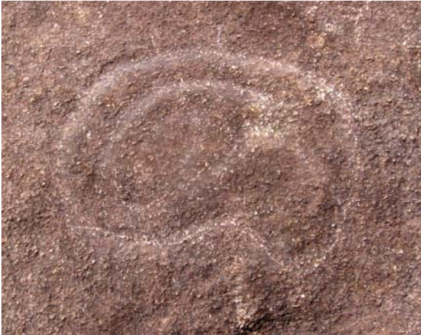
Figura 34. Figura geométrica, Quillca S.M de Pangoa