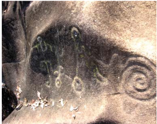
Figura 39. Figuras parte superior, Quillca de N. Horizonte.