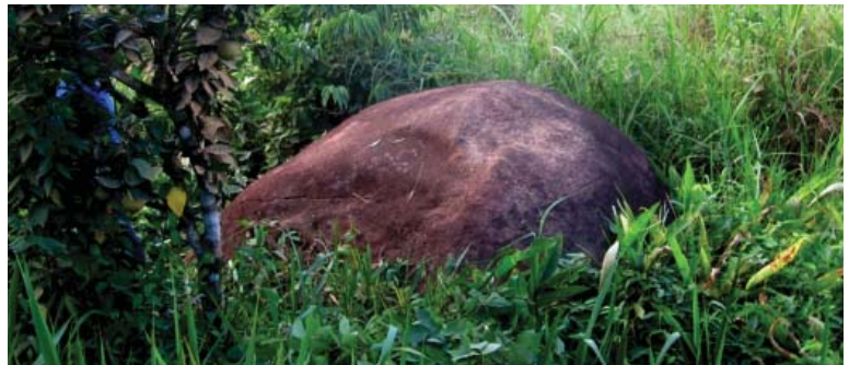
Figura 46. Vista panorámica de la Quillca 1 de Bajo Quiatari.