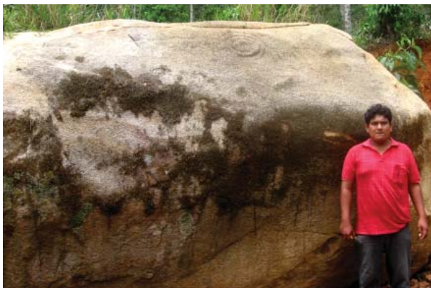
Figura 28. Quillca 5 de La Libertad de Arpayo.