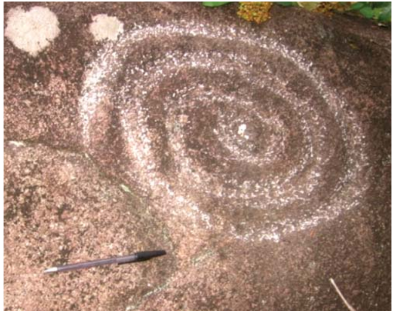
Figura 15. Motivo 12, quillca de Alto Chavini.