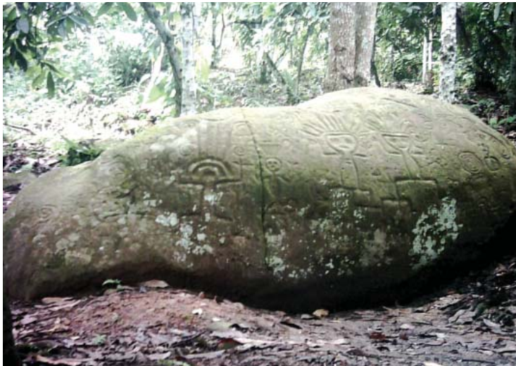
Figura 2. Vista panorámica de la quillca N° 1, sitio Sonomoro.