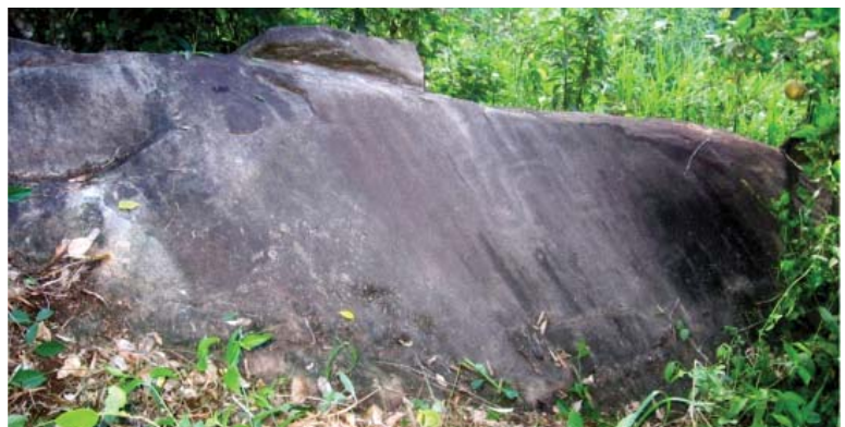
Figura 47. Vista panorámica de la Quillca 2 de Bajo Quiatari.