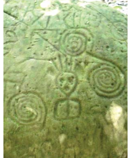
Figura 4. Detalle de los motivos 6 y 7 de la Quillca N° 1, sitio Sonomoro.