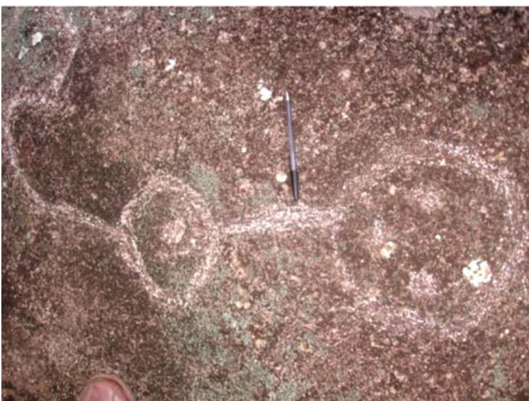
Figura 12. Motivo 5, quillca de Alto Chavini.