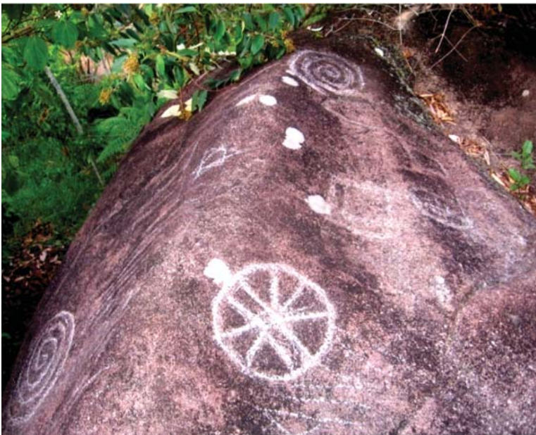
Figura 10. En primer plano motivo 10, al fondo vista de los espirales, motivos 12 y 13, quillca de Alto Chavini. Todos los motivos repasados por gente local.