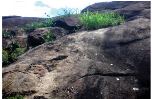
Figura 31. Figuras de la parte superior, S.M de Pangoa.