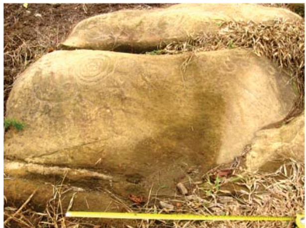
Figura 25. Detalle, quillca 3 de La Libertad de Arpayo.