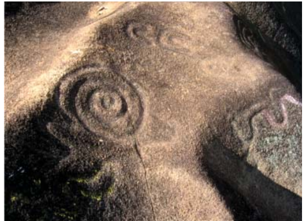
Figura 41. Figuras de la cara sur. Quillca de N. Horizonte.