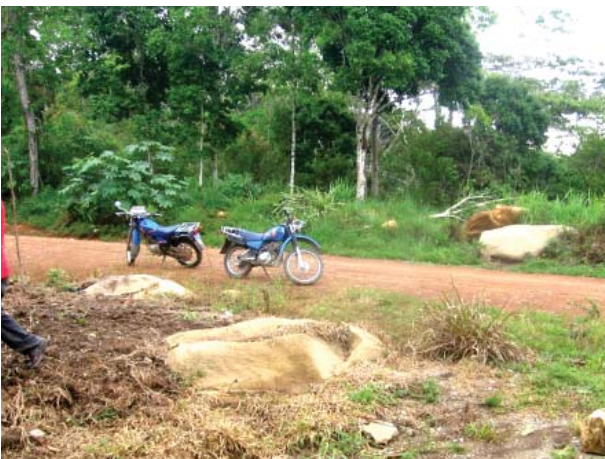
Figura 24. Quillca 3 de La Libertad de Arpayo.