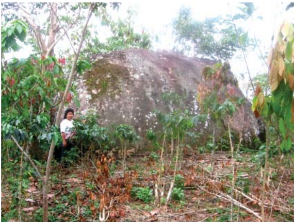
Figura 8. Vista panorámica de la quillca de Alto Chavini.