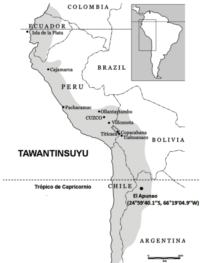
Figura 1. Mapa del Tawantinsuyu con la ubicación geográfica de El Apunao.

En tiempos incaicos la observación del Sol, la Luna, las estrellas y determinadas constelaciones era parte del manejo y control de distintos tipos de calendario. Se supone la existencia de especialistas que llevaban la cuenta de los días llamados camayoc o “... funcionarios... que entendían exclusivamente de realizar esas observaciones. En las provincias fueron levantados