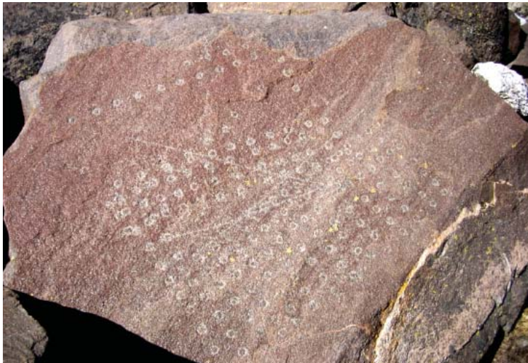
Figura 3. Petroglifo quipu de El Apunao.