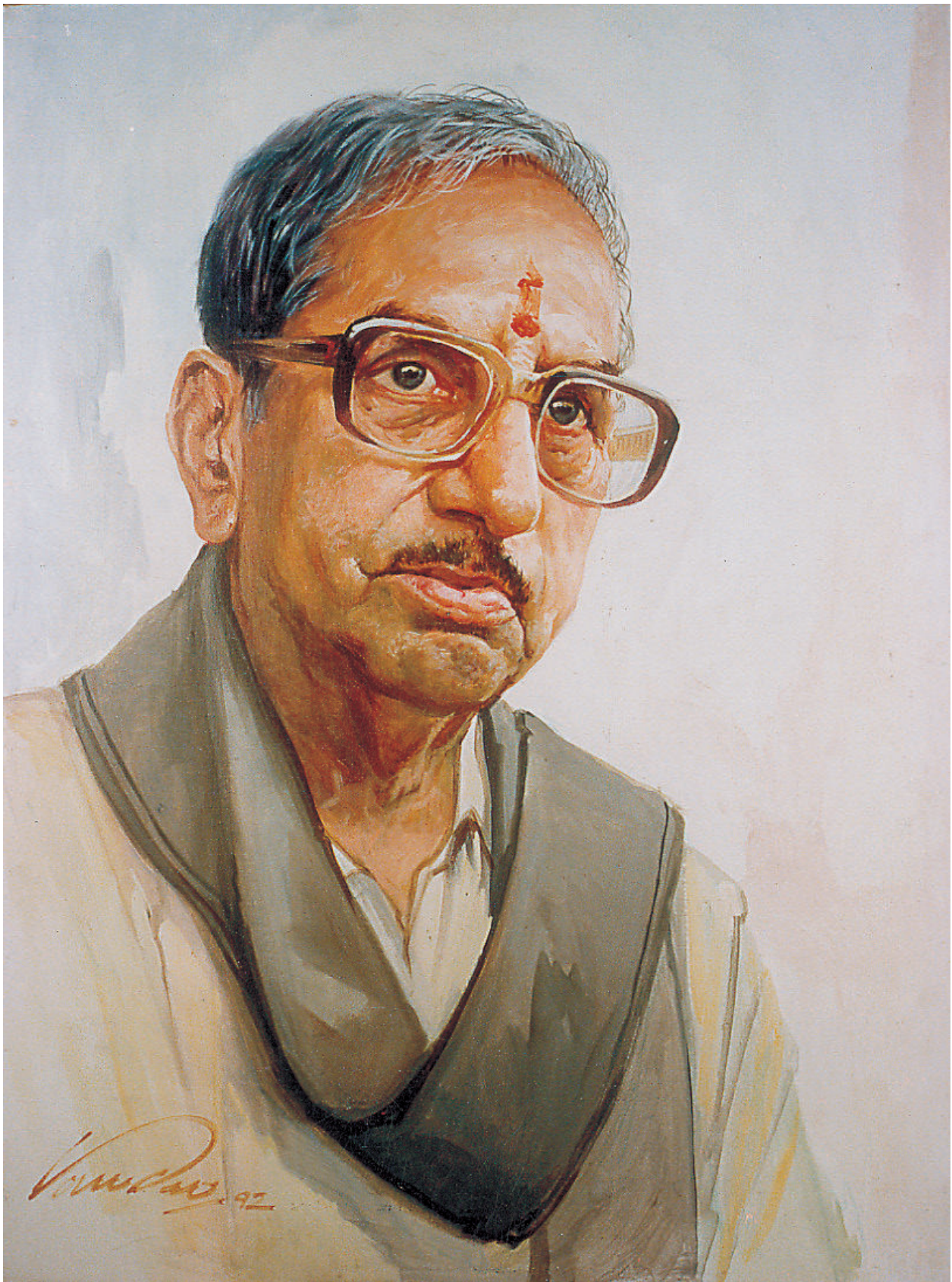
Figura 1. Dr. Vishnu Shridhar Wakankar