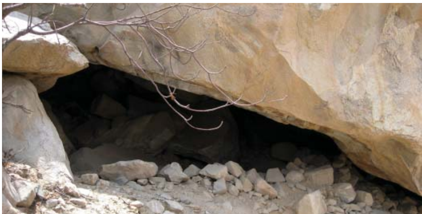
Figura 1. Entrada al abrigo rocoso conteniendo pintura rupestre, sitio arqueológico de Quivi. Foto Wilber Saucedo 2008.