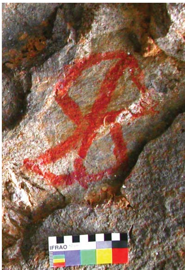
Figura 2. Motivo geométrico de color rojo. Abrigo con pinturas de Quivi.