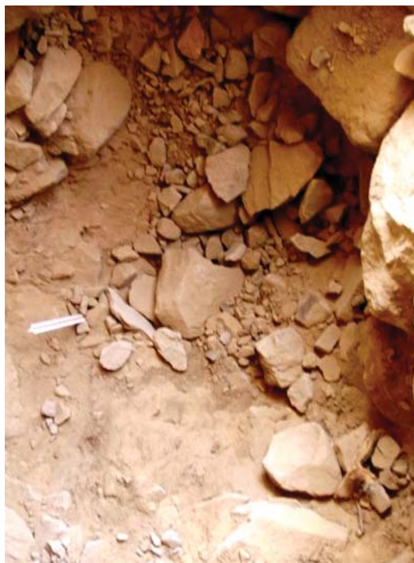
Figura 5. Pozo de huaqueo excavado en la superficie del abrigo de Quivi disturbando todo su contenido arqueológico. Foto Wilber Saucedo 2008.